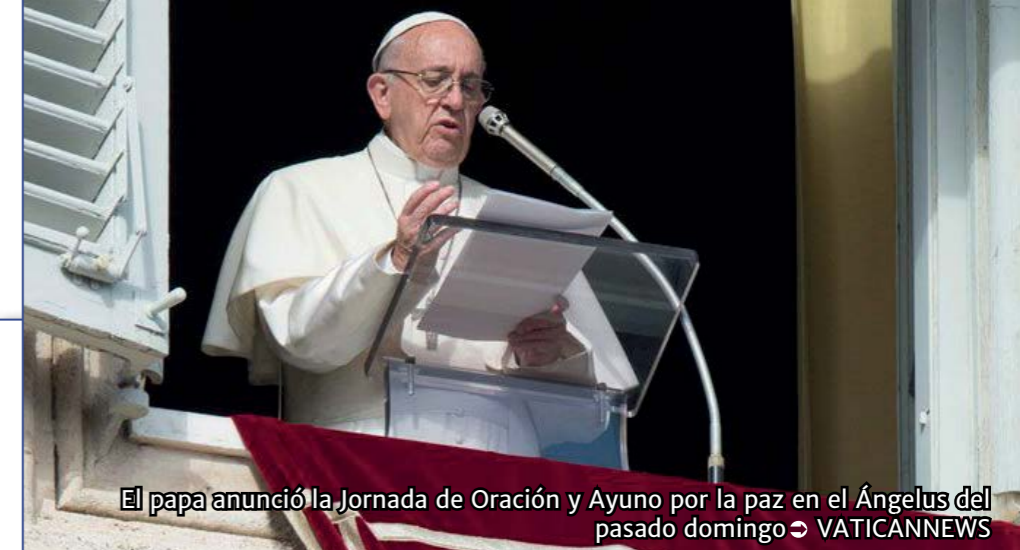
El papa anunció la Jornada de Oración y Ayuno por la paz en el Ángelus del pasado domingo