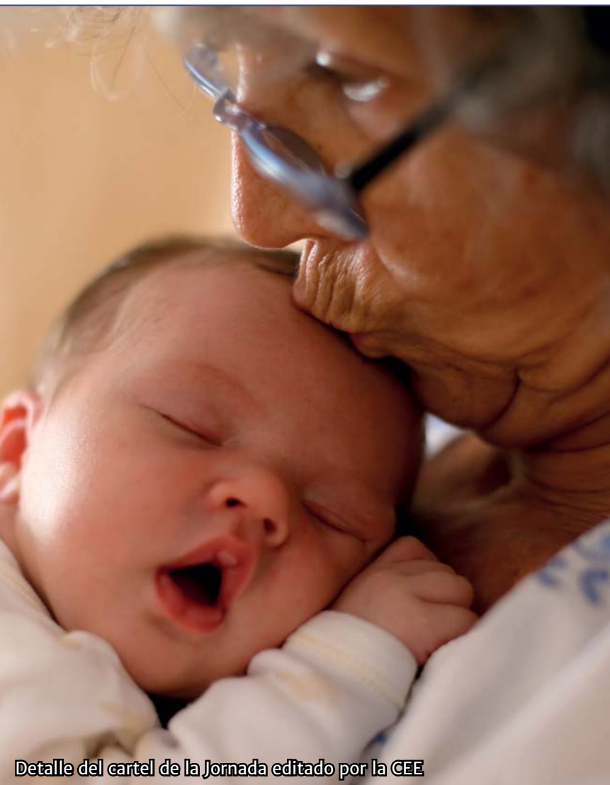
Detalle del cartel de la Jornada editado por la CEE