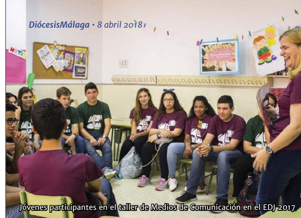
Jóvenes participantes en el taller de Medios de Comunicación en el EDJ 2017