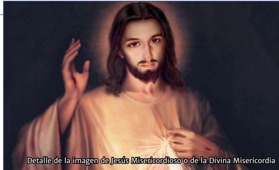
Detalle de la imagen de Jesús Misericordioso o de la Divina Misericordia

En la propia homilía afirmaba san Juan Pablo II: «hoy es verdaderamente grande mi alegría al proponer a toda la Iglesia, como don de Dios a nuestro tiempo, la vida y el testimonio de sor Faustina Kowalska. La divina Providencia unió completamente la vida de esta humilde hija de Polonia a la historia del siglo XX, el siglo que acaba de terminar. En efecto, entre la primera y la segunda guerra mundial,