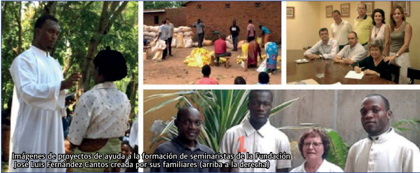
Imágenes de proyectos de ayuda a la formación de seminaristas de la Fundación José Luis Fernández Cantos creada por sus familiares (arriba a la derecha)