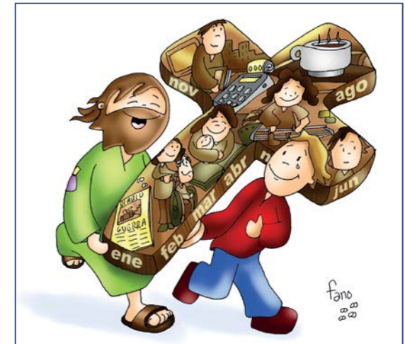
Cogeremos juntos la cruz de cada día