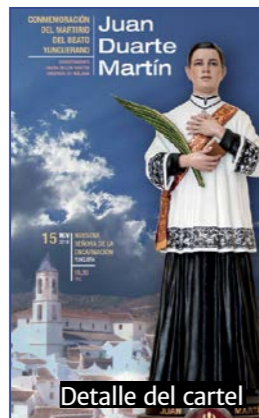
Detalle del cartel