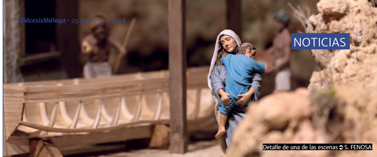
Detalle de una de las escenas S. FENOSA

El listado de capellanes nombrados para cada centro puede consultarse en www.diocesismalaga.es