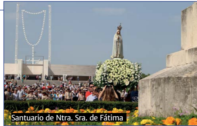
Santuario de Ntra. Sra. de Fátima