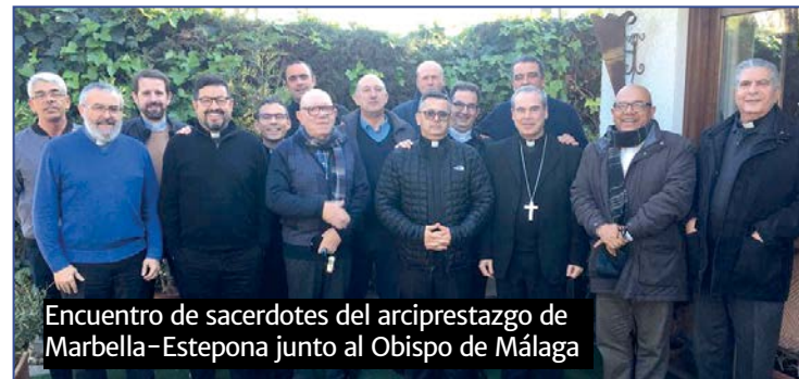
Encuentro de sacerdotes del arciprestazgo de Marbella-Estepona junto al Obispo de Málaga

El equipo sacerdotal del arciprestazgo de Marbella-Estepona se ha reunido con el Obispo de Málaga, Jesús Catalá, para organizar la Visita Pastoral que el prelado de la diócesis realizará a esta zona pastoral en los próximos meses.