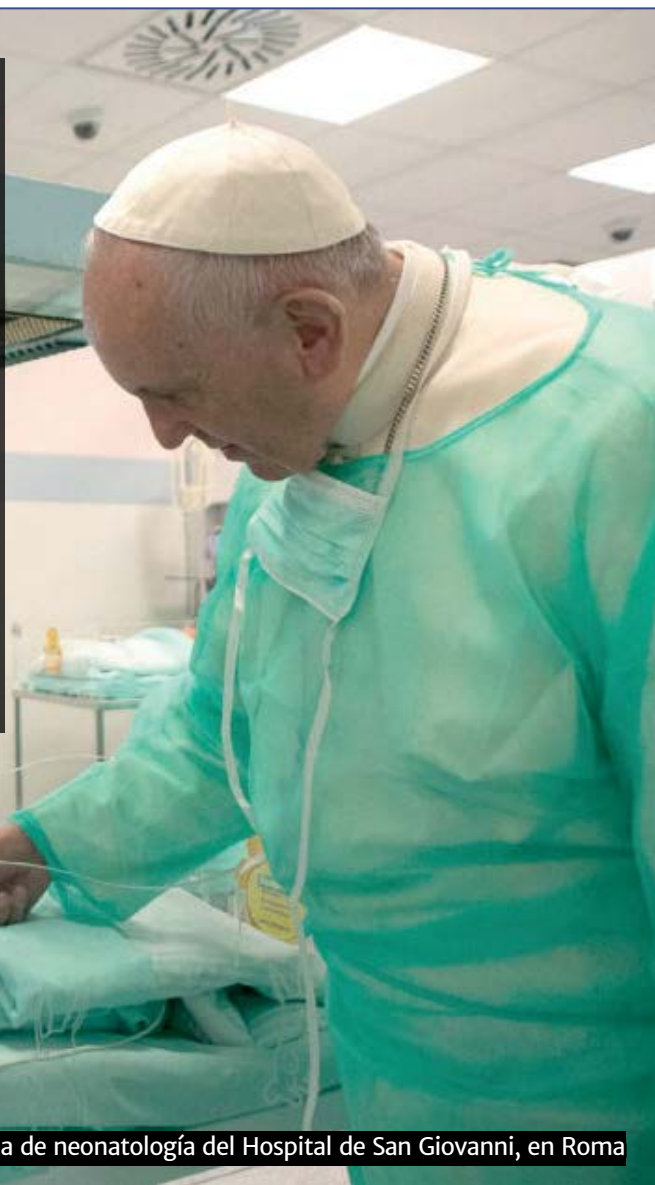
El papa Francisco durante una visita a la zona de neonatología del Hospital de San Giovanni, en Roma