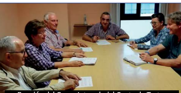
Reunión del Grupo Intereclesial Contra la Trata, que componen representantes de las distintas instituciones que trabajan en el ámbito de la trata en Málaga

Si son creyentes que tengan muy presente todo esto, cojan una imagen: una cruz, una estampa de una virgen a la que tengan devoción, la Biblia, cada uno lo suyo, y la tengan siempre presente. Es importante que lo vivan desde la alegría y sí, se puede vivir desde la alegría porque no es el fin. Y si te vas a morir porque el cáncer es irreversible, disfruta lo que te queda de vida, porque pensamos en la muerte cuando tenemos una enfermedad pero no pensamos que cuando no nos pasa nada puede darnos un infarto o tener un accidente. Es importante ser positivo.