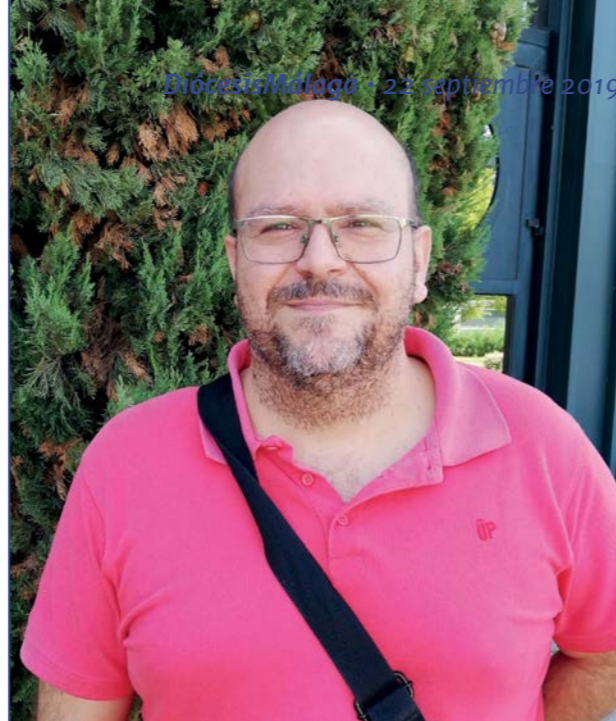
DiócesisMálaga • 22 septiembre 2019

Más información en la web de la asociación: www.galvezginachero.es .