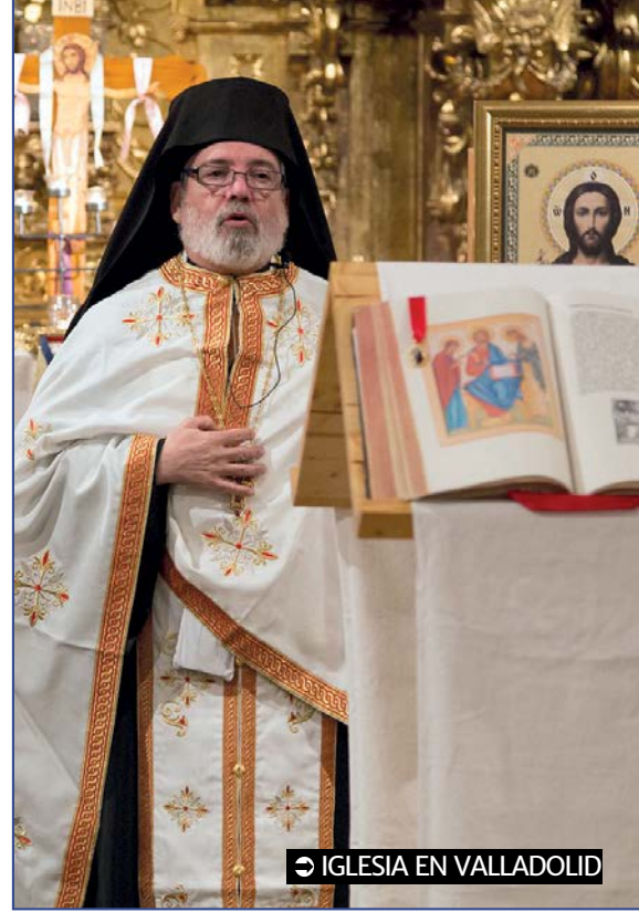
IGLESIA EN VALLADOLID

La parroquia de Nuestra Señora del Rosario de Fuengirola acogerá un nuevo Encuentro Ecuménico por el Cuidado de la Creación tras la celebración, el pasado día 1, de esta Jornada. Una celebración que encuentra sus orígenes en la Iglesia Ortodoxa y a la que el Papa se unió hace unos años. El archimandrita Demetrio (Valencia, 1957), de la Metrópolis Ortodoxa de España y Portugal, profundiza en el sentido ecuménico de esta jornada