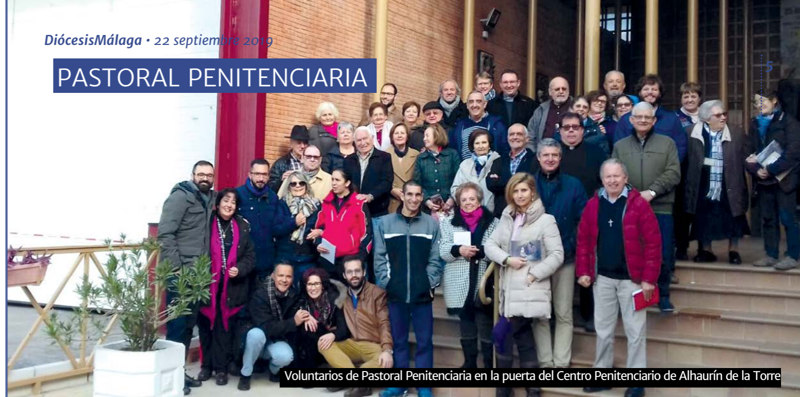
Voluntarios de Pastoral Penitenciaría en la puerta del Centro Penitenciario de Alhaurín de la Torre