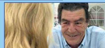
Emilio Calatayud, juez de menores