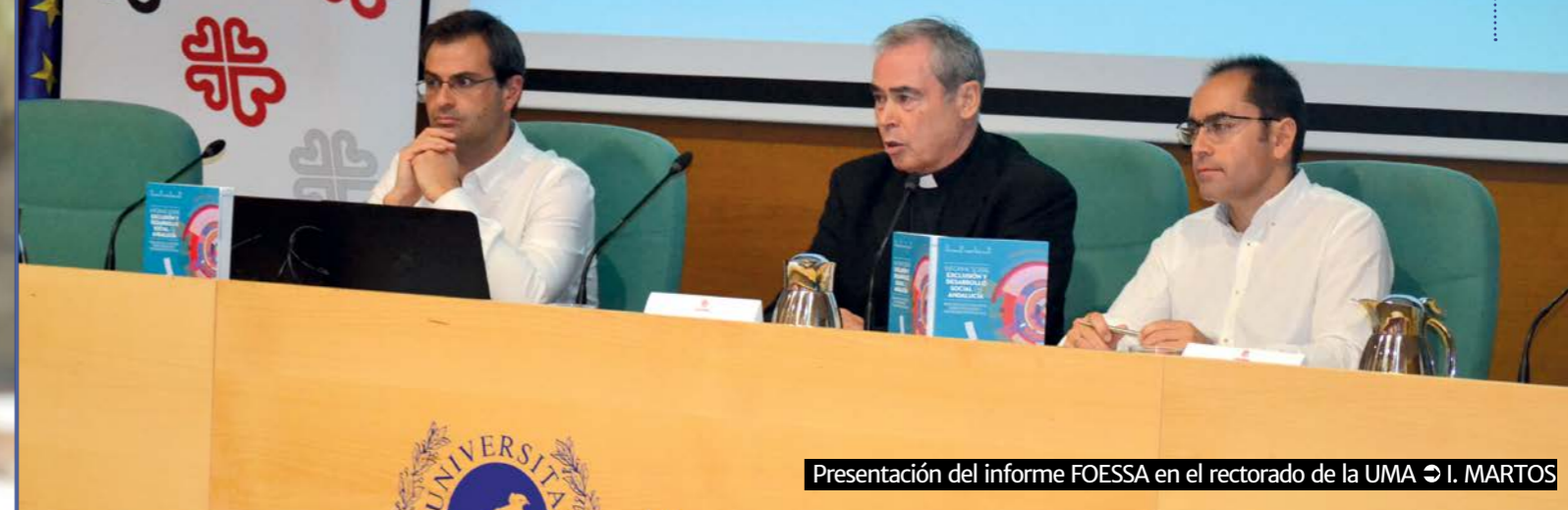
Presentación del informe FOESSA en el rectorado de la UMA