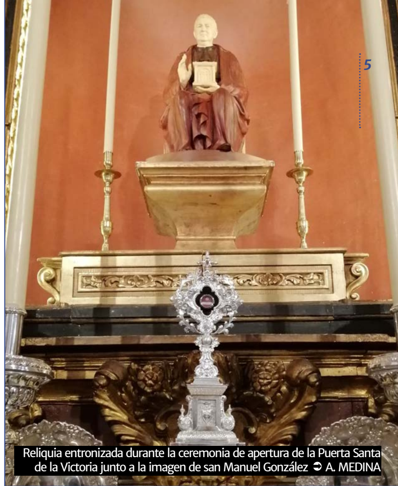
Reliquia entronizada durante la ceremonia de apertura de la Puerta Santa de la Victoria junto a la imagen de san Manuel González ➔ A. MEDINA