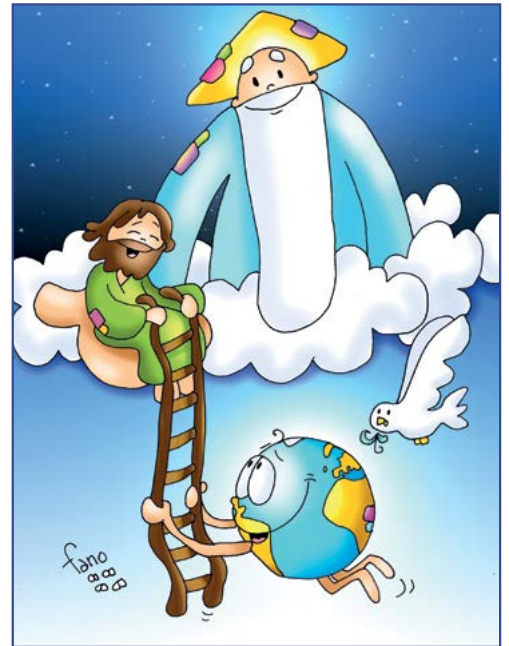
Está sentado a la derecha del Padre