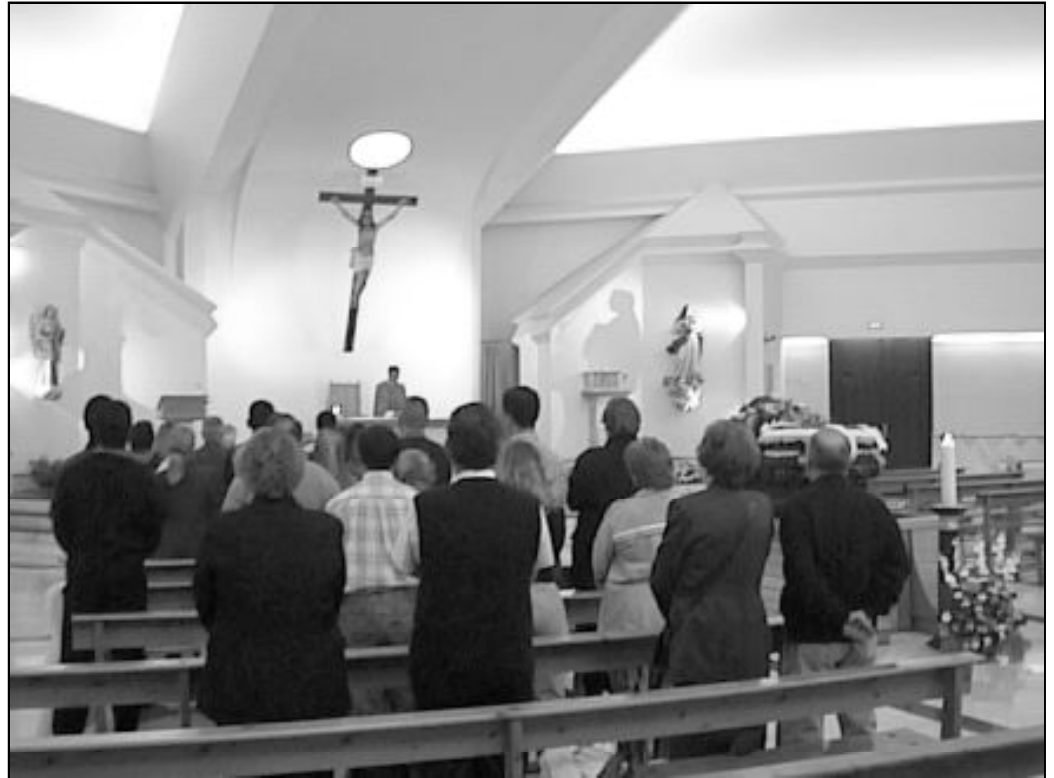
Dios tiene poder para transformar la vida terrena en una nueva y eterna

Sin embargo, sabemos que Dios, que es el autor y dador de la vida, tiene poder también para transformarla en una vida nueva y eterna, en la que ya no habrá ni luto, ni llanto, ni dolor. Y esto, gracias a Quien por nosotros experimentó la muerte en su humanidad y nos enseñó con su ejemplo y palabra la promesa de la resurrección definitiva. Quienes un día, lamentable y doloroso nos abandonaron, han