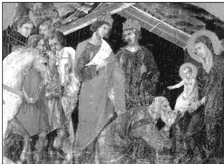
Adoración de los Magos

Al leer la narración del Evangelio de San Mateo, me surgen dos preguntas: ¿Quiénes son hoy los gentiles? ¿Qué estrella podría llamar su atención? La respuesta es evidente: Los gentiles de hoy somos los hombres de la posmodernidad, que alejados e indecisos, queremos pasar la vida de "tejas abajo" imbuidos de nosotros mismos. Nos hallamos inmersos en la cultura de lo fácil,