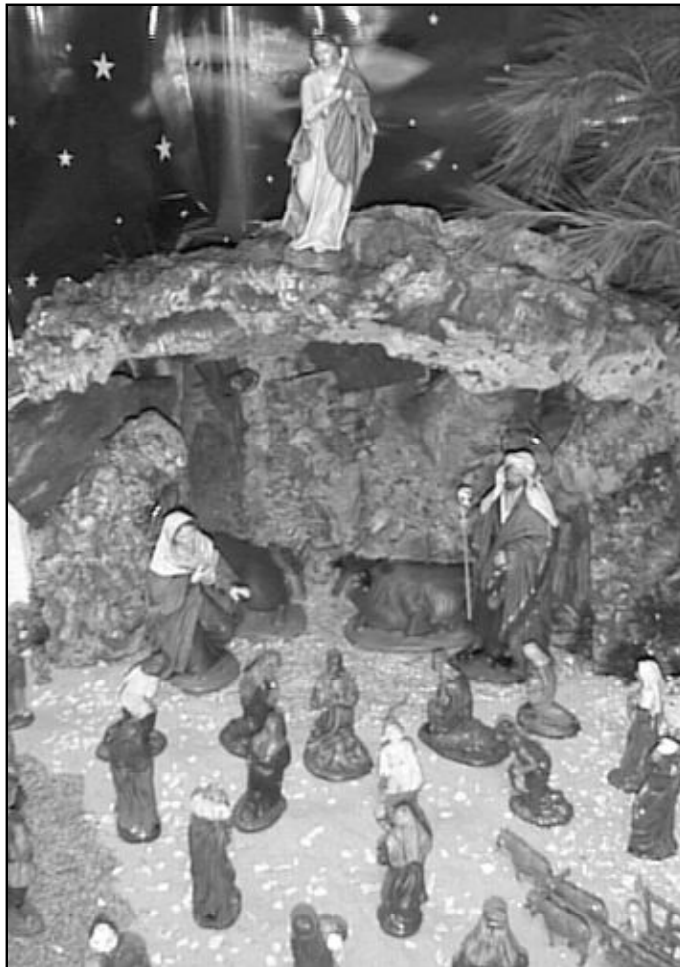
No hay que contraponer el belén al árbol de Navidad. Ambos son símbolos cristianos

El que nos ha sorprendido de nuevo ha sido Juan Pablo II que, en su mensaje de Navidad, al invitar a descubrir en los rasgos de todo niño palestino o