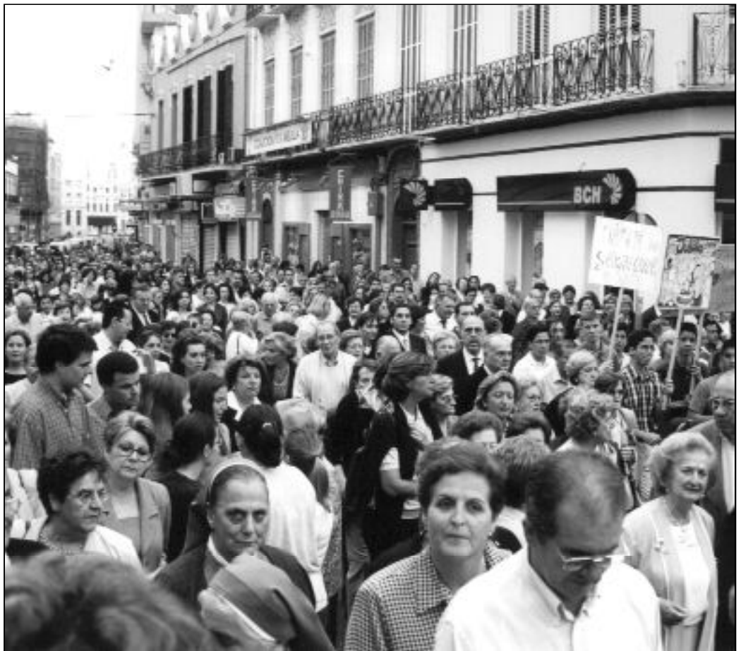
La comunidad cristiana melillense camina marcada por su servicio a los pobres

Por este motivo, la carta que, desde estas instancias, se ha escrito a los Magos de Oriente, más allá de pedir cosas mate-