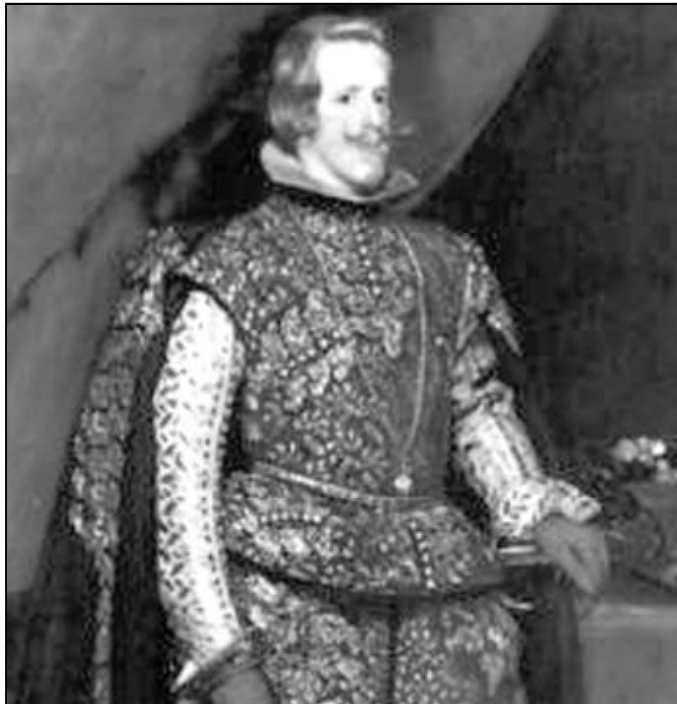
El obispo Mendoza organizó la acogida al monarca Felipe IV (en el retrato)

En el mes de marzo de 1624, intervino junto con el Corregi-