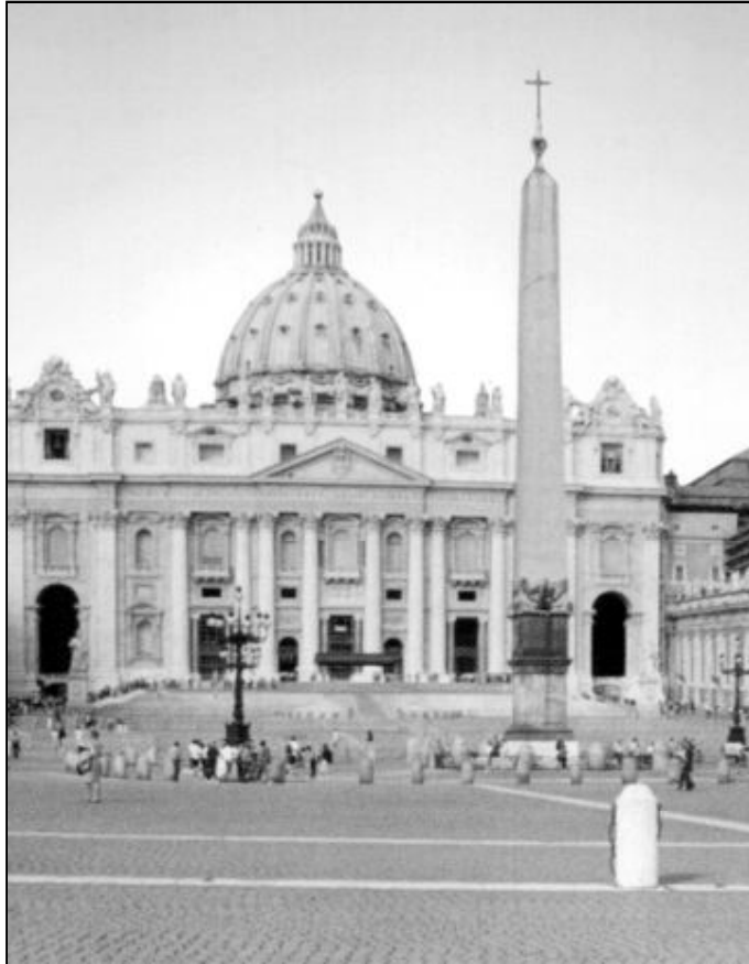
La plaza de San Pedro ha sido lugar de encuentro del Papa con millones de fieles

También coincidiendo con el comienzo del nuevo año la Prefectura de la Casa Pontificia ha informado de que el Papa se encontró directamente con más de dos millones y medio de fieles en diferentes acontecimientos públicos durante el año 2001. Según estos datos, 550.000 peregrinos se encontraron con el pontífice en las audiencias generales; 218.300, en audiencias especiales; 980.000, en las celebraciones litúrgicas; y 810.000, en el rezo del Angelus. El total exacto de fieles que pudieron ver personalmente al Santo Padre en ese año fue de 2.558.300 personas. Los datos no tienen en cuenta los encuentros con el