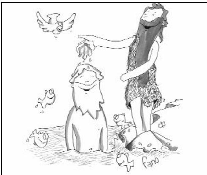
"Este es mi hijo, el amado"

del Espíritu". Jesús, con esa fuerza especial que "tiene y recibe", comienza lo que llamamos su "vida pública". A veces podemos confundir el ser con el hacer, y bien que nos avisa la carta "Novo millennio inenunte" y nuestro nuevo PPD. Seamos, para después actuar evangélicamente, desde un hacer lleno de Dios. Jesús nos muestra que su hacer, su actividad pública, la lleva a cabo con el Espíritu de Dios.