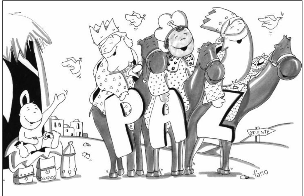
"Se marcharon a su tierra por otro camino"

Sus reflexiones sobre paz, justicia y perdón surgen de su propia experiencia de vida, ante los increíbles sufrimientos de los pueblos y de las personas. Entre ellas, no pocos amigos y conocidos suyos, víctimas de los totalitarismos nazi y comu-