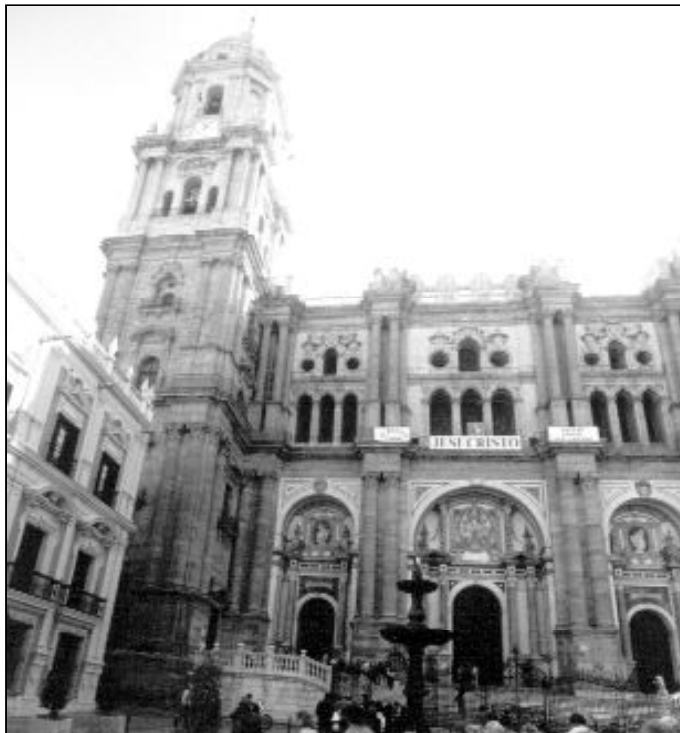
La S. I. Catedral acogerá el miércoles 23 una vigilia de oración por la paz