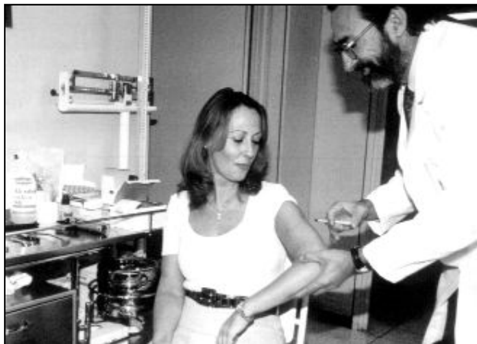
Campaña de vacunación contra la gripe

Estamos en pleno invierno y más tarde o más temprano la gripe está esperándonos. Intentamos tomar precauciones, pero cuando el virus entra en casa, en el colegio, o en el lugar de trabajo, rara vez se libra alguno. Los médicos recomiendan guardar cama, y coinciden en afirmar que esa es la mejor medicina para curarse y evitar complicaciones... ¡Pero lo cierto es que la gripe nos cambia la vida! En el periodo álgido, la fiebre no permite ninguna actividad; pero cuando el termómetro va bajando, hay unos días de permanencia en casa que