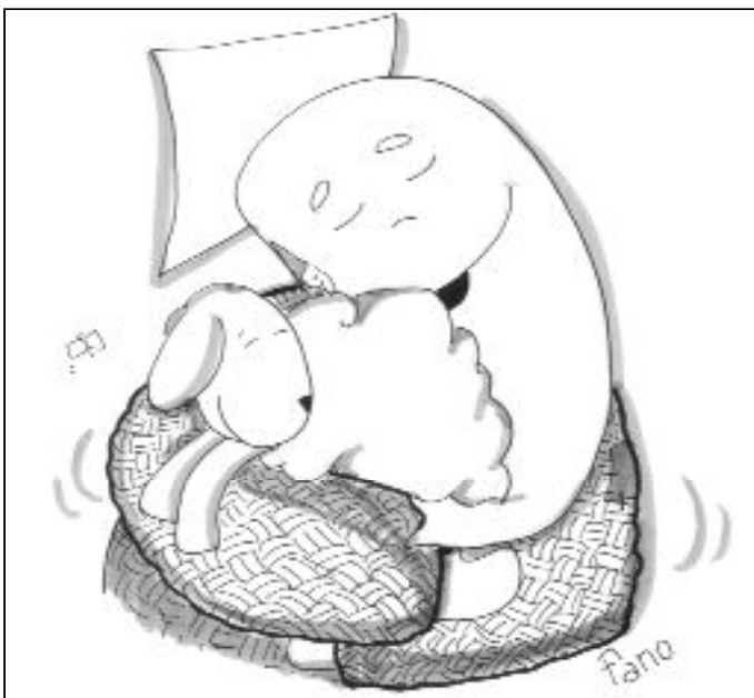
"Este es el cordero de Dios"

Juan fue un gran instrumento de Dios y a la vez pequeño, porque supo menguar a su debido tiempo. Sabía cuál era su