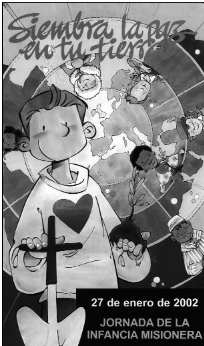
Cartel anunciador de la Jornada