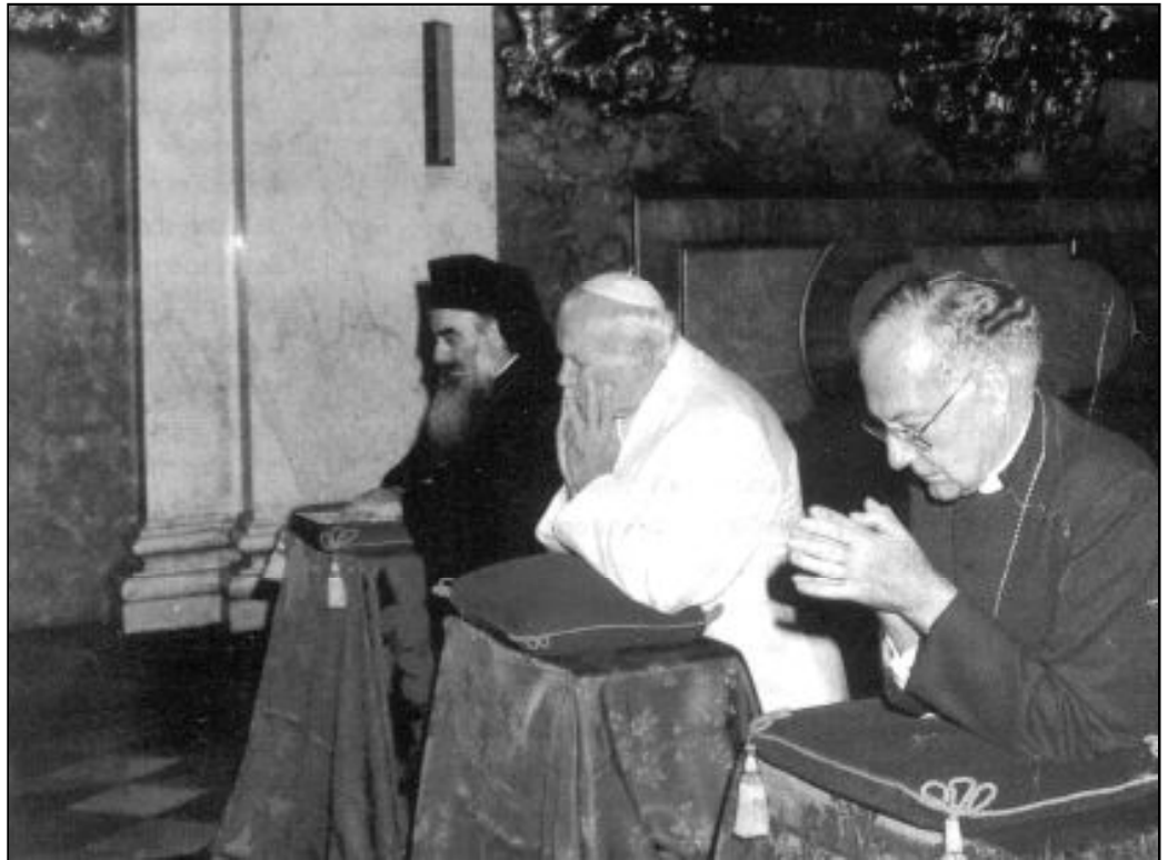
Los líderes ortodoxo y anglicano, junto al Papa, en el encuentro ecuménico celebrado en Asís en 1986

Desde entonces cobra cada vez más fuerza el Ecumenismo. El movimiento a favor de la unión de los cristianos no es sólo un mero apéndice añadido a la actividad tradicional de la Iglesia. Pertenece orgánicamente