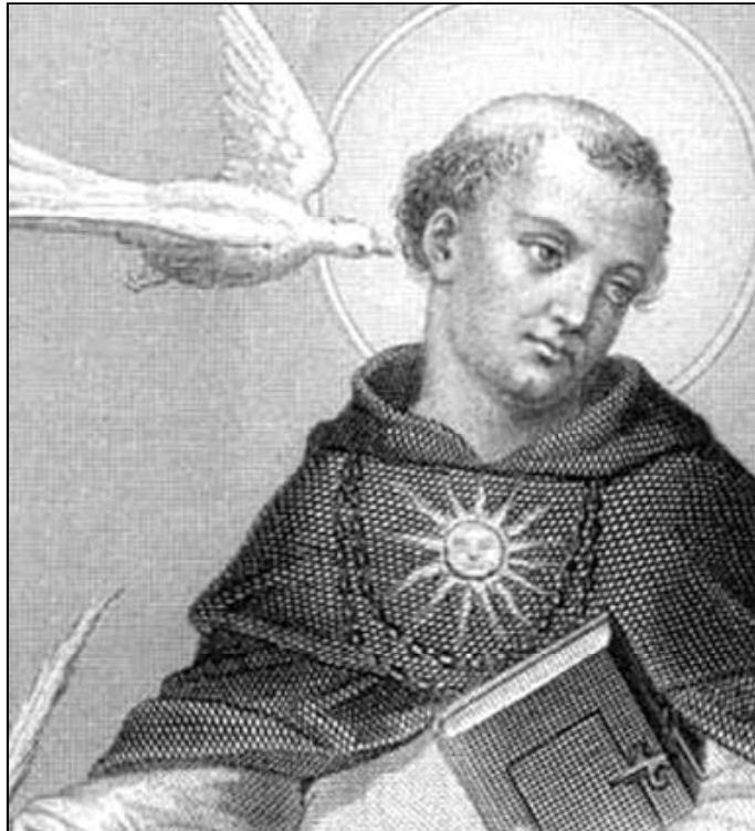
La obra de Sto. Tomás sigue siendo hoy un estímulo para la búsqueda de la verdad

Gracias a él y a otros frailes de la época se investigó y transmitió hasta nosotros la cultura en general y particularmente el pensamiento filosófico greco-romano, cuna de la cultura universal, sobre todo del Occidente.