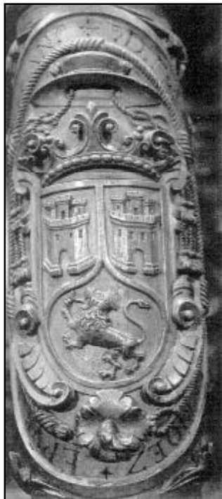
Escudos de armas de Fray Antonio Enríquez en la sillería del coro de la Catedral

Destacó por su competencia y talento, y su heroica caridad se dejó ver en repetidas ocasiones.