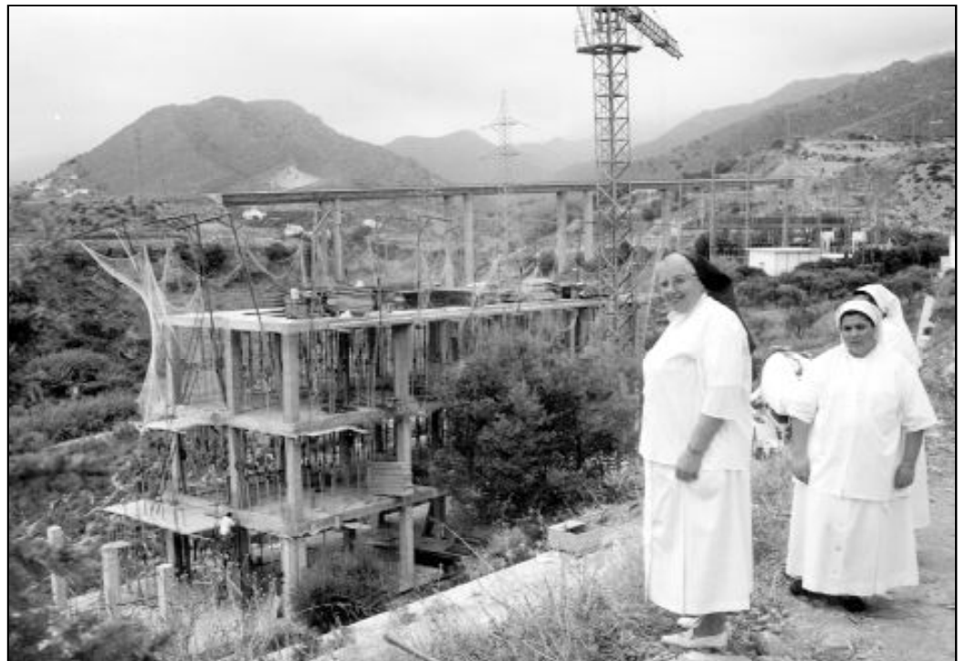
Hermanas del Buen Samaritano ante las obras de la nueva residencia de ancianos que pretenden poner en marcha en Nerja