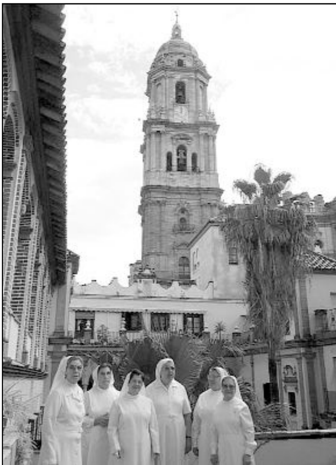
Comunidad de Mercedarias que atiende la Casa Sacerdotal

Por otra parte, están llevando adelante obras pioneras, que marcan las líneas que debe hacer suyas el gobierno, pues al fin es quien tiene la responsabilidad y el dinero de los ciudadanos. Por citar algún ejemplo: Proyecto Hombre, para personas enganchadas por la droga; la residencia Colichet, para enfermos de Sida que