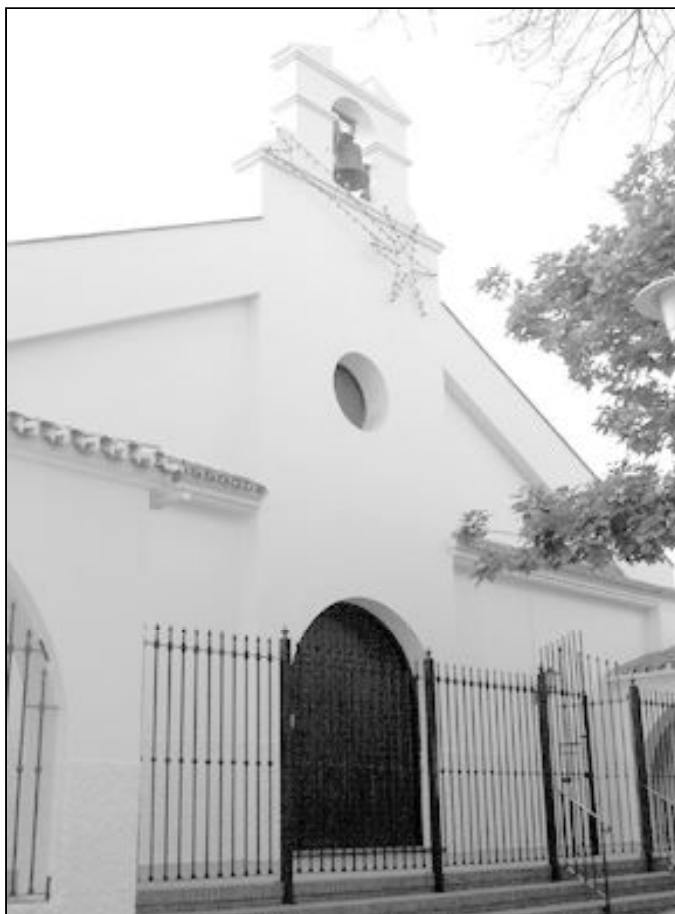
La parroquia de S. Miguel ha sido una de las principales colaboradoras del proyecto