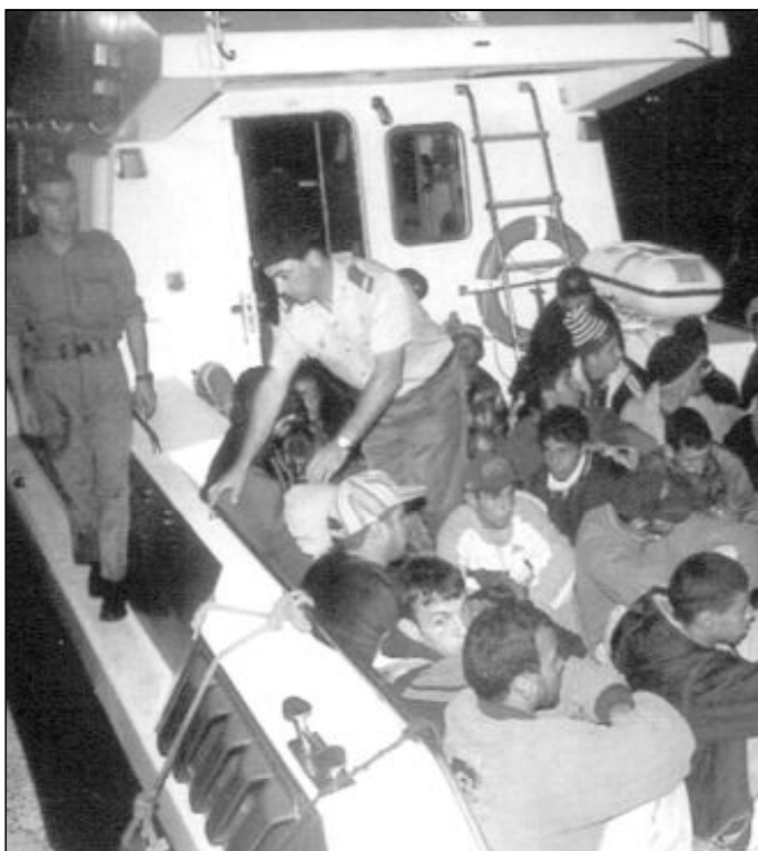
El Secretariado de Migraciones ha pedido más atención al problema de la inmigración

Concluyen su comunicado poniéndose a disposición de los distintos grupos, parroquias,