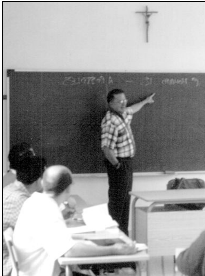
La formación de los seminaristas ha sido objeto de estudio en Roma

Y en Roma se encuentra reunida la Asamblea de la que dependen los seminarios, universidades eclesíásticas e instituciones educativas católicas. Están pensando y haciéndose preguntas. Entre otras, cómo debe ser la formación de los sacerdotes del futuro. Al hablar de la formación de los seminaristas, el cardenal prefecto de la Congregación, ha explicado que «los desafíos del mundo contem-