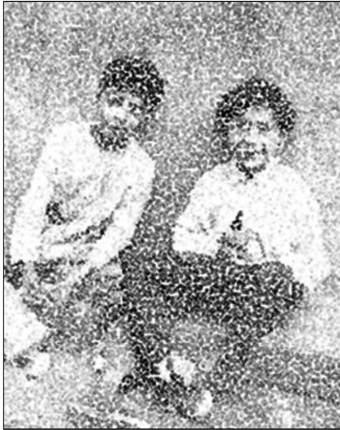
"El ayuno que quiere el Señor es que compartas tu pan con el hambriento"

Durante estos cuarenta días, la Iglesia recuerda, en su comienzo de la Cuaresma, las tentaciones de Jesús en el desierto, donde permaneció también cuarenta días. De ahí que a este tiempo litúrgico se le asigne el nombre de Cuaresma, dado que esta cifra tenía un valor muy significativo en los tiempos de Jesús. La liturgia se considera como una especial catequesis, (es decir enseñanza o anuncio del misterio cristiano), a la Comunidad de la Iglesia, procediendo así de lo visible de la liturgia a lo invisible; de lo signo, a lo significado; de la celebración como en la liturgia de los Sacramentos y sacramentales, a la realidad de la comunicación del Espíritu. Precisamente la liturgia cuaresmal comienza con el sacramental