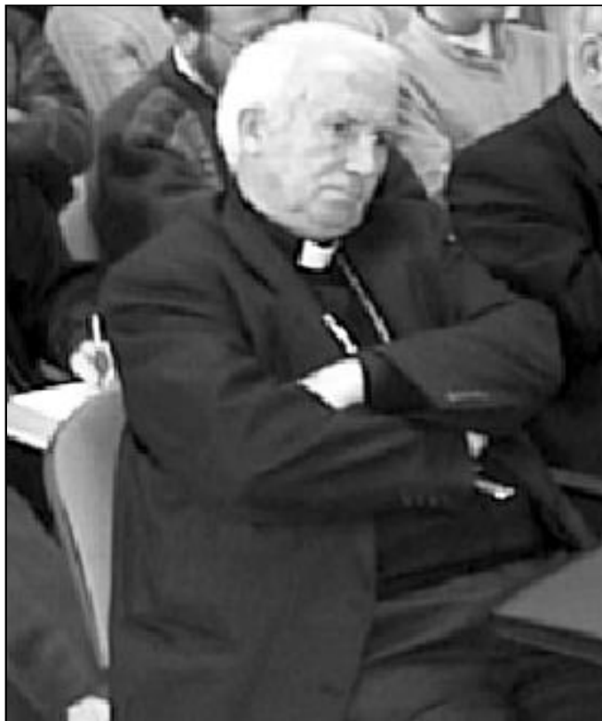
Mons. Cañizares, arzobispo de Granada, dará unas charlas los días 5, 6 y 7 de marzo

Chicos y chicas de todas estas localidades están invitados a la convivencia de los jóvenes del arciprestazgo, que se celebrará el sábado 16 de marzo en el colegio María Auxiliadora, de Marbella. Está previsto que acudan en torno a 200 jóvenes, que reflexionarán sobre el sentido de la Cuaresma y de la Semana Santa.