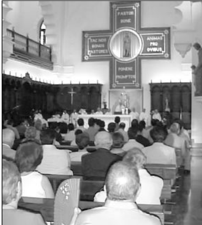
Eucaristía en la capilla del Seminario Diocesano

Según encuestas recientes, el 82,1 por ciento de los españoles se consideran católicos. Paradójicamente, de todo ese volumen, un 2,9 por ciento va a Misa todos los días y el 19 por ciento participa en la Eucaristía regularmente, según revela el último estudio del CIS. El 10,2 por ciento de los entrevistados se autocalificó de no creyente o agnóstico; y el 4,4 por ciento, de ateo. Los fieles de otras religiones son un 2 por ciento. Sobre la opi-