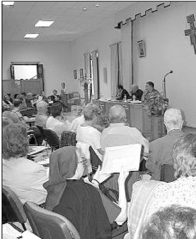
Todos los miembros de la diócesis somos responsables del CPD

Este sábado se reúne el Consejo con la misión de revi-