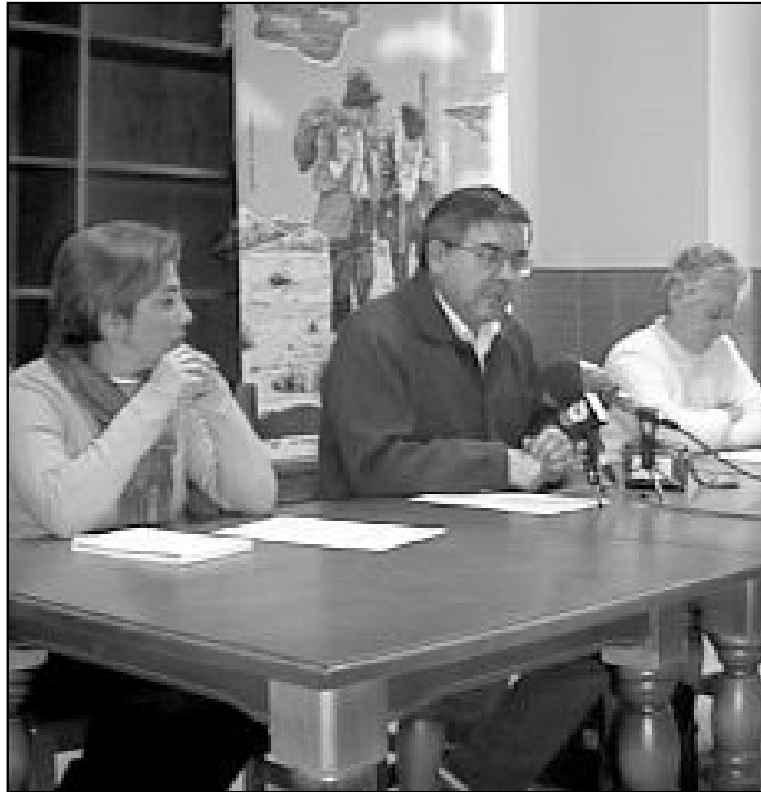
Rueda de prensa en las instalaciones del Hogar "Pozo Dulce"

Del grado de cumplimiento de los objetivos que se marcan para la Casa, da cuenta el hecho de que