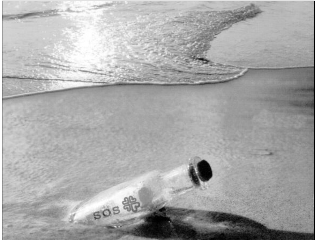
La Iglesia argentina ha solicitado ayuda a la Conferencia Episcopal Española desde el otro lado del charco

Por su parte, Cáritas Argentina se ha movilizado para contribuir a superar esta tremenda crisis. No sólo sigue comprometida en la erradicación de la injusticia y de la profunda crisis moral que ha sumido al país en la miseria, sino que está intentando paliar la situación de necesidad extrema de tantos hermanos: atiende a más de 2.000.000 de personas, de las que unas 500.000 se han acerca-