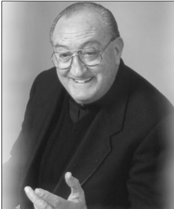
D. Juan E. Vecchi falleció recientemente en Roma

El Santo Fundador Juan Bosco comenzó por la creación de lo que entonces se llamaba oratorios de comunicación para los jóvenes, con un aire festivo y alegre. Eran centros juveniles para la enseñanza en general y la instrucción