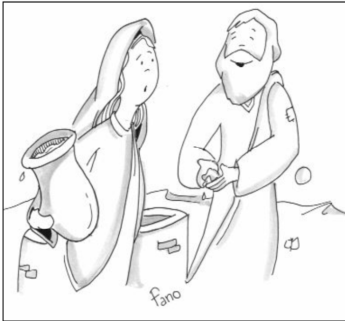
“El que vuelva a beber del agua que yo le daré nunca más volverá a tener sed”

Siempre ocurre así: cuando uno entra en diálogo con el Señor descubre su verdadera sed. Y no