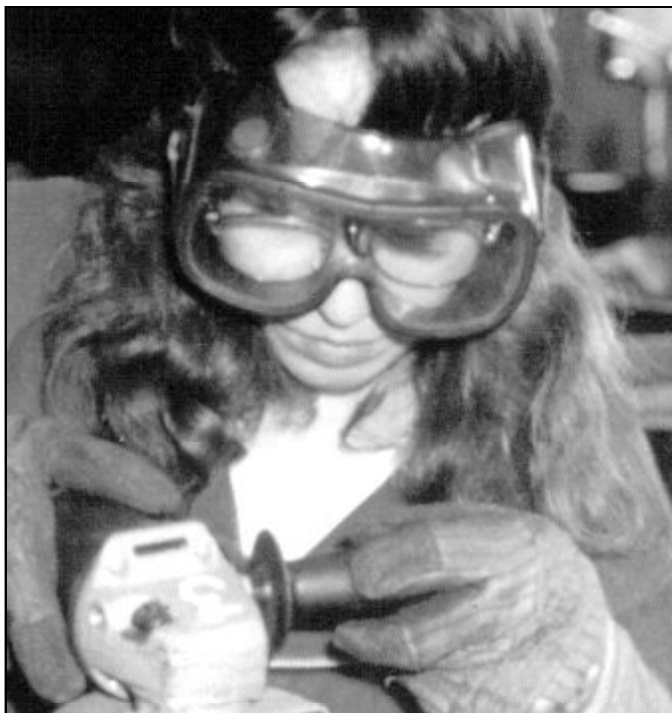
Mujer trabajando en la metalurgia

Creo que Dios está ahí, en el interior de la vida, en el corazón de mi trabajo, aunque a veces esta vida parezca que no tiene historia. Dios se hace presente en el sin sentido de la existencia y se manifiesta en las relaciones y la fraternidad. Creyendo esto, puedo permanecer ahí... seguir viviendo en esta realidad (y el mundo laboral es una realidad bien dura) me atrevo a decir que puedo, de puntillas, pero puedo, hablar de la realidad de Dios que Él me ha querido revelar... A veces he teni-