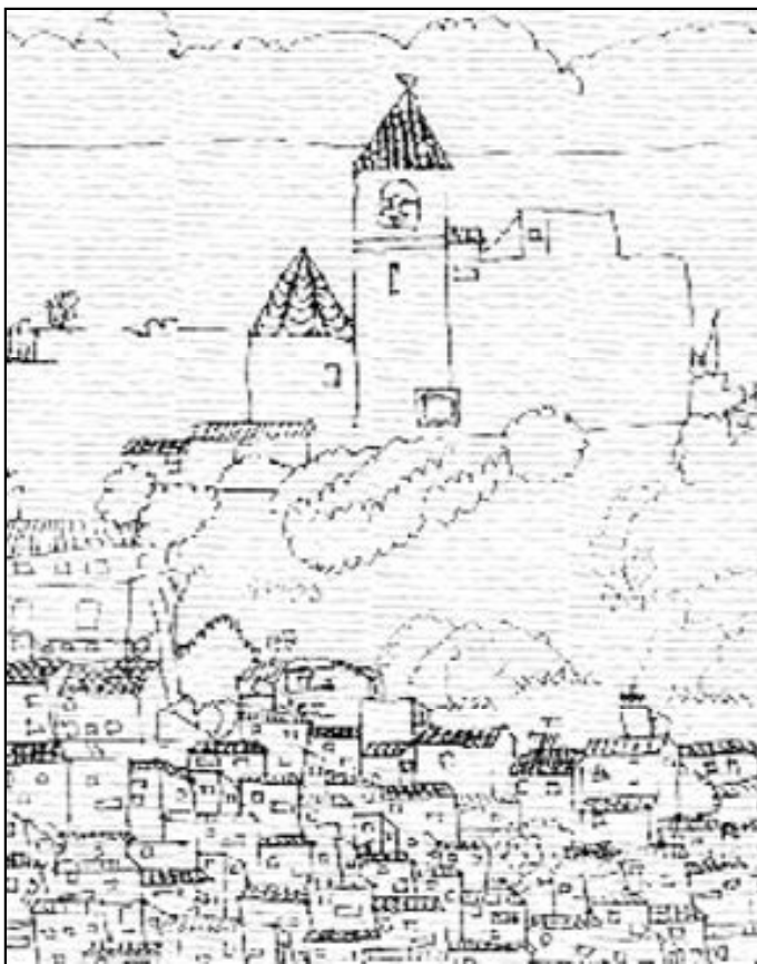
Cáritas busca que los protagonistas sean los propios miembros de la sociedad

Son múltiples los problemas que afectan a nuestros pueblos, y en este contexto hay algunos colectivos que sufren con mayor