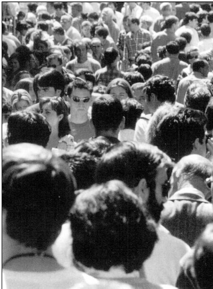
En virtud del bautismo somos constituidos Pueblo de Dios

La llamada al apostolado laical adquiere, en nuestros días y a