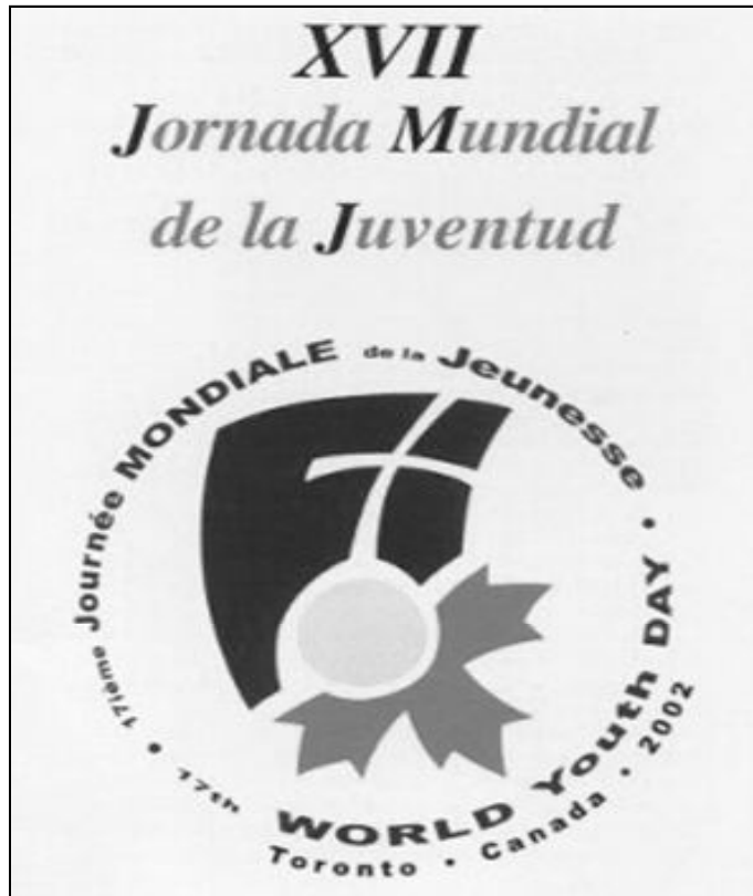
Logotipo de la Jornada Mundial de la Juventud

Sin dejar de prestar atención a Juan Pablo II, hay que señalar que se dirigió a los miembros del