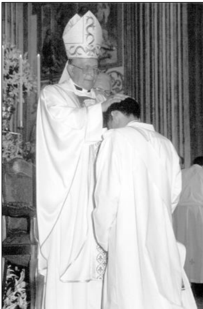
Por la ordenación, el sacerdote es transformado en su ser como ministro del Señor

Los Obispos, sucesores de los Apóstoles, encomiendan la función de su ministerio pastoral a varios miembros de la Iglesia para el servicio a la misma. Dicho ministerio o servicio a la Iglesia es ejercitado en diversos órdenes por aquellos que, ya desde el comienzo de las primeras comunidades cristianas son llamados Episcopos, Presbíteros y Diáconos. Éstos, unidos al Obispo por la imposición de manos en el Sacramento del Orden, y en unión con el Obispo y la Iglesia Universal, forman en la Comunidad Particular lo que se llama el Presbiterio. Esto no impide que todos los cristianos que forman el Cuerpo Místico de Cristo o Iglesia, participen en el