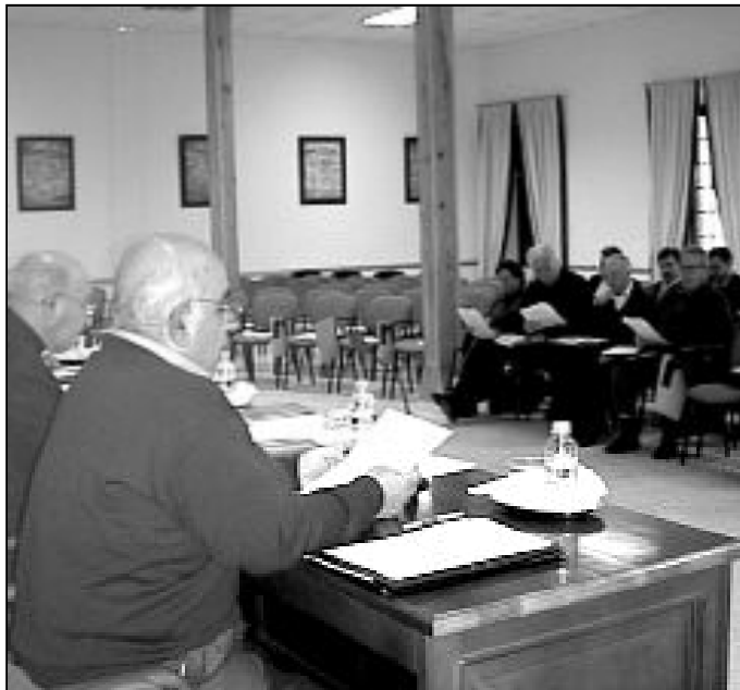
Sobre estas líneas, presentación de la ponencia; debajo, trabajo por grupos