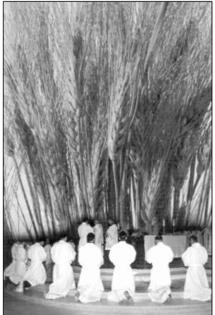
Cartel de la Campaña del Día del Seminario 2002