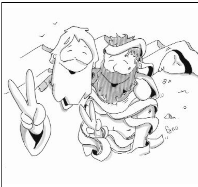
"Yo soy la resurrección y la vida"

¿Crees esto?, se nos pregunta también a nosotros. ¿Crees que Cristo te puede dar la verdadera vida? ¿Crees? La fe es la condición previa, porque si crees en Él, aunque te sientas aprisionado por el pecado, lo superarás; si crees en Él, aunque te sientas atrapado por la superficialidad, encontrarás la profundidad de tu vida; si creemos en Él, aunque sepamos que nos espera la muerte, vivire-