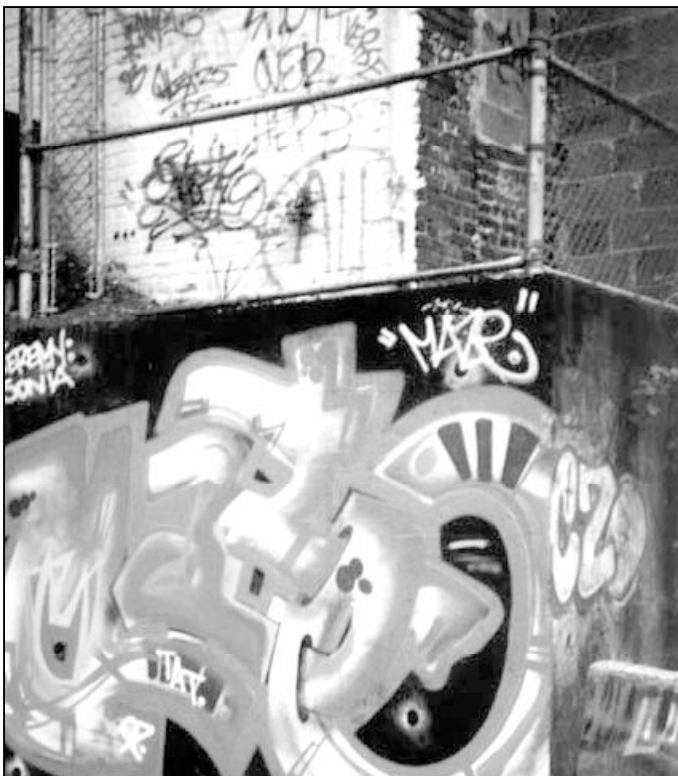
Típica calle del barrio neoyorquino del Bronx