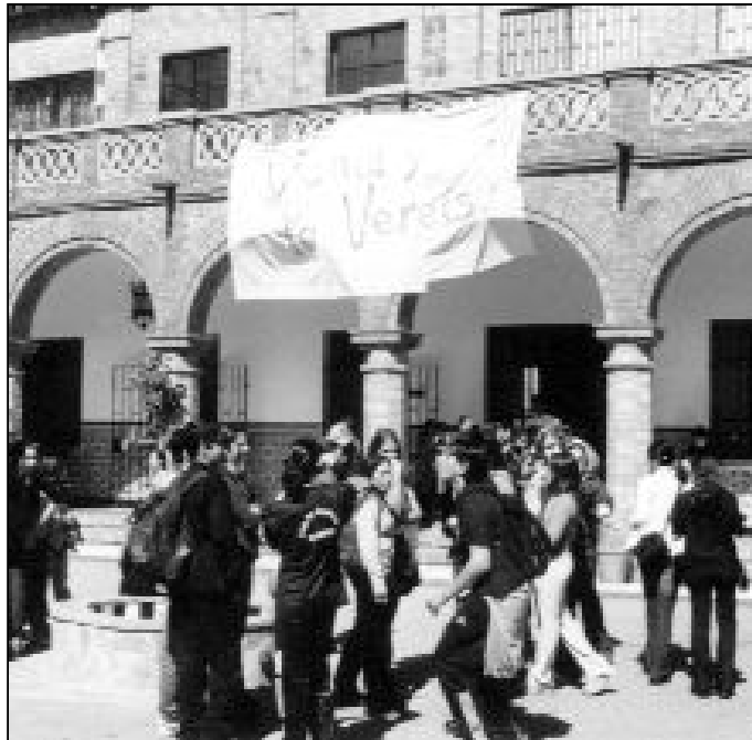
Jóvenes participantes en la experiencia “Venid y lo veréis”

–Surgió una relación de amistad, donde hablábamos de la vocación. No fue un cambio de vida radical, sino plantearme si mi vocación sería ser sacerdote. “¿Por qué no yo cura?”. La respuesta la fui encontrando poco a poco.