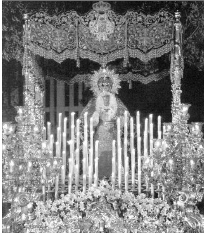
Las procesiones son una manera de expresión de la fe

Este acontecimiento es una forma de religiosidad tradicional. Término este preferible al de "religiosidad popular", que conlleva casi siempre un matiz de juicio de valor no siempre positivo. En cambio, el término