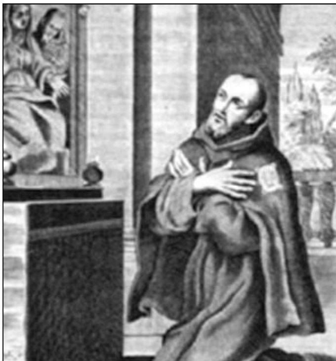
Pedro de San José de Betancur será beatificado por el Santo Padre

De Ecuador viajamos a Guatemala, porque Juan Pablo II visitará este país para canonizar a Pedro de San José de Betancur, fundador de los Hermanos y Hermanas Betlemitas. Pedro De Betancur será «el primer santo centroamericano». «Gracias al hermano Pedro, afirman los obispos, es posible decir que después de un centenar de años de fe cristiana ya había frutos