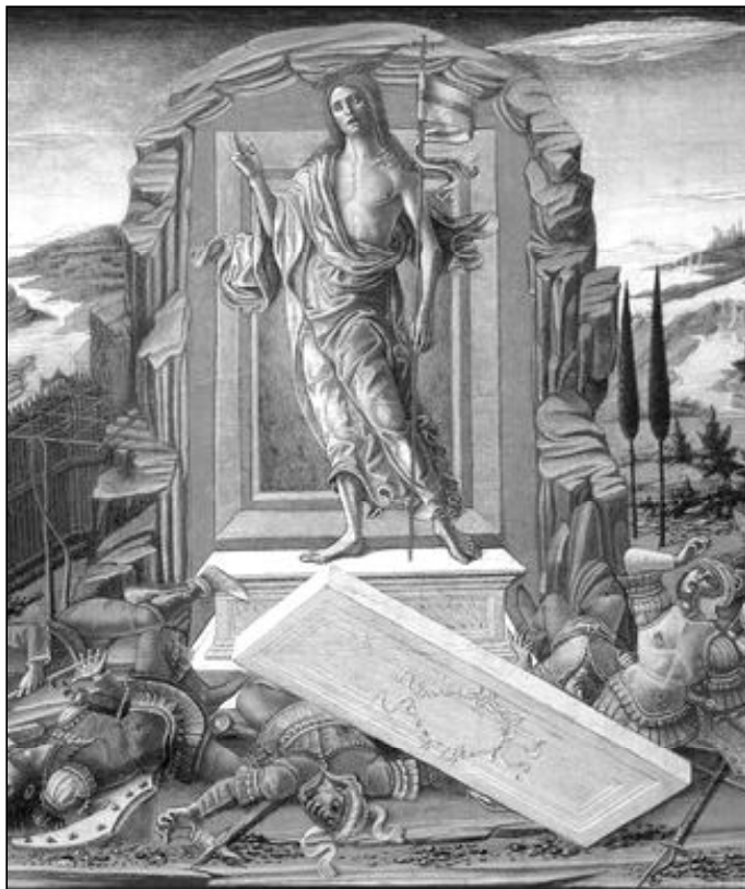
Resurrección del Señor. Benvenuto di Giovanni

De la Resurrección de Jesús se derivan grandes consecuencias para nosotros. Como el hecho de la creación de una nueva huma-