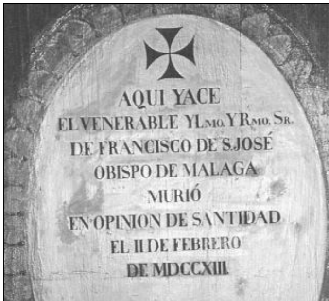
Detalle de la lápida tras la que reposan los restos de Fray Francisco de San José

Enemigo de agasajos humanos, aceptó dedicarse a la predicación. Durante un largo período de treinta años, realizó esta hermosa tarea de predicar la