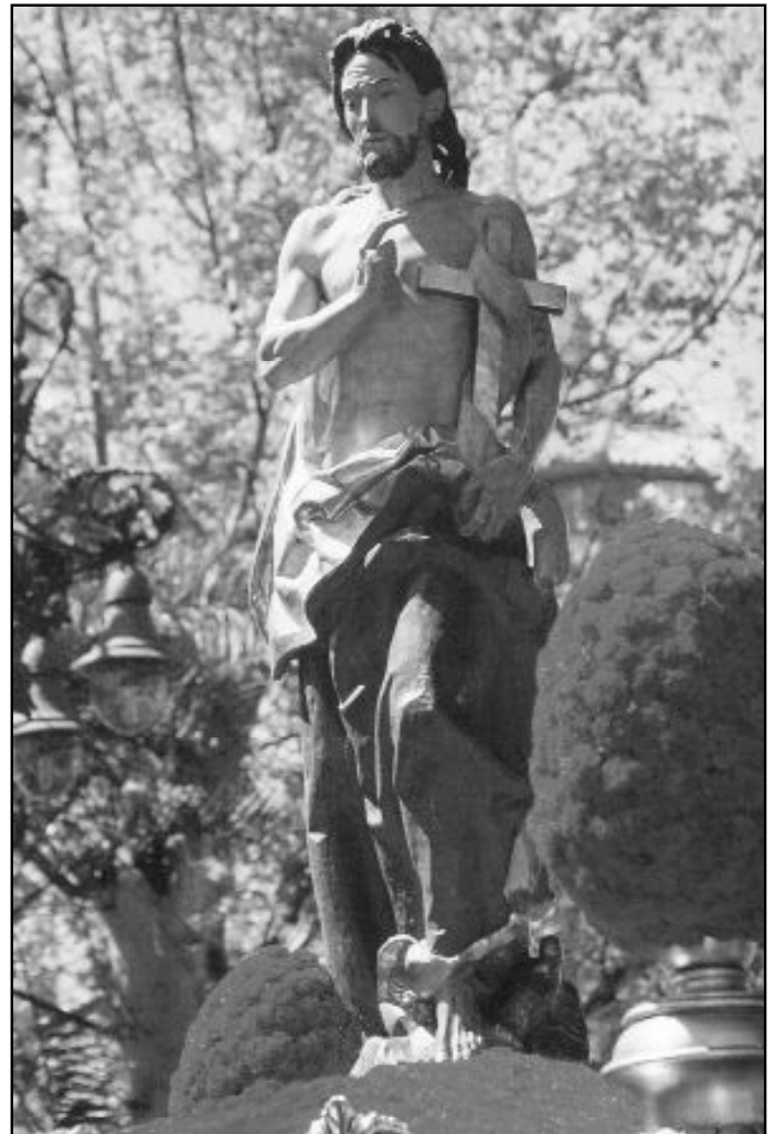
Stmo. Cristo Resucitado