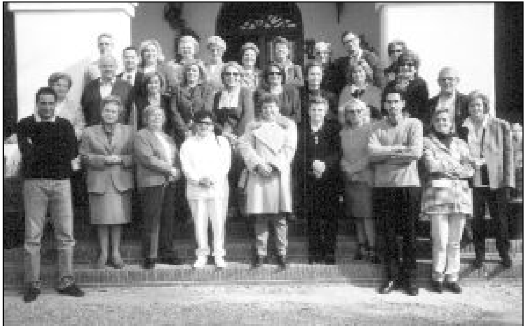
Miembros del Movimiento de Cursillos de Cristiandad

“Cuando participé en los cursillos, me encontré con una Iglesia que