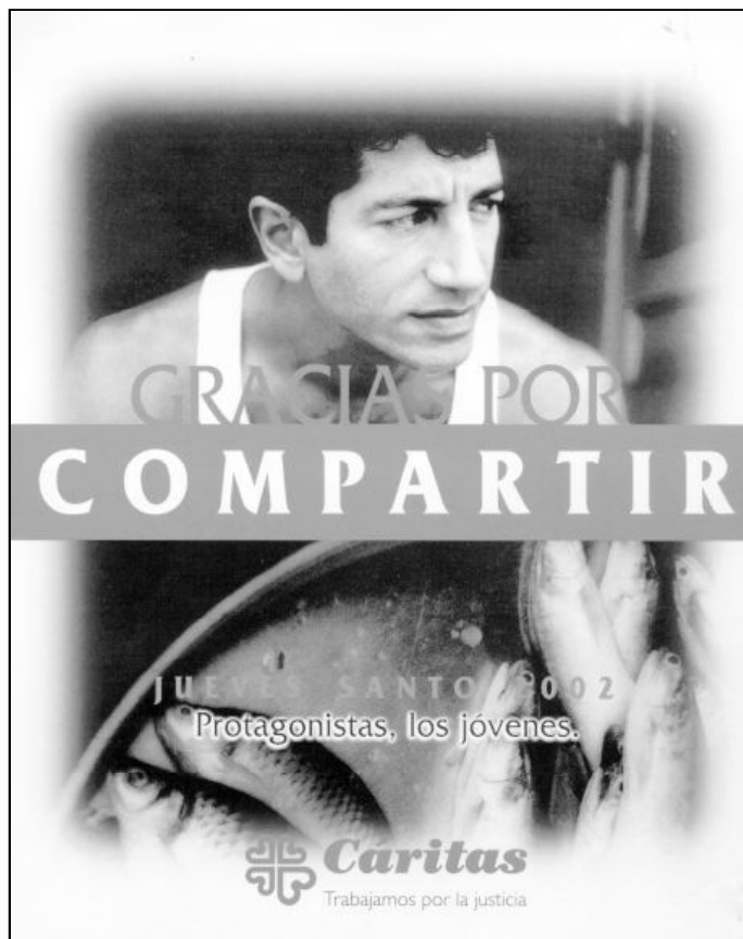
Cartel de la Campaña del Jueves Santo 2002

Detrás de estos fríos datos estadísticos, están las personas, las víctimas del desorden económico mundial. Por eso, a nadie puede sorprender el fenómeno