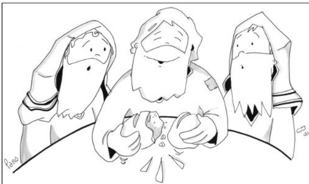
“Lo reconocieron al partir el pan”