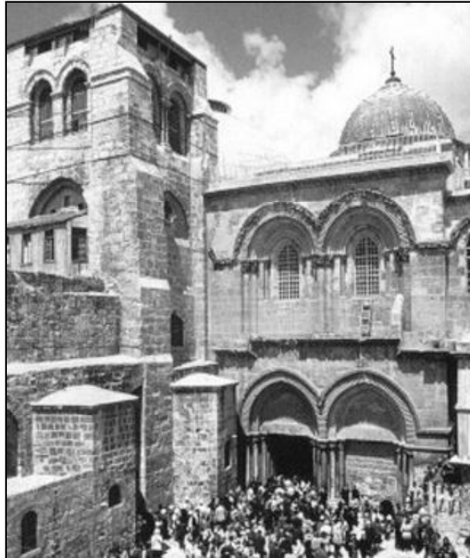
Basilica del Santo Sepulcro, un "lugar fundamental para la geografía de la fe"