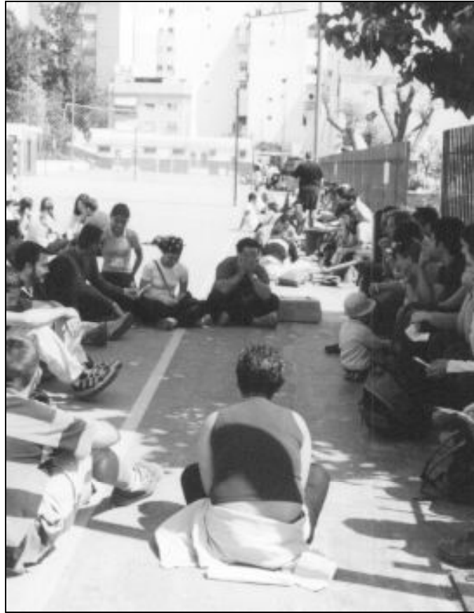
Los jóvenes se reunirán el domingo por la mañana en grupos de reflexión

Sobre las 11 de la mañana, comenzarán los grupos de reflexión. Los jóvenes se dividirán en pequeños grupos, según la edad: de 16 a 17 años, de 18 a 20, y los mayores de 21 años. Se tiene