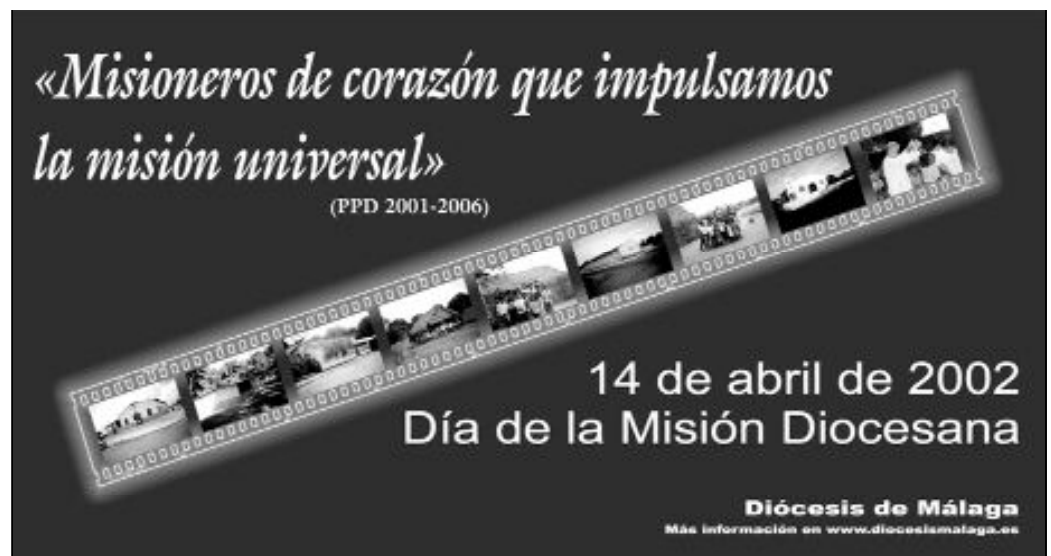
Cartel editado con motivo de la Campaña del Día de la Misión Diocesana

defensorías de tierras, derecho de los niños, indígenas, etc.