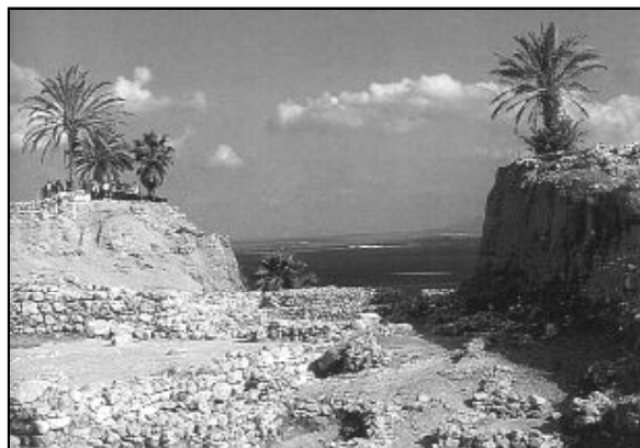
Paisaje de Tierra Santa. Al fondo, el mar de Galilea

El paisaje, en muchos aspectos, se parece al nuestro. En él encontramos las zonas verdes de Galilea, que se contraponen a las desérticas de Judea; pero el paisaje tampoco es lo más característico. Entonces, ¿qué es lo especial de Tierra Santa? Ya han pasado veinte siglos desde que Jesús allí naciera y el terreno ha ido modificándose por los agentes externos; pero pese a los cambios geográficos, la huella de Dios permanece; es indeleble pues ningún cambio la puede borrar, y por eso Tierra Santa capta al que hacia ella peregrina de una