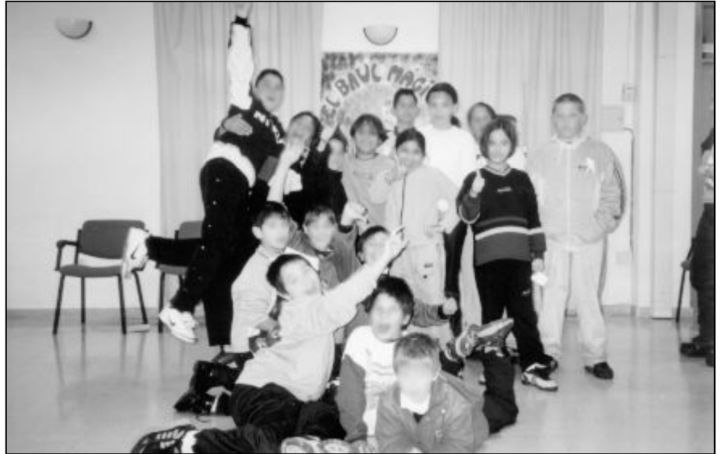
Chicos participantes en las actividades de “El Baúl Mágico”, de la parroquia de San Pío X

En coordinación con los directores de los colegios a los que acuden, se conocen las materias en las que conviene incidir, sobre