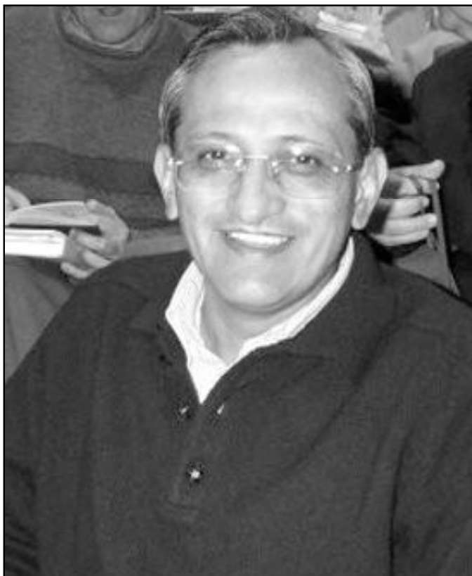
Pascual Chávez Villanueva, nuevo rector mayor de los salesianos

Por cierto, ha sido el religioso mexicano de 54 años, Pascual Chávez Villanueva, el elegido como nuevo rector mayor de los salesianos durante la celebración del XXV Capítulo General de la Sociedad de San Francisco de Sales, que comenzó en Roma a finales de febrero pasado. Elegido en la primera votación por una amplia mayoría, Chávez sustituirá durante los próximos seis