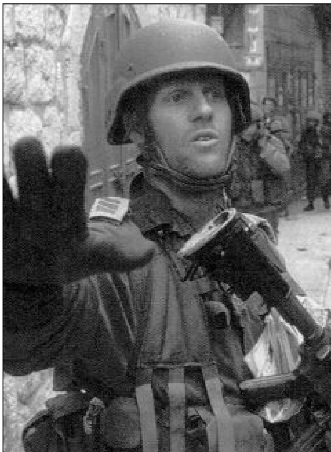
Un soldado israelí impide el paso a los periodistas occidentales

Habló enérgicamente y pidió la plegaria de todos, en la Iglesia de Sta. Catalina, próxima al lugar de la Cueva de Belén, gruta de la Natividad de Jesús. Con la fuerza moral que representa su persona, así como su experiencia en la pastoral inte-