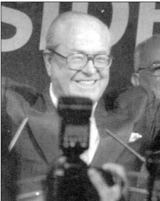
Jean-Marie Le Pen ha sido criticado por usar palabras del Papa en sus discursos

Precisamente, hace unos días Juan Pablo II ordenó a veinte sacerdotes. Les recordó que su vocación es la santidad. Jesús, dijo el Papa en la homilía, «os llama para que estéis con él en una intimidad privile-