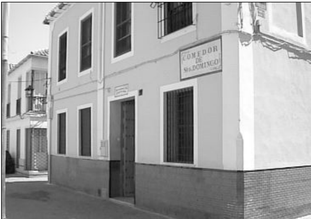
Fachada del comedor de Santo Domingo en calle Pulideros

El comedor tiene contratadas un total de 11 personas: 9 en el comedor y 2 en el Centro de Día. Además se cuenta con la colaboración de 80 voluntarios, siendo su trabajo fundamental para conseguir los distintos objetivos.