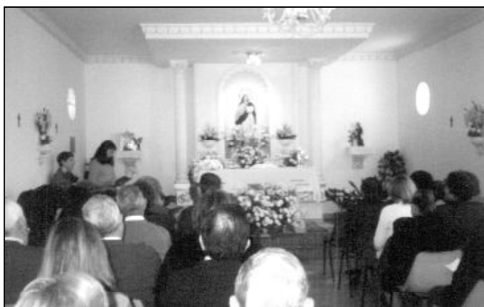
Capilla de la barriada El Albaicín

..... Iniciada la segunda visita Pastoral por los pueblos de la Diócesis, hallándose en Vélez, tuvo noticias de que, a propuesta del monarca, el Papa le había promovido al obispado de Cuenca. Lamentó mucho este cambio y presentó su renuncia, que no le fue admitida, y tuvo que acceder al deseo de Su Santidad.