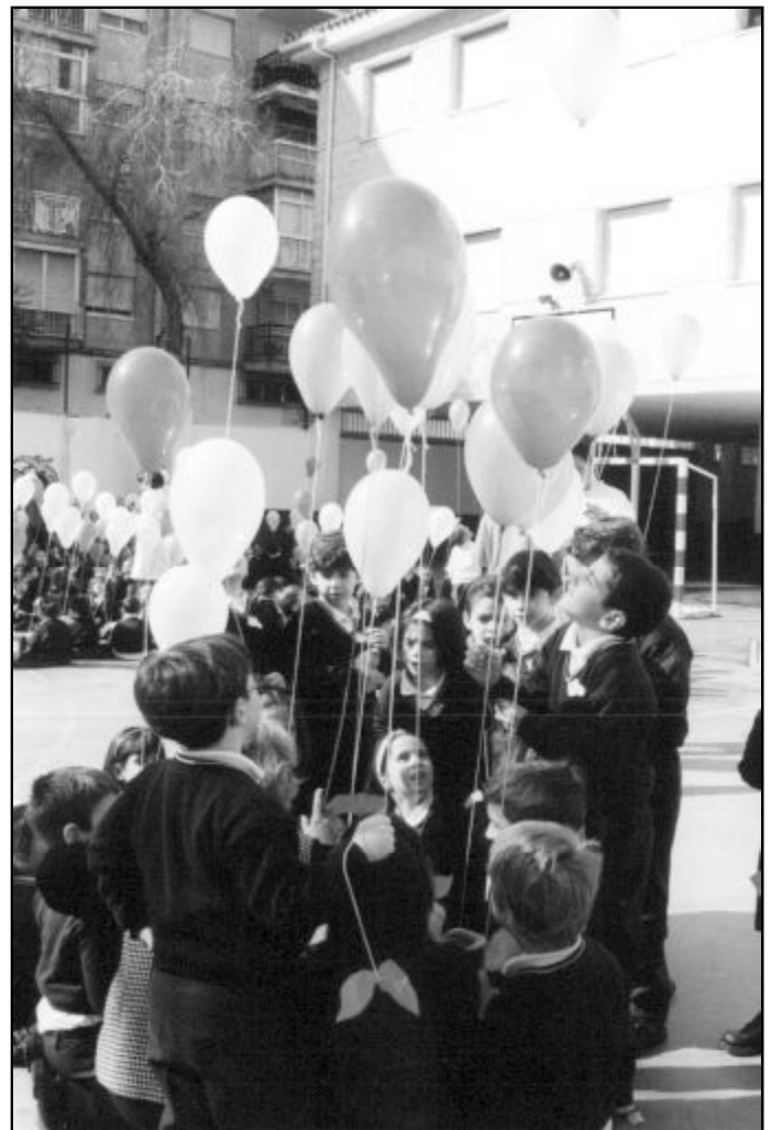
La Fundación de Enseñanza celebra su 50 cumpleaños