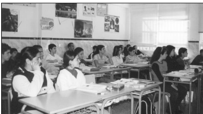
En la foto de arriba, encuentro del Sr. Obispo con responsables y alumnos de la Fundación Diocesana de Enseñanza; abajo, una de las aulas de un centro

Fundación, ya que Del 20 al 26 de mayo se ofrecerá a toda la ciudad una Muestra Conmemorativa en el Archivo Municipal de la ciudad, donde se expondrá, fundamentalmente a través de imágenes, la vida de los primeros patronatos de enseñanza –el Patronato Mixto de Educación Primaria, el Patronato de Escuelas Rurales y el Patronato de Santa Rosa de Lima– y lo que ha sido la Fundación, aglutinadora de estos Patronatos desde el año 1992. Son muchas las realidades de esta Institución, y con esta Muestra se pretende dar a