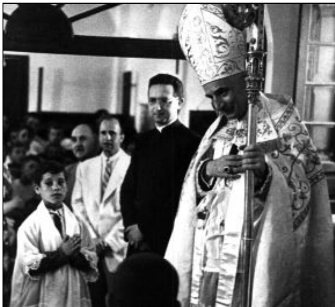
El año 1951, el Cardenal Ángel Herrera Oria bendijo una de las Escuelas-capilla, en la Granja de Suárez