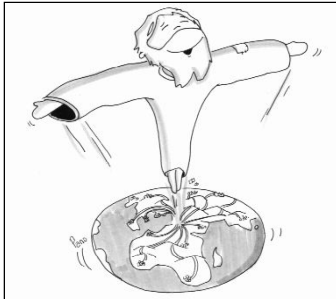
"Id y haced discípulos a todos los pueblos"

La Iglesia es misión. Celebramos la Eucaristía y los sacramentos para cobrar bríos en el desempeño de la misión que se nos ha confiado: hacer discípulos de Jesús. No discípulos nuestros, sino del que nos envía. Por eso, la primera tarea es la evangelización. En este sentido, la palabra sigue siendo vehículo de excepción, pues, como dirá San Pablo, la fe entra por el oído. Pero