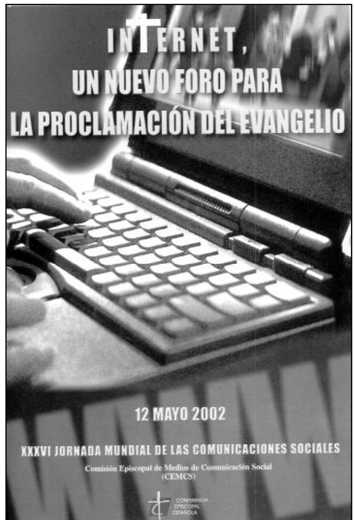
Cartel de la XXXVI Jornada Mundial de las Comunicaciones Sociales