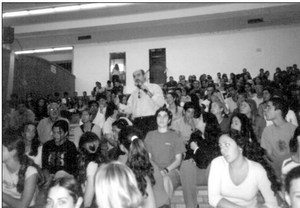
Pastoral Penitenciaria organiza visitas a la prisión para prevenir a los jóvenes sobre los caminos que llevan a la cárcel