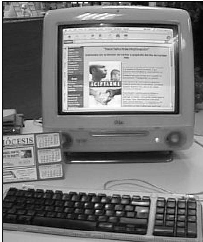
El Vaticano ha pedido que Internet tenga un rostro más humano

Y desde Honduras a Corea. Con el Mundial de fútbol de Corea-Japón, comenzó también una campaña de sensibilización