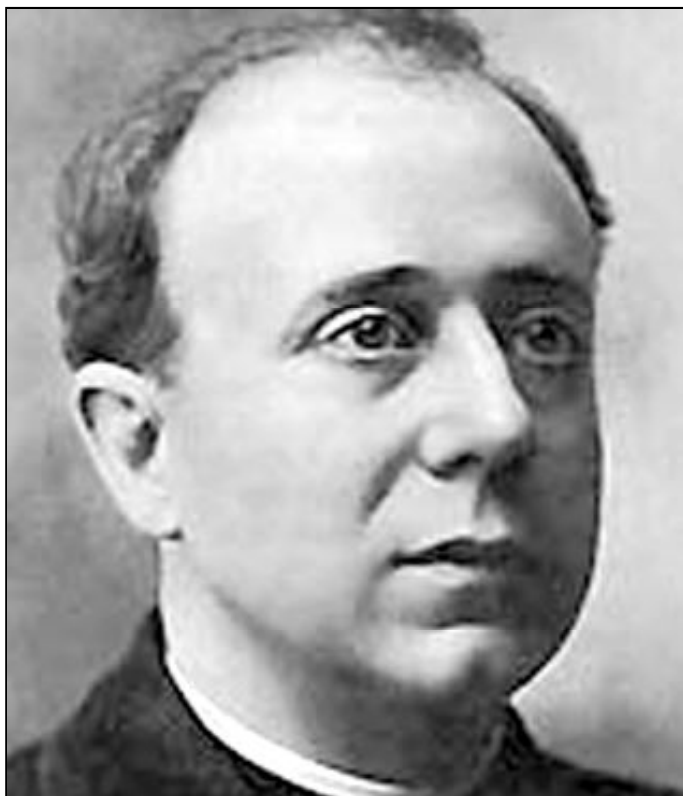
Imagen del Beato Pedro Poveda

Pedro Poveda experimentó dificultades de todo tipo e inclu-