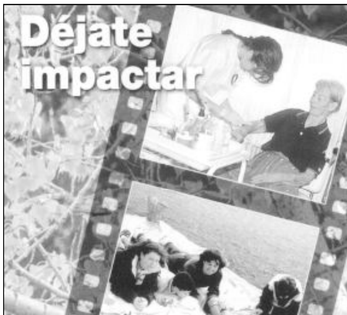
Detalle del tríptico informativo de los Campos de Trabajo de las Hospitallerías