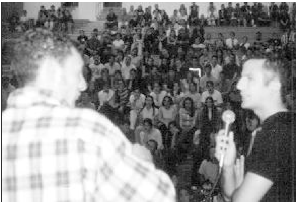
Un voluntario traduce a un preso sordomudo que imparte una charla de prevención a los alumnos de un instituto