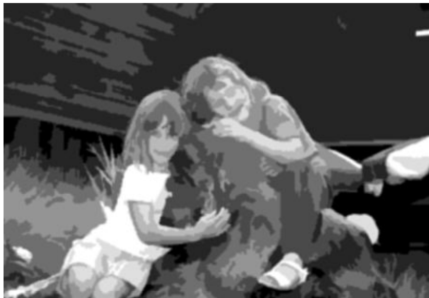
En vacaciones hay que saborear cada minuto de la infancia de los hijos

razón, puesto que la permisividad es una forma de desentenderse de la educación de los hijos. La formación de la personalidad requiere unas normas de actuación y unas pautas de conducta vividas en un ambiente cálido, sereno y acogedor. Todo ello cons-