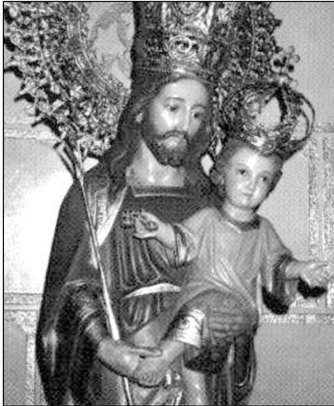
Imagen de San José en el Santuario de San José de la Montaña en Barcelona