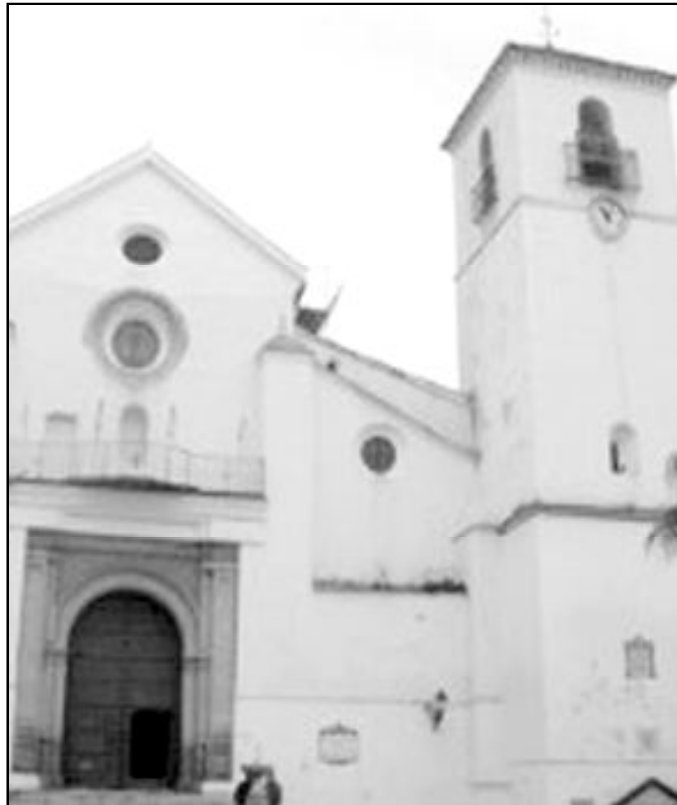
Parroquia de San Juan y San Andrés de Coín

La estructura de los gastos se puede dividir, un año más, en tres partes iguales. Un tercio de los gastos se ha destinado a la