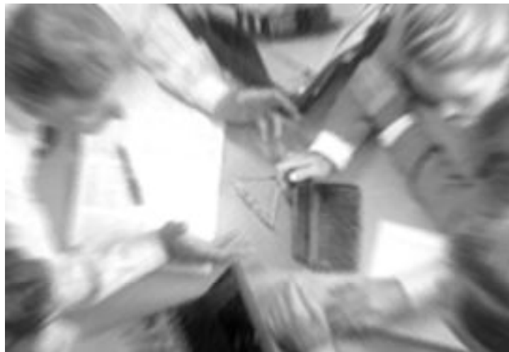
No podemos caer en la tentación de entrar en un ajeteo incesante

Y es que cuando hay que ultimar tantos detalles, puede suceder que los árboles no nos dejen ver el bosque; es decir, que fijando la atención en miles de cosas pequeñas perdamos de vista lo importante. Y lo importante es ser conscientes de lo que Dios nos da cada día: empezando por el regalo de la vida junto a los seres queridos y continuando con toda una serie de cosas, que porque son cotidianas y las disfrutamos siempre, hay momentos en que no las apreciamos. Por eso no podemos caer en la tenta-