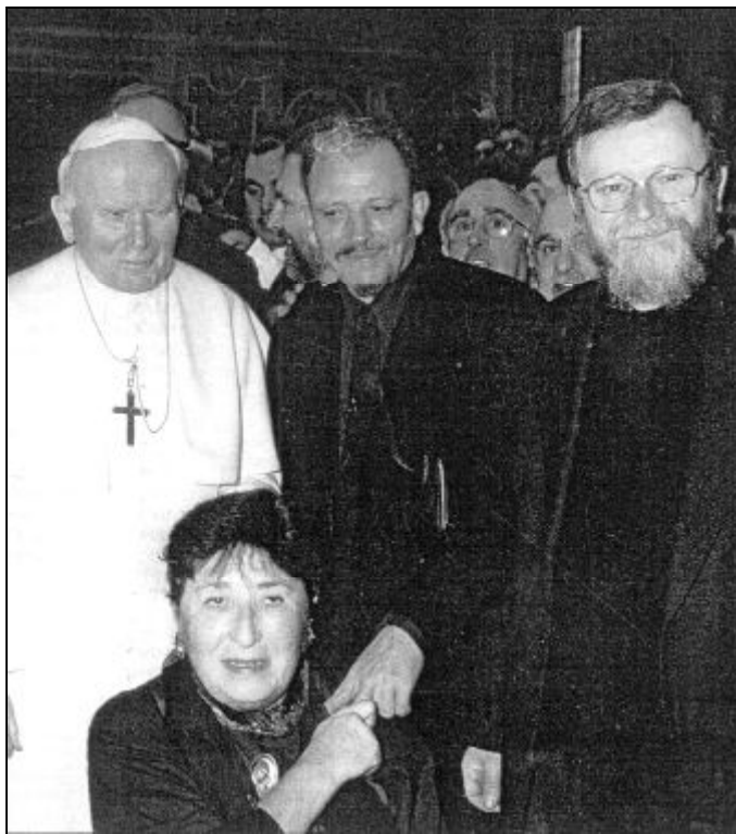
El Santo Padre junto a los fundadores del Camino Neocatecumenal

El Camino Neocatecumenal no ha sido aprobado como una asociación, un movimiento o una congregación religiosa, sino, respetando y confirmando la intención de sus iniciadores, como un itinerario de iniciación cristiana para el redescubrimiento del Bautismo, es decir un catecumenado post-bautismal (Cf. Estatuto,