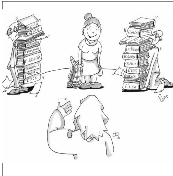
"...se lo has revelado a la gente sencilla"

En claro contraste con ese reproche, se alza la explosión de júbilo del Maestro: ¡Te doy gracias, Padre, porque has revelado estas cosas a la gente sencilla! Los sencillos, no los sabios y entendidos, han acogido la revelación y Jesús se goza con ello, y nos invita a gozarnos también a nosotros.