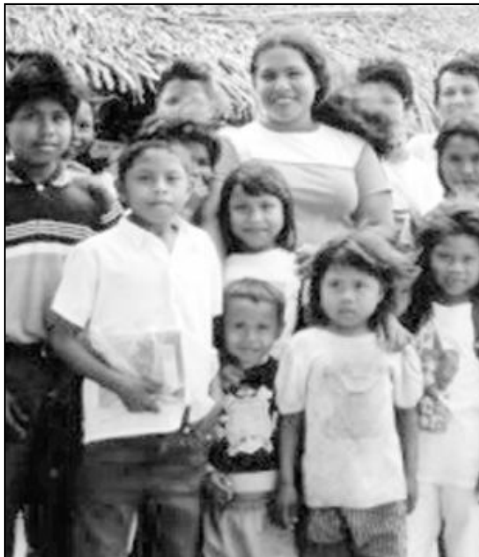
Niños de uno de los pueblos venezolanos atendidos por misioneros malagueños

Caicara es la Provincia o Región en la que residirán, para realizar su tarea pastoral, los sacerdotes malagueños. Dicha Provincia tiene una extensión de cuarenta y cuatro mil kilómetros cuadrados y su población cuenta con ciento veinticinco mil habitantes. Paisaje