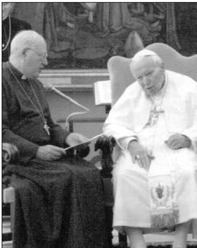
Encuentro entre el Papa y el arzobispo Anglicano Jorge Carey

Recordaron otros encuentros, y el Arzobispo manifestó a S.S. Juan Pablo II la gran estima que le profesa "como hermano en la fe, así como debido a su figura de líder espiritual". Interesa destacar el ejemplar interés de ambas personalidades religiosas en proseguir el camino iniciado hacia la unidad más profunda. Pues la Iglesia Católica y la Comunión Anglicana están en realidad muy cerca.