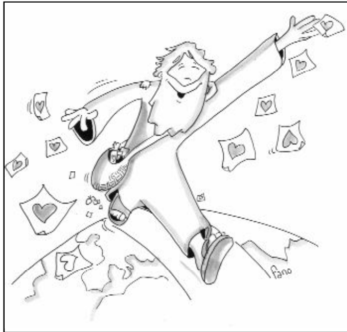
“El que siembra la buena semilla es el hijo del hombre”

Los criados proponen una solución aparentemente eficaz e inmediata: ¿quieres que vayamos a arrancarla? Una reacción que a más de uno se nos ocurre cuando vemos en la Iglesia –signo del Reino– y en nosotros mismos esa situación de ambigüedad y de mezcla que, a veces, nos resulta tan desesperante. La respuesta de Jesús es clara: “No, que podríais arrancar también el trigo. Dejadlos crecer juntos hasta la siega”. Y es que arrancar es de expertos, una tarea reservada a los segadores para el final de los tiempos, cuando por su fruto pueda diferenciarse claramente el trigo de la cizaña.