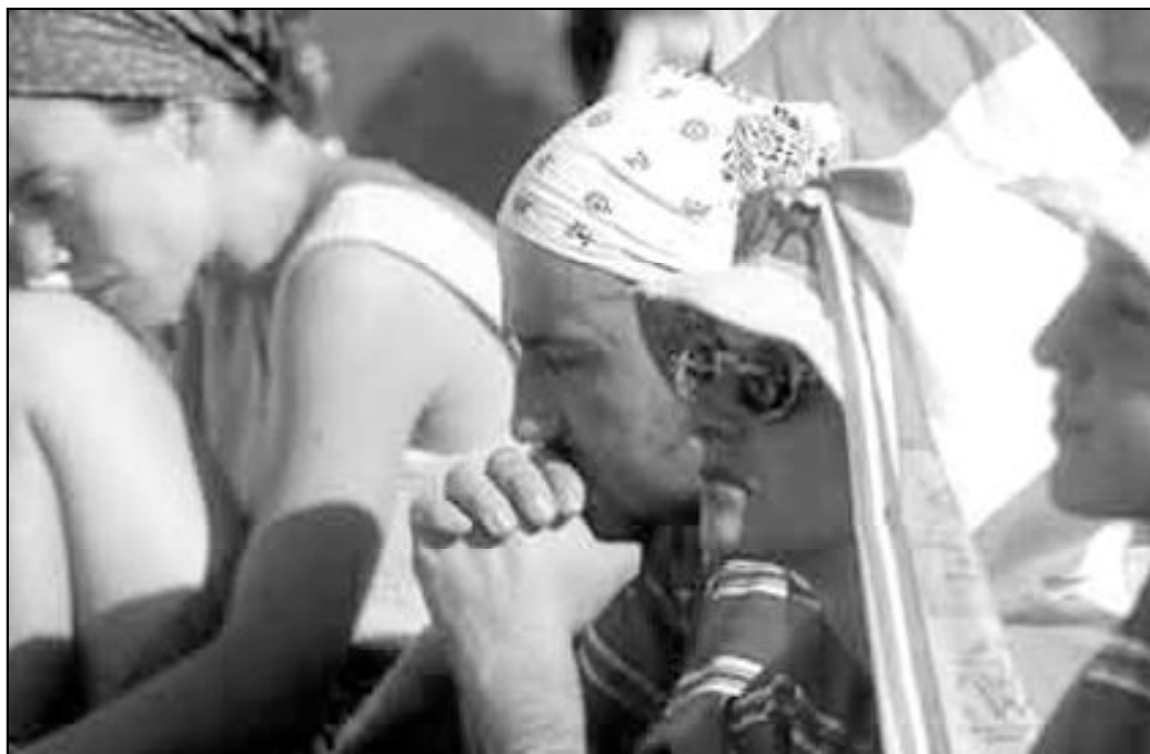
Los malagueños compartirán momentos de oración junto al Santo Padre y a jóvenes de todo el mundo

Borromeo de los Padres Claretianos, participarán en actividades varias, talleres, etc. Este sábado, a media tarde, celebrarán un acto en la Catedral y, por la noche, un festival.