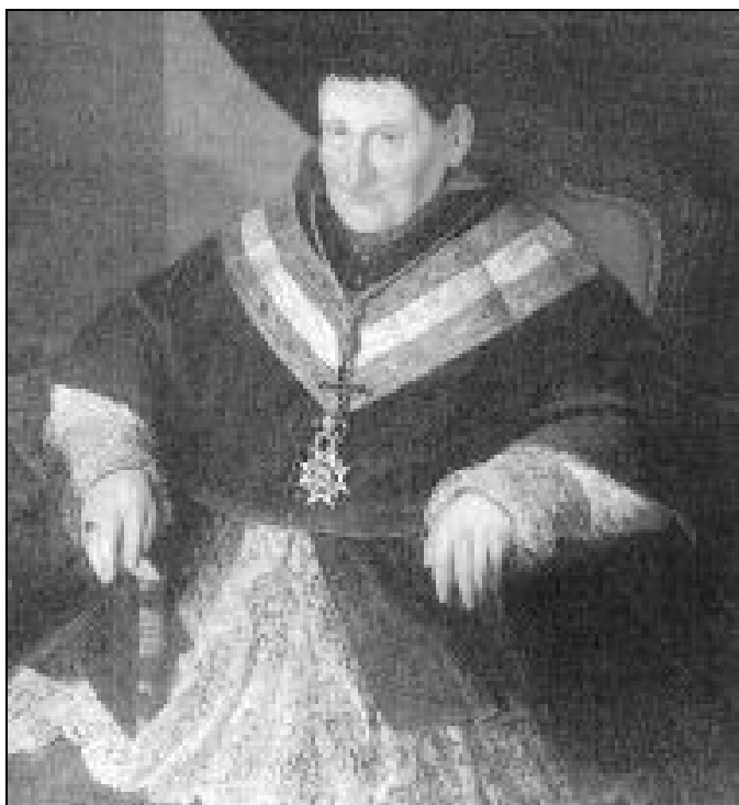
Retrato D. Salvador José de los Reyes García de Lara

La tardanza en el nombramiento del obispo de Málaga, después de trece años de sede vacante, se debió a la ruptura de las relaciones Iglesia-Estado, que fueron restablecidas con la toma de