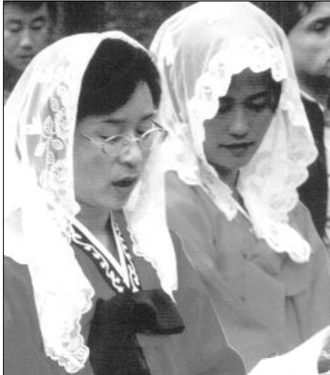
En Corea del Norte hay muy pocos católicos

Tal colaboración es siempre bien acogida, precisamente porque se limitan a ser sólo eso, "Ayuda humanitaria", sin finali-