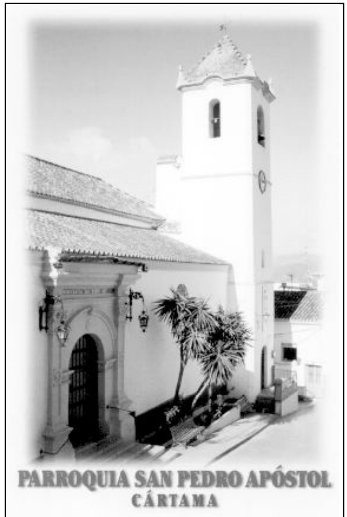
El párroco de Cártama viajará a Roma para estudiar