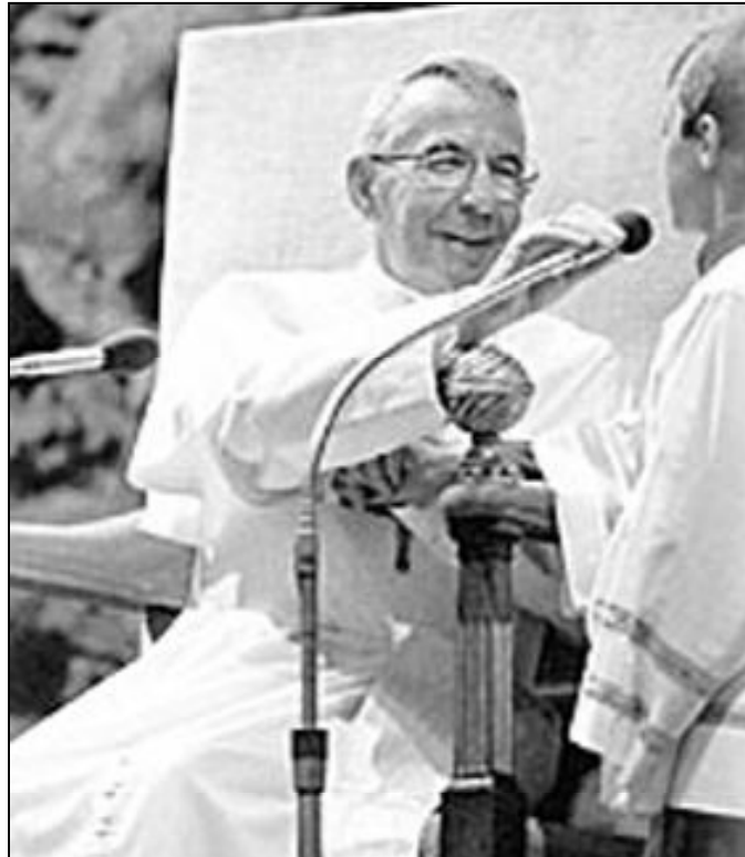
Próximamente podría iniciarse la causa de beatificación de Juan Pablo I

Sin salirnos del continente americano nos encontramos con la Feria de la Esperanza que organizó Cáritas en la capital del Uruguay en los momentos de mayor agitación social. Según sus organizadores, se convirtió en un motivo de solidaridad y estímulo en medio de la crisis económica. Cuarenta y tres proyectos de eco-