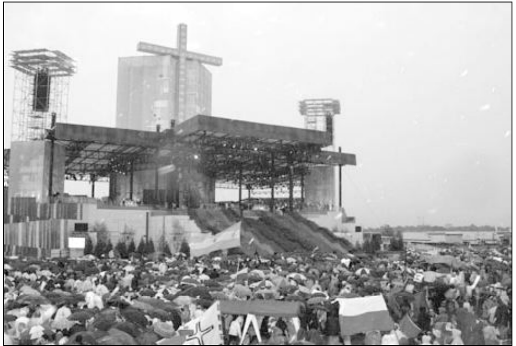
Momento de la multitudinaria Eucaristía presidida por el Santo Padre en Toronto

Tras la estancia en Chicago, seguimos nuestro camino hacia el punto de unión de las Jornadas, Toronto. Cuando llegamos, nuestra sorpresa fue increíble. Después de las presentaciones y saludos, fuimos acogidos por distintas familias pertenecientes a la Parroquia de St. Mary en Brampton. Todos estábamos atónitos, no salíamos de