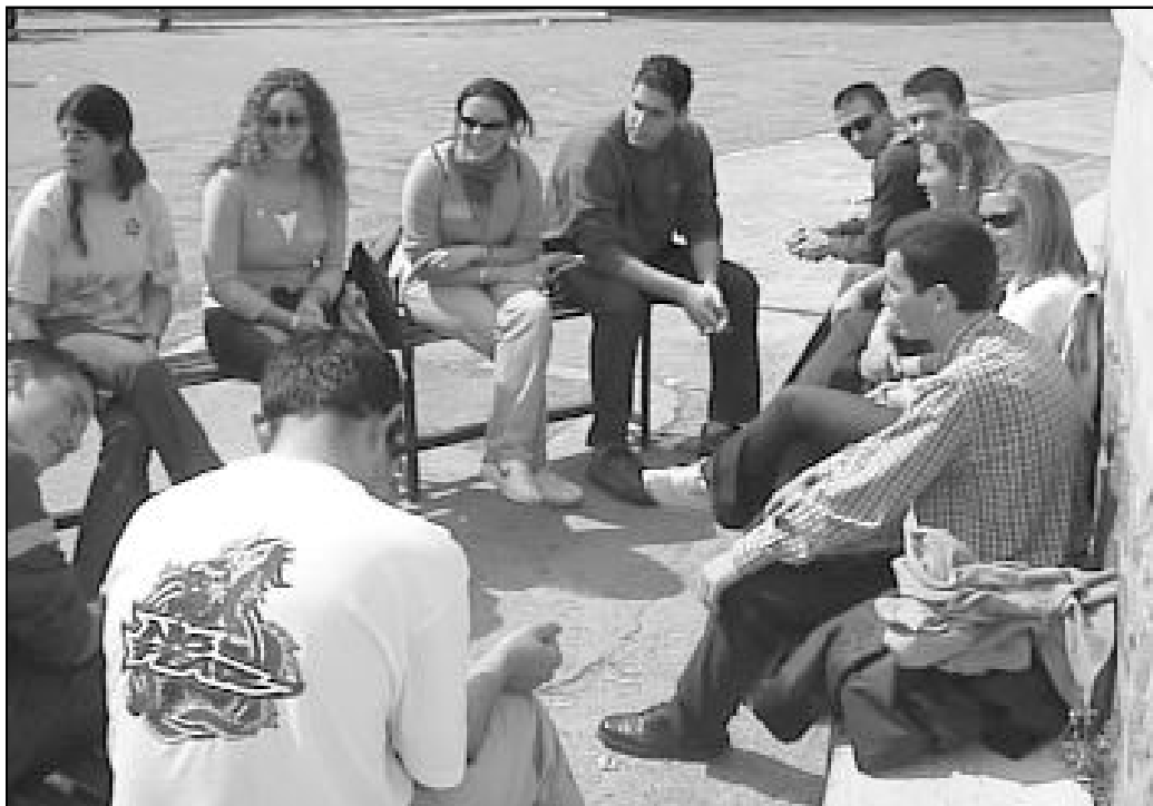
Se pretende plantearle con radicalidad a los jóvenes su vocación cristiana

- Los jóvenes "no son un problema: son nuestra esperanza". Tenemos que empeñarnos en una acción pastoral que les plantee con radicalidad su vocación cristiana.