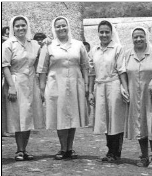
Comunidad de lauritas en la misión de Kayama, donde trabajan curas de Málaga

Dicho Documento, de cerca de sesenta páginas, es resultado de las reflexiones previamente expuestas en la Congregación para los Institutos de Vida Consagrada y para las Sociedades de Vida Apostólica. Recoge el problema que se plantea la Santa Sede y, lógicamente, los Institutos de Vida Consagrada ante el hecho de una cierta crisis de vocaciones. Indiscutiblemente es una realidad, como demuestran las estadísticas que se conocen y son publicadas. Aunque siempre los números, y las estadísticas en particular, no son optimistas y siempre se hace fatigosa su lectura, no obstante en esta ocasión