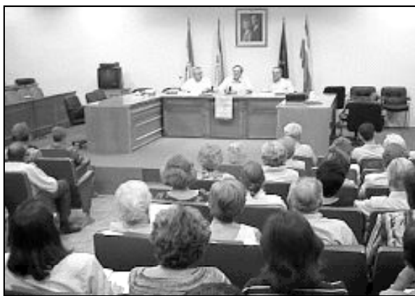
Una de las ponencias de la Semana Bíblica del año pasado

Martes 24: "Luces y sombras en la Iglesia