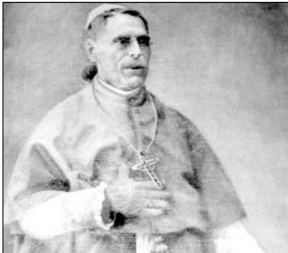
Retrato de Don Manuel Gómez de Salazar. Catedral de Málaga

En enero de 1880 presidió, en la catedral malagueña, el matrimonio de la Princesa viuda de Raftarra con don Luis de Rute y