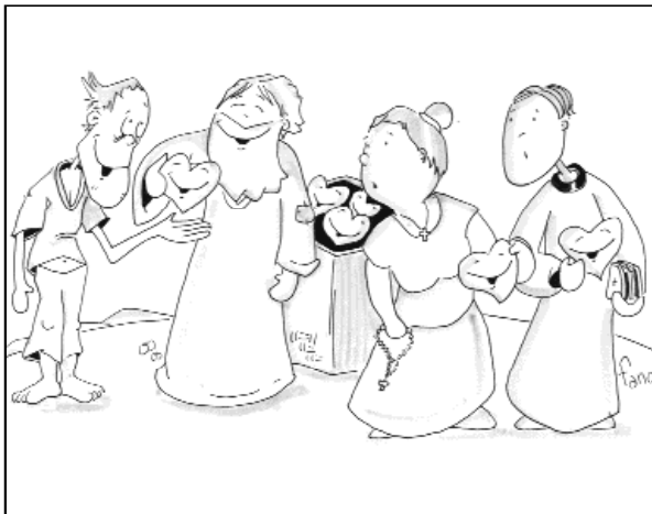
"Los últimos serán los primeros"

Porque a todos el Señor quiere responder vislumbrando etapas