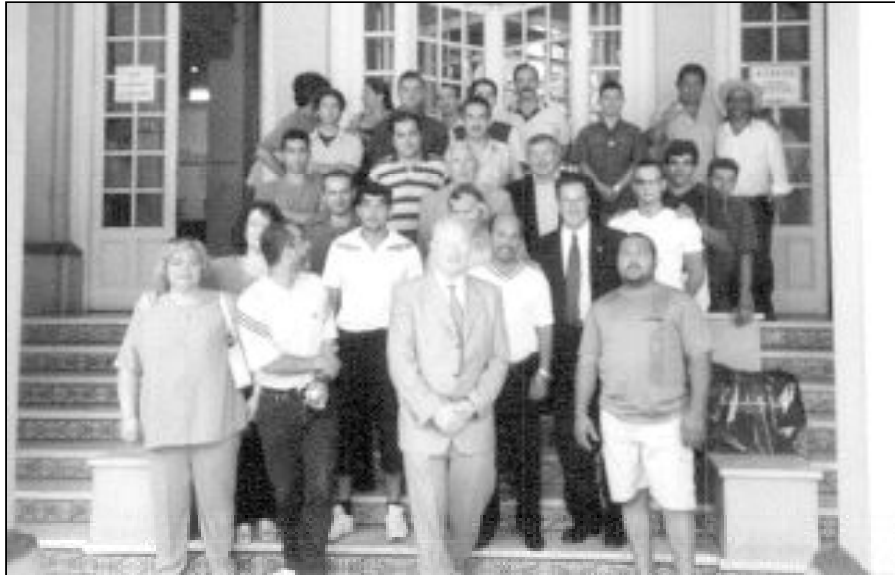
Reduos y voluntarios de prisiones, durante una reciente visita al Palacio de Justicia organizada por la Pastoral Penitenciaria

El Secretariado de Pastoral Penitenciaria ha organizado, para el día de la Merced, un festival en el que participarán diversos artistas. Cuadros flamencos, grupos de baile espa-