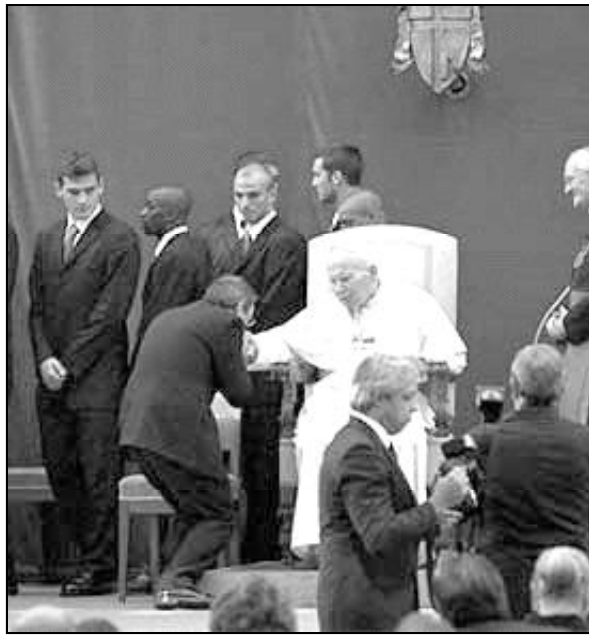
El presidente del Real Madrid saluda al Santo Padre

La primera opción consiste en citar el nombre de Dios en la Constitución, pero esta solución es contestada por aquellos que ven en ella una posible discriminación por parte de los no creyentes, constató el ministro. La segunda posibilidad sería la de reconocer el papel de la religión en la creación de las sociedades europeas, sin escribir el nombre de Dios, añadió. Si bien se declaró menos favorable a esta opción, Buttiglione consideró que era la más probable, pues podría recibir el apoyo de Gran Bretaña y Francia, país este último en el que existe una aguda tradición de separación entre la religión y la vida pública. La tercera solución sería, según él, hacer referencia en la futura Constitución europea a las raíces griegas y judeocristianas del continente. Nuestra identidad