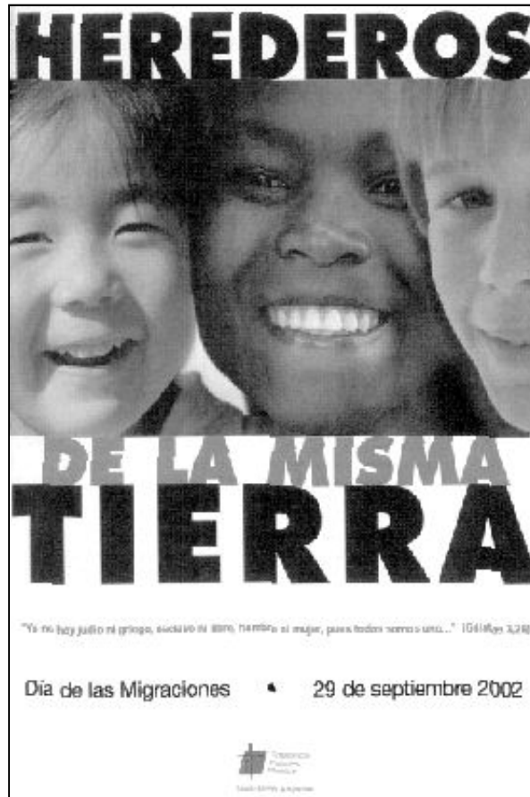
Cartel anunciador del día de las Migraciones