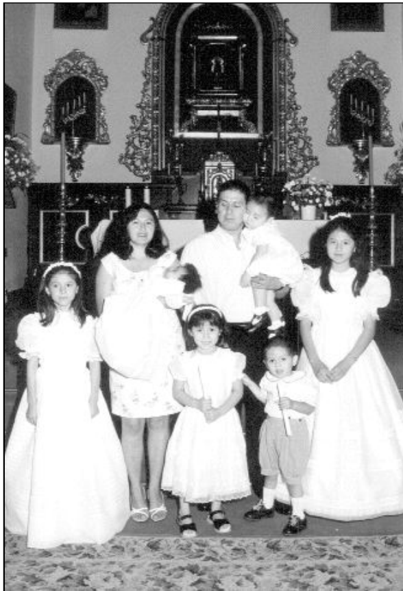
La familia ecuatoriana que vive en el pueblo de Ardales desde el mes de febrero

Desde que llegaron al pueblo, las dos hijas mayores de esta