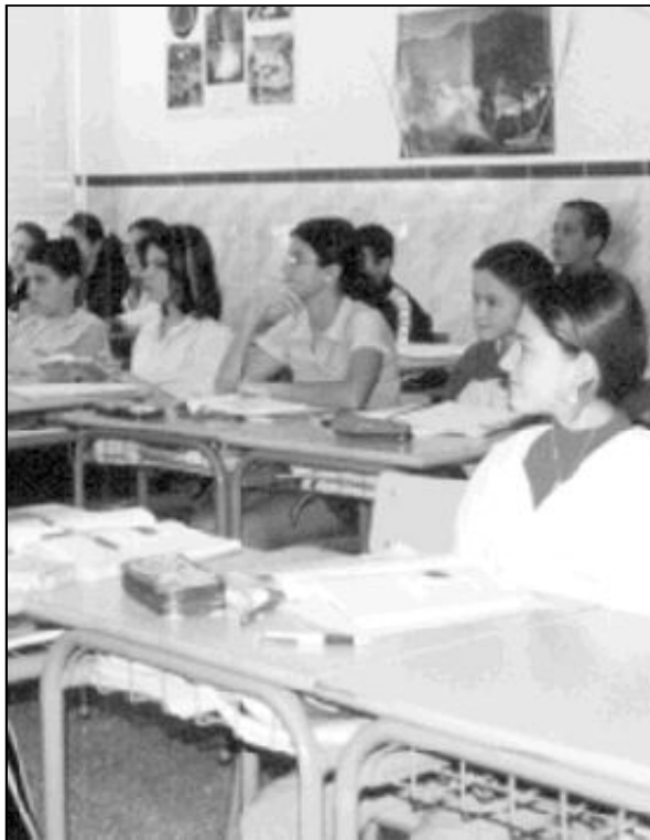
Los alumnos deben ver en el nuevo curso una oportunidad para su crecimiento

El comienzo de un nuevo curso, después de lo que algunos llaman "síndrome de setiembre", se presenta o al menos debe ser así, como un acicate para alumnos, padres y profesores. Se han superado ya los gastos, muy altos por cierto, de los preparativos. Sería un error considerar el comienzo de un nuevo curso como algo rutinario, como etapa pesada, conflictiva, difícil. Tan lamentable, como si el labrador que anualmente esparce la semilla en el campo, lo hiciese con monotonía, disgusto, sin esperanza. Todo lo contrario. Debe entenderse como una nueva oportunidad, un nuevo escalón que