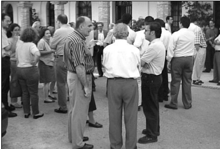
Alumnos y profesores de los centros de formación durante un descanso en la inauguración de un curso pasado