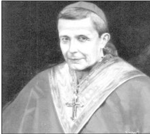
Retrato de Don Marcelo Spínola. Catedral de Málaga

Don Marcelo pasó desde Coria al obispado malagueño, haciendo su entrada el 16 de septiembre de 1886. Inició sus tareas, como prelado, realizando una visita pastoral por la zona de Álora y sus alrededores. Una faceta muy