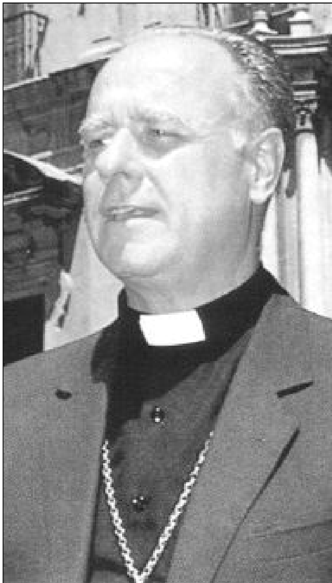
Don Ramón Buxarrais es designado obispo de Málaga en 1973

El día 19 de Agosto de 1971 es nombrado obispo de Zamora. El