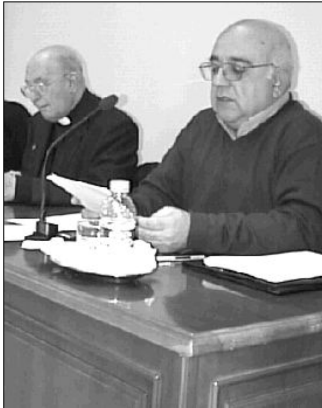
Los laicos se conciencian cada vez más de su corresponsabilidad en la Iglesia