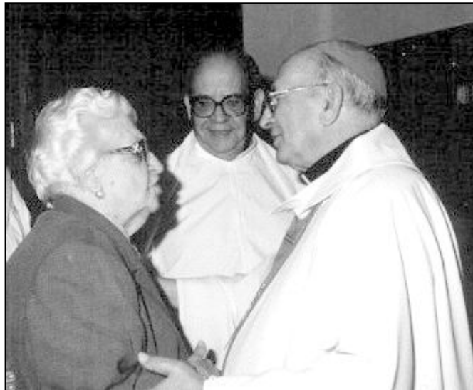
El Sr. Obispo comenzará en breve su visita pastoral al arciprestazgo

Este equipo sacerdotal se reúne dos jueves al mes para compartir un día de formación, oración y experiencias vividas en cada una de sus parroquias. Según Jerónimo, el 80% de los sacerdo-