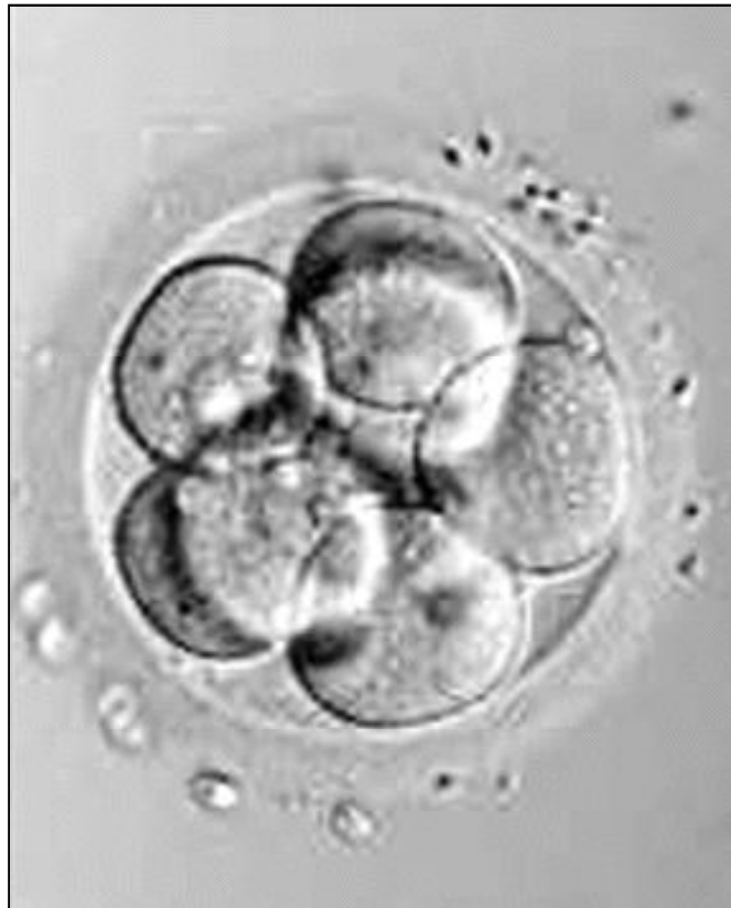
Un embrión de ocho células

Ahora bien, estas cotas de bienestar obtenidas no pueden fundamentar la reivindicación de una libertad sin límites en la investigación científica basán-