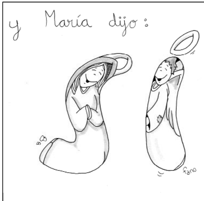
Y María dijo sí

"Alégrate, llena de gracia, el Señor está contigo", repetimos con el ángel. Dios se acerca a María con una invitación a la alegría. Lo primero que hace Dios cuando irrumpe en una vida es abrirle de par en par las puertas de la alegría. Dios quiere llegar a nosotros para ofrecer-