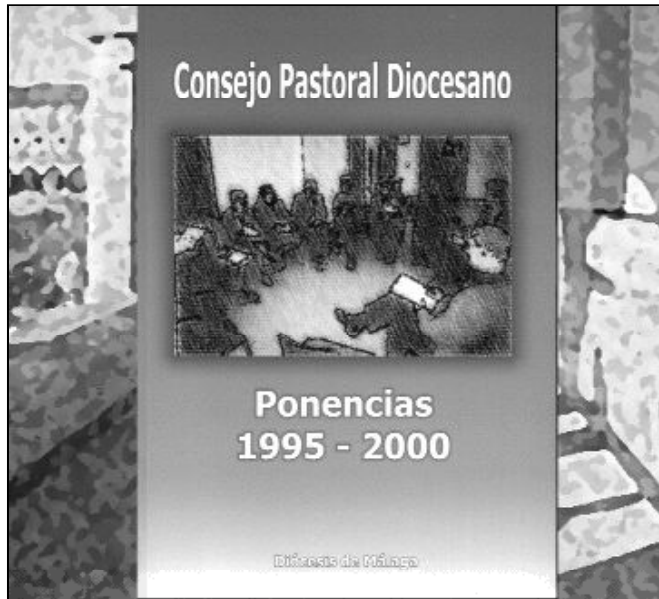
Portada del libro que recoge las ponencias del Consejo Pastoral Diocesano