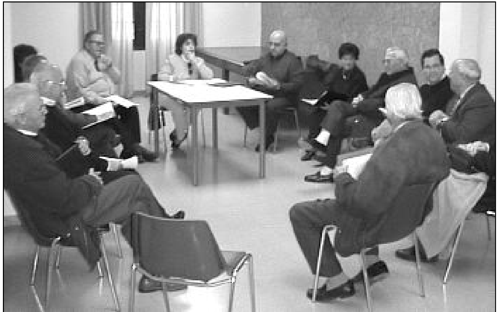
Reunión por grupos de trabajo en uno de los plenos del Consejo Pastoral Diocesano

precedente, el Consejo está formado por 120 miembros, que representan todos los sectores diocesanos. Poner de acuerdo a tantas personas sobre los temas a tratar sería muy complicado, así que existe una Permanente,