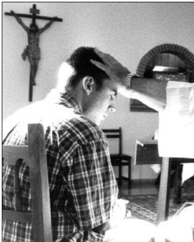
El Adviento es un buen tiempo para la reconciliación

Volviendo a lo anteriormente dicho, la coincidencia de la fiesta de la Inmaculada y el Adviento nos ofrece la oportunidad para vivir el tiempo litúrgico del Adviento con una mayor intensidad o devoción religiosa. Nos preparamos un año más para espe-