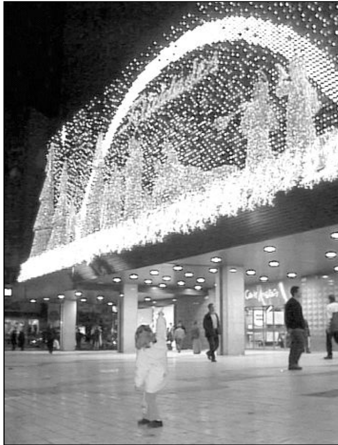
A veces, se pierde el verdadero sentido de la Navidad

"En el puente de la Inmaculada, ponemos el belén -señala Ángel-. Los niños ayudan a mon-