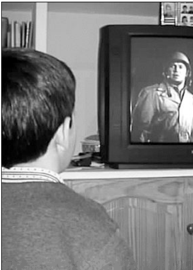
La televisión también debería ser transmisora de buenas noticias