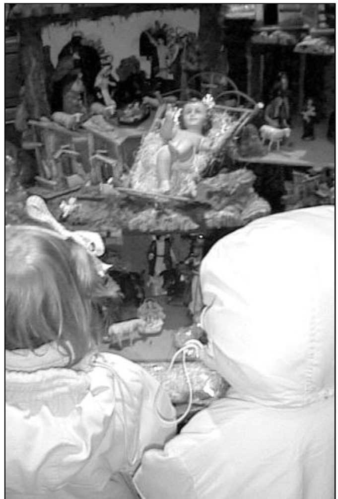
Los belenes son excelentes medios para transmitir la fe a los más pequeños