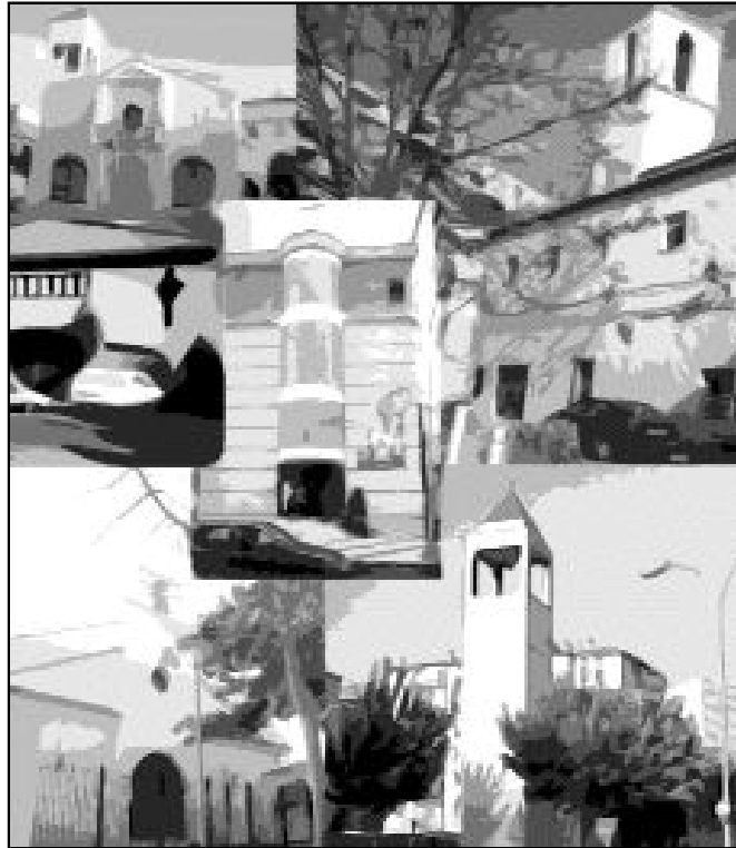
Las parroquias pueden mandar información de sus respectivas comunidades

El criterio elegido por el equipo de redacción para la exposición de las parroquias es un riguroso orden alfabético del nombre de los municipios a que pertenecen, por ello en el próximo número (el 29 de diciembre), aparecerá el templo de Alameda, dedicado a La Purísima Concepción. Las parroquias de la capital se clasificarán dentro de Málaga, por orden alfabético de titulares.