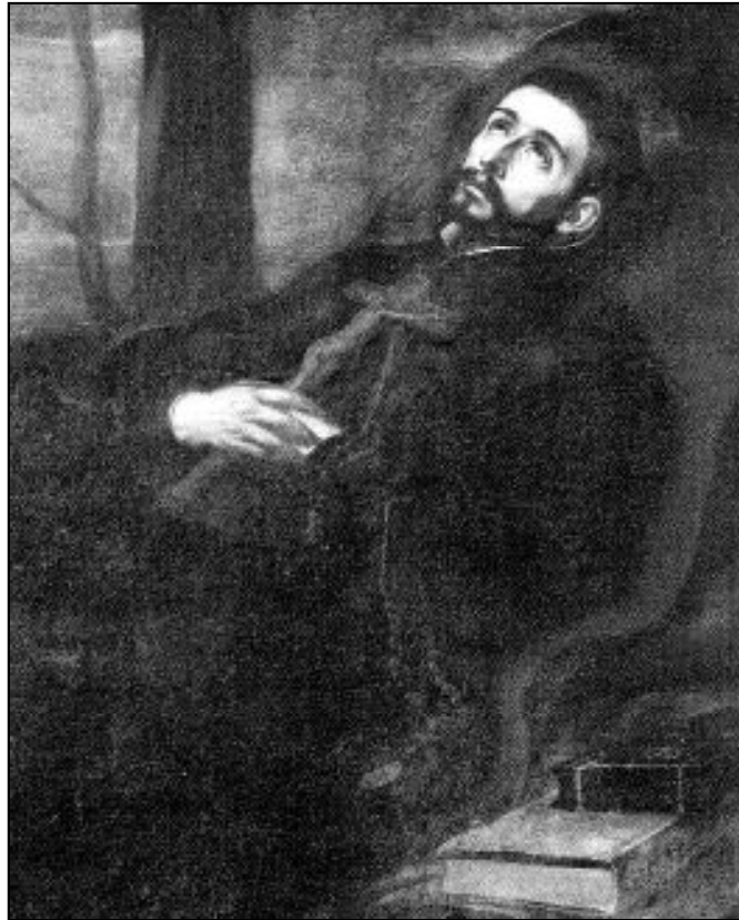
San Francisco Javier fue declarado patrono de Oriente

En el siglo XVI la Iglesia contaba con buen número de misioneros, en Latinoamérica. En particular, Franciscanos y Dominicos, que acompañaban a los conquistadores españoles en las colonizaciones. El Rey de Portugal Juan III solicitó de San Ignacio, por medio del Embajador Mascareñas, que enviara seis misioneros a la India, a cuya petición contestó Ignacio que si "Manda seis a la India, cuántos quedan para el resto del mundo!". Y designó a dos: Javier y Simón, pero éste, al ponerse enfermo, no