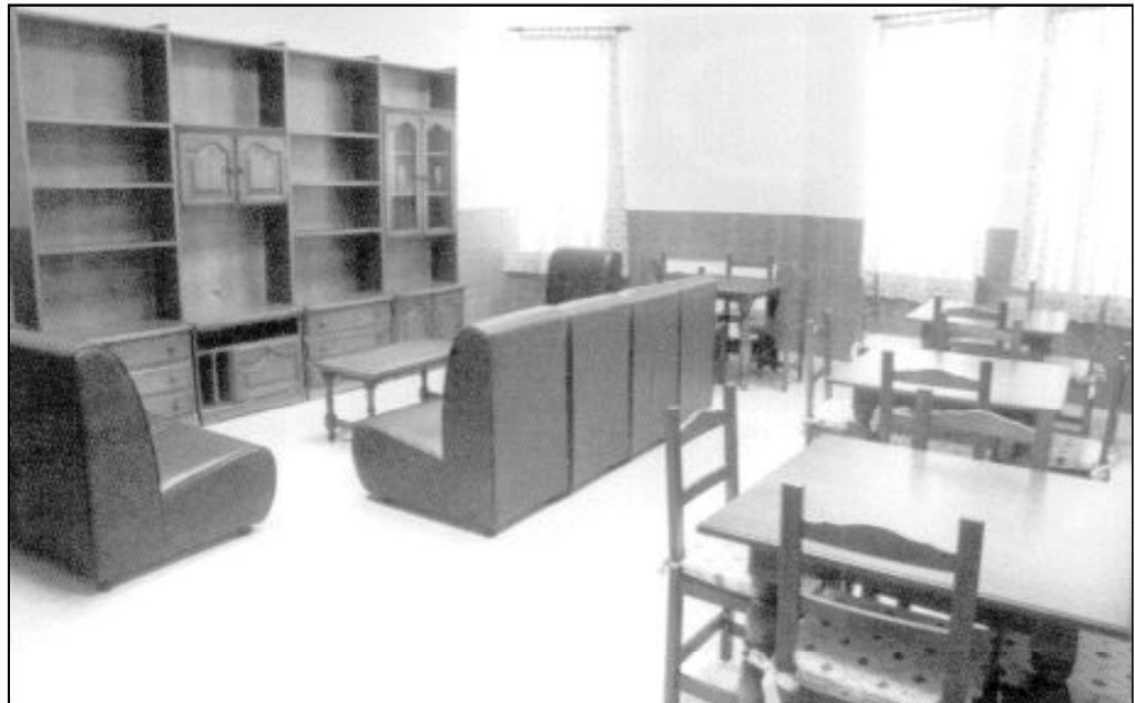
Vista de uno de los salones del Hogar Pozo Dulce

Las personas que viven en el Hogar Pozo Dulce y los que colaboran con su funcionamien-