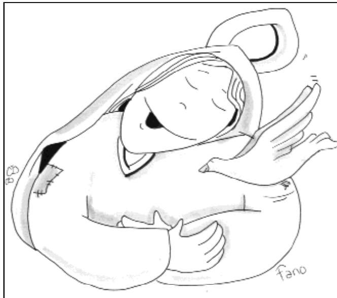
"Hágase en mí según tu Palabra"

Dios prefiere las entrañas de una muchacha a los mármoles del templo. Sus planes no son nuestros planes. No podemos domesticar a Dios, marcarle la ruta, amoldarlo a nuestros criterios, a nuestra forma de pensar, de sentir. No, Dios no se ajusta a nuestra lógica. Dios siempre va más allá de lo que a nosotros nos parece razonable. Siempre se salta nuestras previsiones. Sus criterios no son los nuestros, convenzámonos: Belén es el