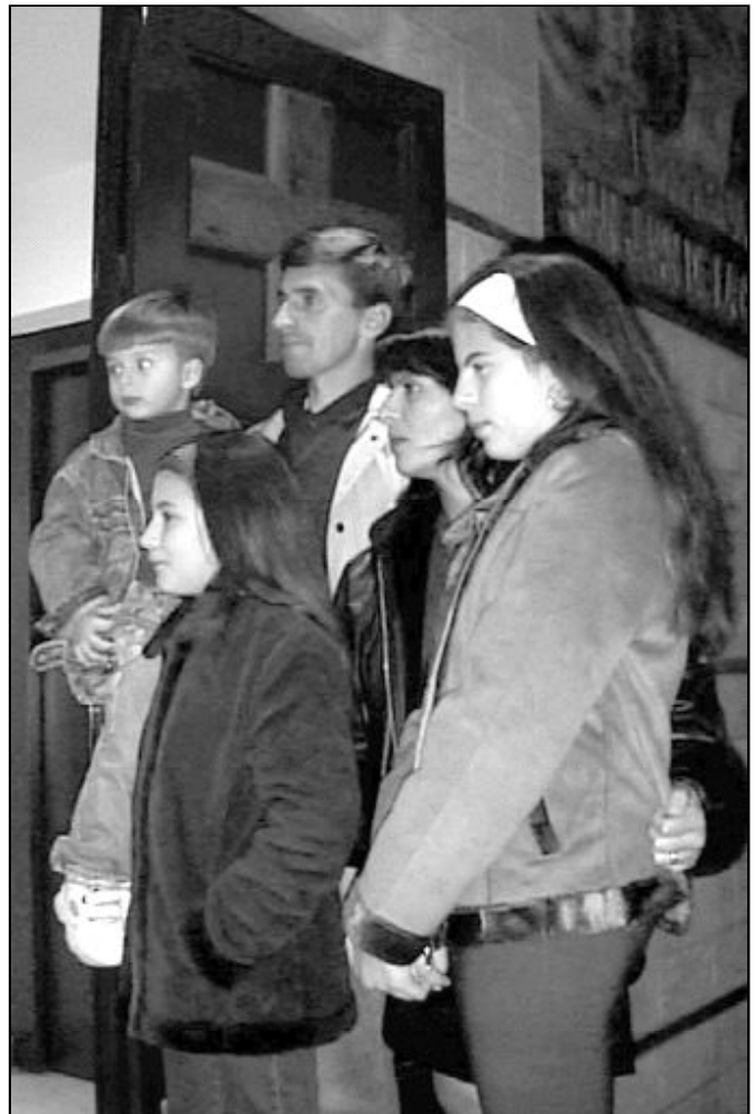
La participación en las comunidades parroquiales es clave para la integración