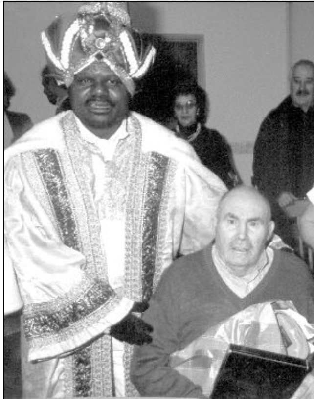
Un anciano recibe un regalo de manos de S. M. Baltasar

En estos días de Navidad y Reyes, multiplica su habitual dedicación a los diversos proyectos. Además, se ensanchan. Me refiero a la asistencia prestada a personas mayores que se encuentran solos. Éste es el tercer año de la campaña de recogida de regalos para ancianos, con ocasión de los Reyes. Su deseo es conseguir de estas personas que renazca en ellas la ilusión. Quieren ser Mensajeros de ilusión.