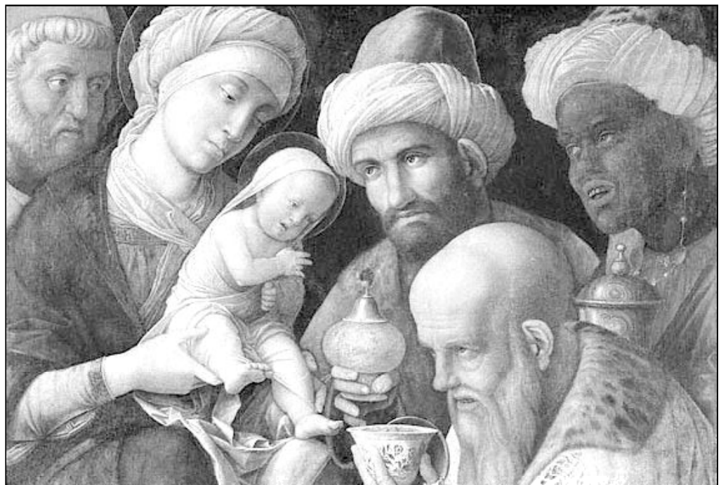
Adoración de los Magos, Andrea Mantegna