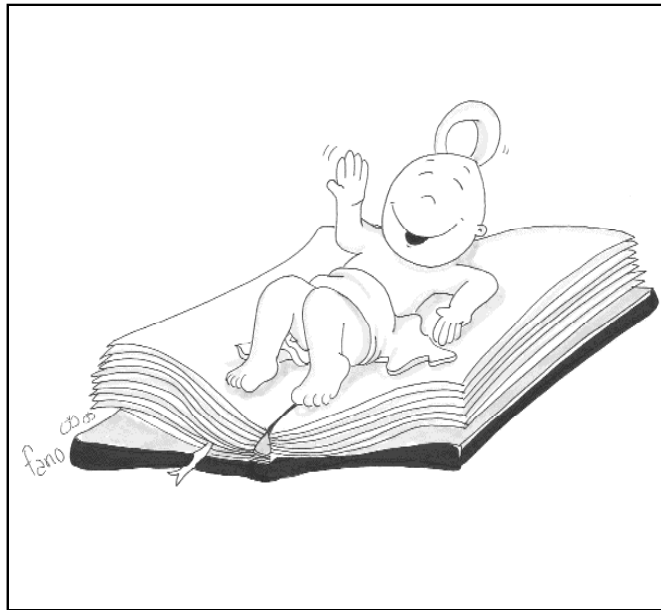
"La Palabra se hizo carne"

"Y tú, ¿por qué crees que Dios existe?", me preguntaron. Les di las razones que pude hilvanar en ese momento. Comprendo que les podían parecer frágiles, aunque yo apoye sobre ellas mi fe. Espero que, con el tiempo, ellos encuentren sus propias razones. Y espero también que descubran que Dios nunca impone su presencia. Dios es siempre respetuoso con nuestra libertad y nunca nos forzaría a creer en él, a amarlo, a dejarlo entrar en nuestra vida. Tampoco a unos chavales de doce años.