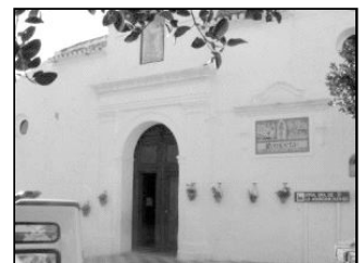
Fachada de la parroquia de Cómpeeta

El coro rociero "Almijara", de la parroquia de Cómpeeta, ha grabado un disco cuyos beneficios irán destinados a la reparación del techo del templo de dicha localidad. Bajo el título "Brisas de Cómpeeta", el disco incluye villancicos, rumbas y sevillanas. El coro está compuesto por 25 voces tanto masculinas como femeninas. El disco se puede adquirir en la librería de la Delegación de Catequesis o en el teléfono 689 54 87 88.