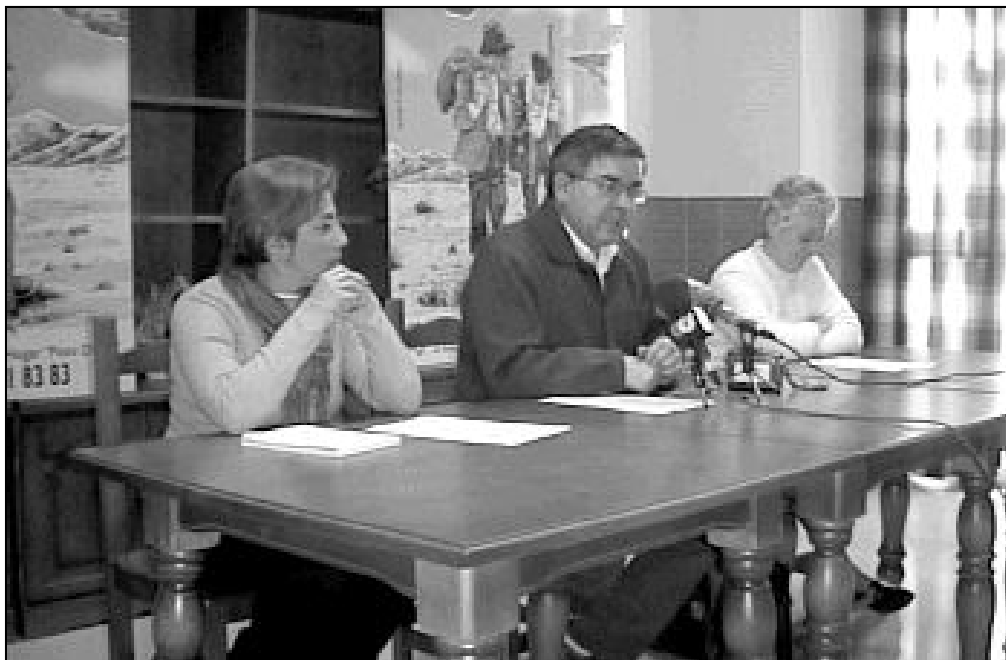
Rueda de prensa con motivo de la inauguración del Hogar Pozo Dulce, en diciembre pasado

Durante el año anterior a la apertura del Hogar se realizó, con la ayuda de un grupo de 22 voluntario, un Trabajo de Calle, en el que tomaron contacto con un grupo de 80 personas que pernoctaban de forma habitual en las calles de la capital.