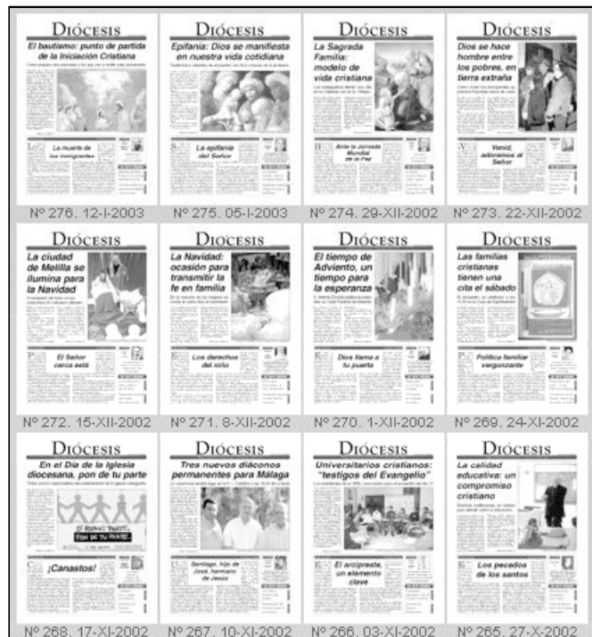
Batería de portadas recientes de la hoja diocesana

Para ello, la autora ha realizado un análisis exhaustivo de las secciones que la componen, así como de los medios, materiales y humanos, necesarios para que este semanario llegue a sus lectores