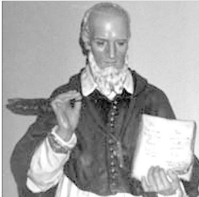
S. Francisco de Sales, patrón de los profesionales de los medios de comunicación

preparación intelectual y su formación humanista, con razón nos podemos preguntar hoy qué valores se dieron en Francisco de Sales para ser reconocido hoy también como Patrono de periodistas y escritores católicos.