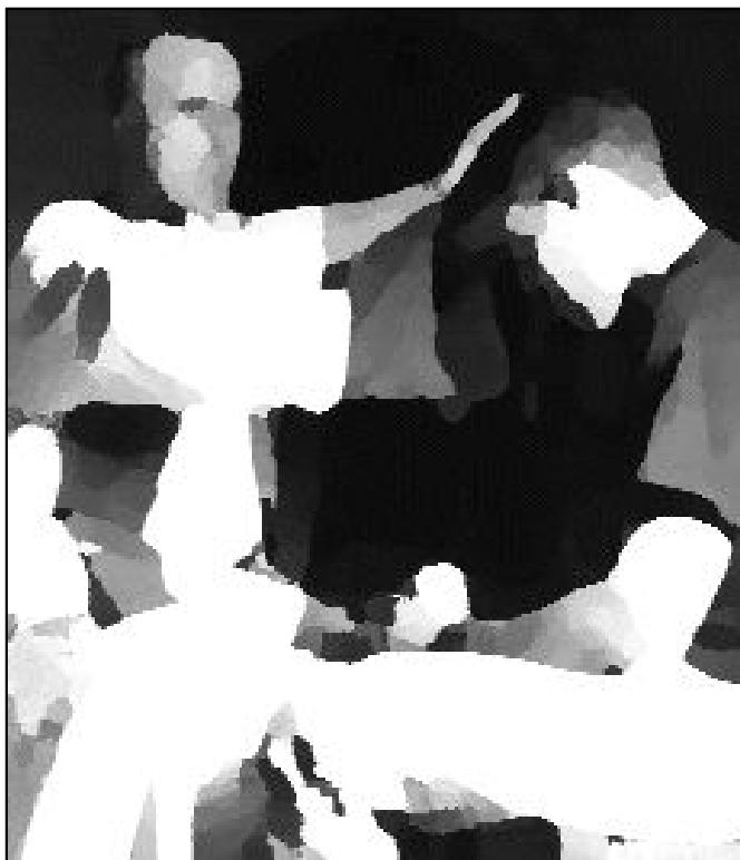
El sacramento de la penitencia no es válido sin cercanía física

El que es protagonista de la siguiente información es Juan Pablo II. Está claro que no se aburre. Si pareciera que poco tiempo libre tiene con todas las celebraciones, compromisos pastorales, viajes y audiencias, resulta que ha robado tiempo en los últimos años de su pontificado para escribir, en polaco, un jugoso libro de poemas. Así lo ha confirmado la Sección polaca de la Secretaría de Estado del Vaticano, respondiendo a diversos rumores que habían circulado en los últimos días por diferentes medios de comunicación de Italia y Polonia, respec-