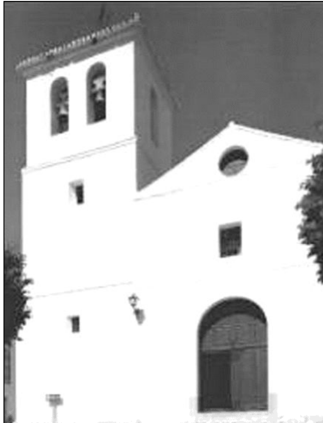
En el templo de Alfarnate destaca su torre de estilo mudéjar

El templo, que data de 1550, posee planta basilical, con tres naves separadas por arcos de medio punto, y con una torre de estilo mudéjar de tres alturas y machón central. Tiene un coro elevado a los pies de la nave central, y baptisterio cubierto con falsa bóveda de crucería, a los pies de la epístola. Ha sido remodelado dos veces, siendo en 1994 la última de ellas. Se renovaron los tejados respetando el antiguo artesanado, la solería del presbiterio y del coro, así