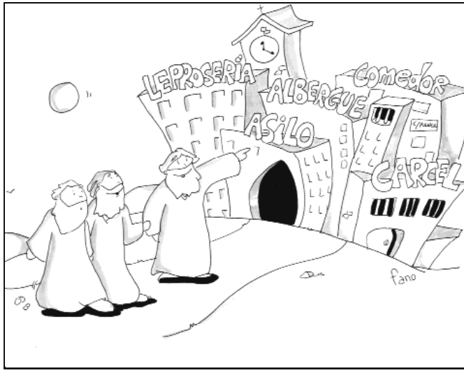
“Vieron donde vivía y se quedaron con él”