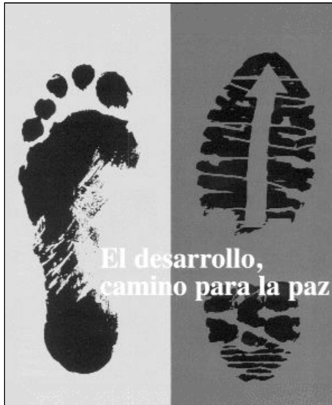
Imagen de la campaña contra el hambre 2003 de Manos Unidas

Durante el año se celebran tres plenos y, en el presente curso, cada uno de ellos tendrá como tema central una de las