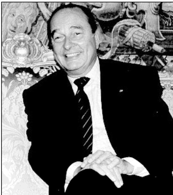
Jacques Chirac es contrario a incluir referencias religiosas en la Constitución Europea

Juan Pablo II ha manifestado recientemente su "proximidad espiritual con las personas separadas, divorciadas y divorciadas que se han vuelto a casar, que, como bautizadas que son, están llamadas, en el respeto de las normas de la Iglesia, a participar en la vida cristiana". Estas declaraciones las realizó al recibir en audiencia a miembros de la organización católica de los Equipos de Nuestra Señora, que preparan