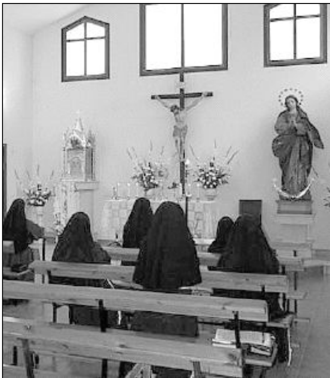
Comunidad de las Hermanas Capuchinas en el Monte Calvario

carisma de los consagrados/as, desde los primeros comienzos de sus orígenes en los siglos III y IV hasta nuestros días, van dirigidos a la participación en la misión salvadora de la Iglesia,