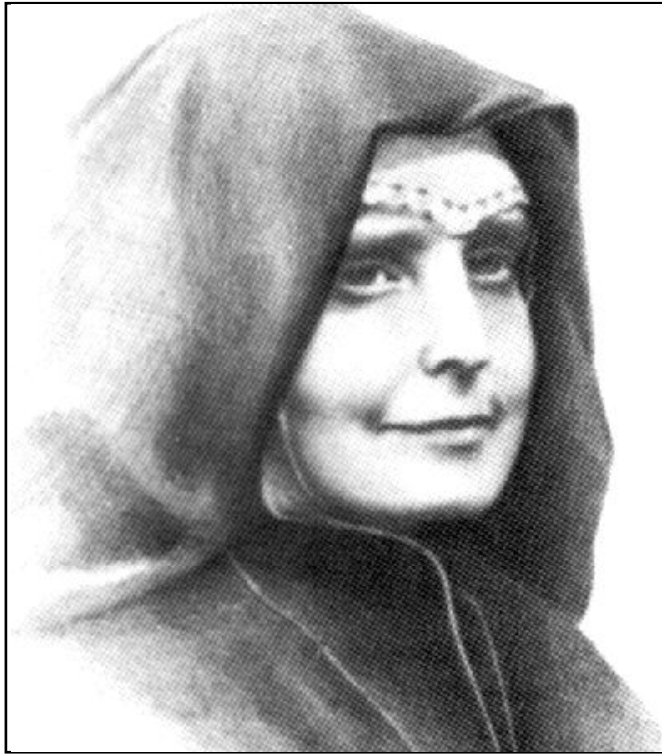
Santa Vicenta María, fundadora de las Hijas de María Inmaculada