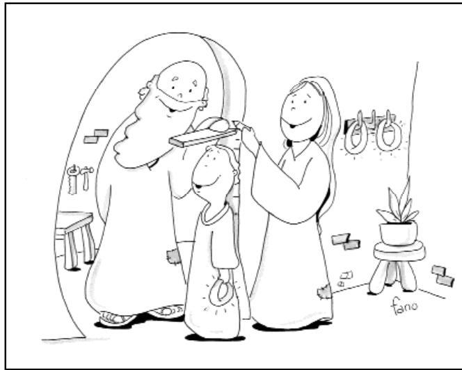
"Iba creyendo y robusteciéndose"

Pues bien, el evangelio de este domingo nos habla de realidades. "La gente se asombraba de su enseñanza, porque les