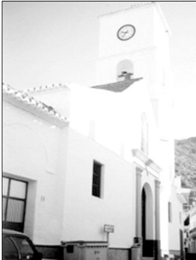
Fachada del templo parroquial de Algarrobo

Sin embargo, en Algarrobo, la parroquia cuenta con una serie de ermitas que le hacen coro con devoto afecto. Se trata de las ermitas de San Sebastián y San Antón, del s. XVI, desde donde se procesiona la imagen del primero el día 20 de enero, de la Pastora y San José y de Ntra. Sra. de las Angustias, que al igual que la primera, ha tenido que cambiar de solar unos metros para no entorpecer al tráfico y es toda una obra de arte contenida en tres por tres metros de superficie.