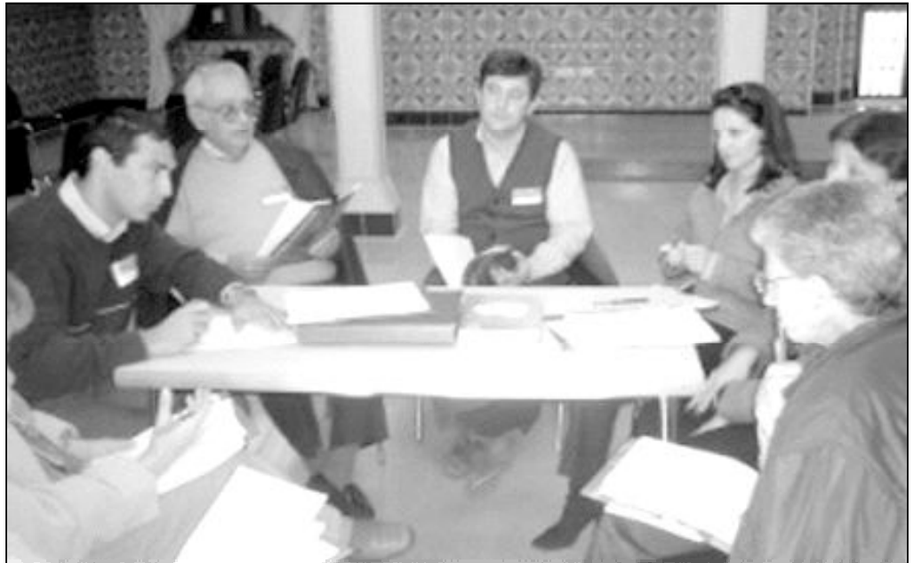
Una de las reuniones por grupos celebradas a lo largo del Simposio sobre la Iniciación Cristiana