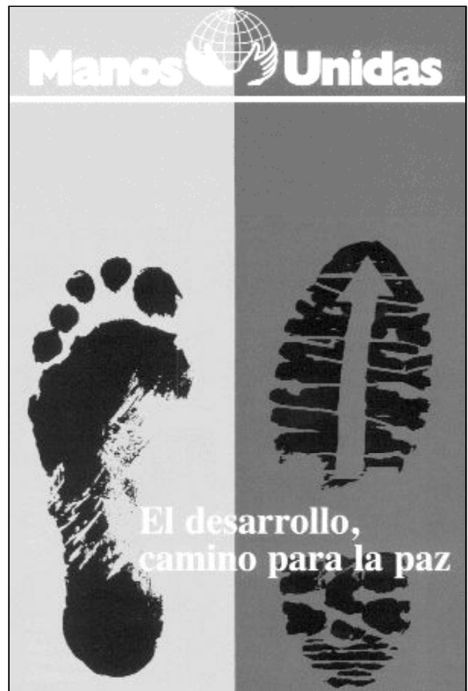
Cartel de la Campaña de Manos Unidas de este año