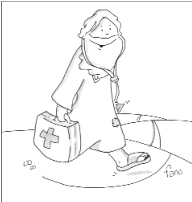
"Curó a muchos enfermos"

El evangelio de hoy nos narra una jornada de trabajo de Jesús. Es sábado y, después de ir a la sinagoga, vuelve a casa de Pedro, donde se aloja en el pueblo de Cafarnaún. Jesús es, pues, imagen de un Dios que nunca deja de trabajar, ni siquiera en sábado. ¿Y cuál es el trabajo de Dios? El mismo que dice el salmo: "El Señor sana los