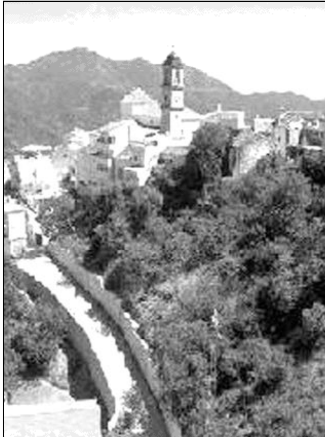
La torre de la parroquia de Algatocín destaca por su belleza.

La vida parroquial es muy activa, y en ello influye también la labor que realizan desde hace