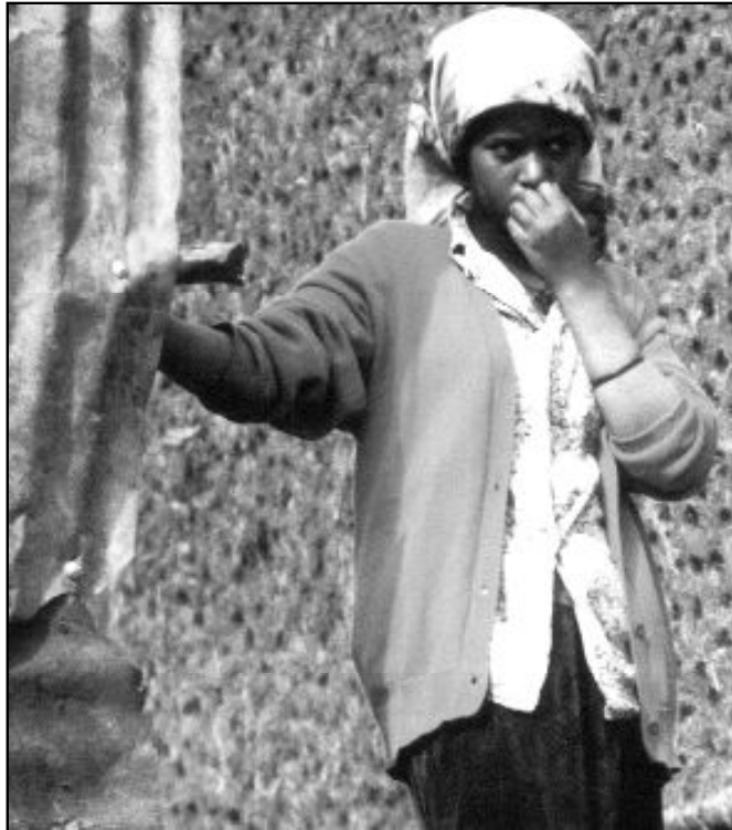
Manos Unidas busca senderos de paz mediante el desarrollo de los pueblos

El ayuno voluntario, como gesto, tiene sentido si va acompañado de acciones concretas: cambio de vida superflua, gastos no necesarios etc. Dicho gesto voluntario carece de sentido si se hace solo para sentirse bien o para acallar la conciencia. Se organizan además diversas actividades de conocimiento e información sobre la acción anual de Manos Unidas, la forma de ayudar al llamado Tercer Mundo, mediante proyectos concretos para educación, comedores para niños y familiares, enseñanza etc. La información sobre estas actividades, suelen realizarla mediante misioneros y laicos que trabajan en esos países y ofrecen charlas y conferencias sobre sus respectivas actividades. Manos Unidas