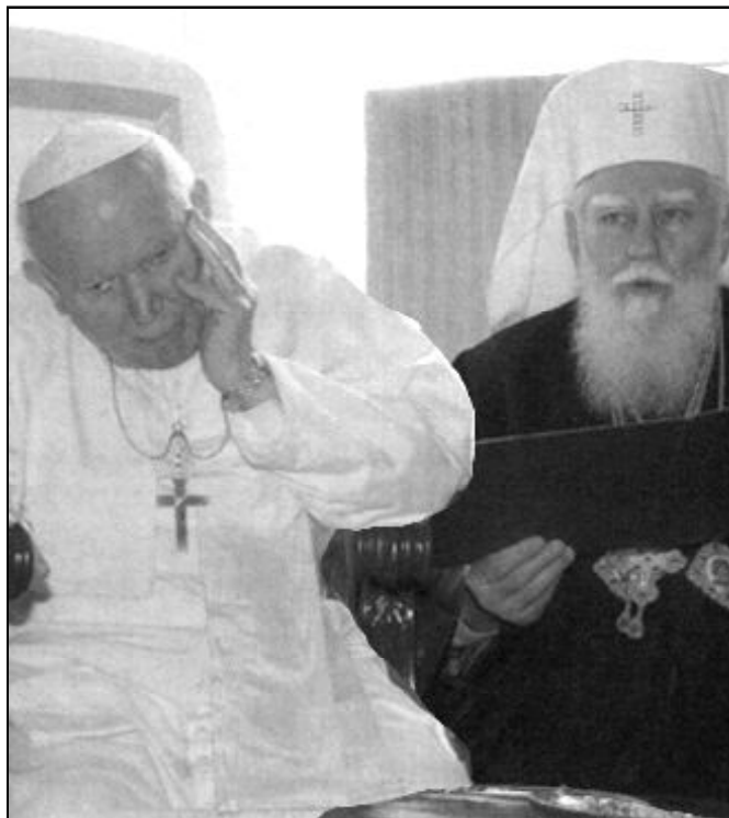
Juan Pablo II quiere abrir una nueva fase de diálogo con las iglesias orientales