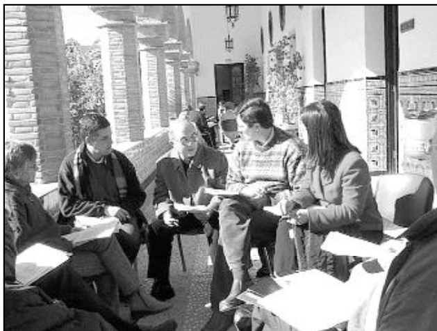
Uno de los grupos de trabajo del último pleno del CPD

valorando las posibilidades pastorales y eligiendo las más conformes con el espíritu Evangélico y las necesidades de nuestra realidad diocesana; esto implica que hay que captar lo que Dios quiere para su Iglesia, e implica también un descentramiento de nosotros mismos y