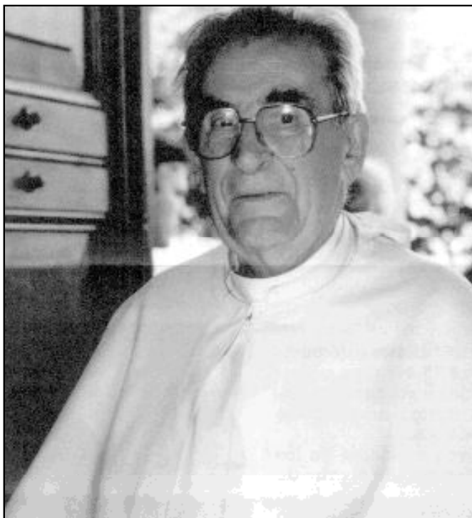
Padre Werenfried, fundador de «Ayuda a la Iglesia Necesitada»

Y el que persiste en sus acciones diplomáticas encaminadas a conjurar la guerra contra Iraq a través de «gestos», persuasión y alertas ante las nefastas posibles consecuencias es el Vaticano. El secretario de Estado, cardenal Angelo Sodano, se preguntó si