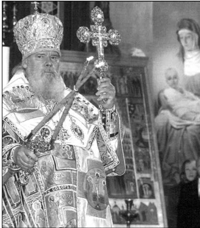
El patriarca ortodoxo ruso ha manifestado al Papa su deseo de diálogo

Cierto que en estos últimos años las relaciones han sido difíciles, no tanto o exclusivamente por razón de los contenidos de la fe cuanto a causa de las interpretaciones que se sacaron de algunos de los hechos pasados en Moscú y en Rusia en general. “Estoy convencido –manifestó el sacerdote– de que nos encontramos actualmente en un proceso de aclaración que continuará en los próximos meses”. Manifiesta por ello, estar confiado en el futu-