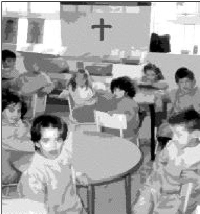
El 92 % de los padres de alumnos de Infantil piden la Religión para sus hijos

La figura del profesor de Religión también ha sido muy discutida, pues, a pesar de que la asignatura está compuesta por una serie de contenidos, se hace necesaria una coherencia de vida por parte del docente. "Sólo desde la vivencia de la fe se pueden