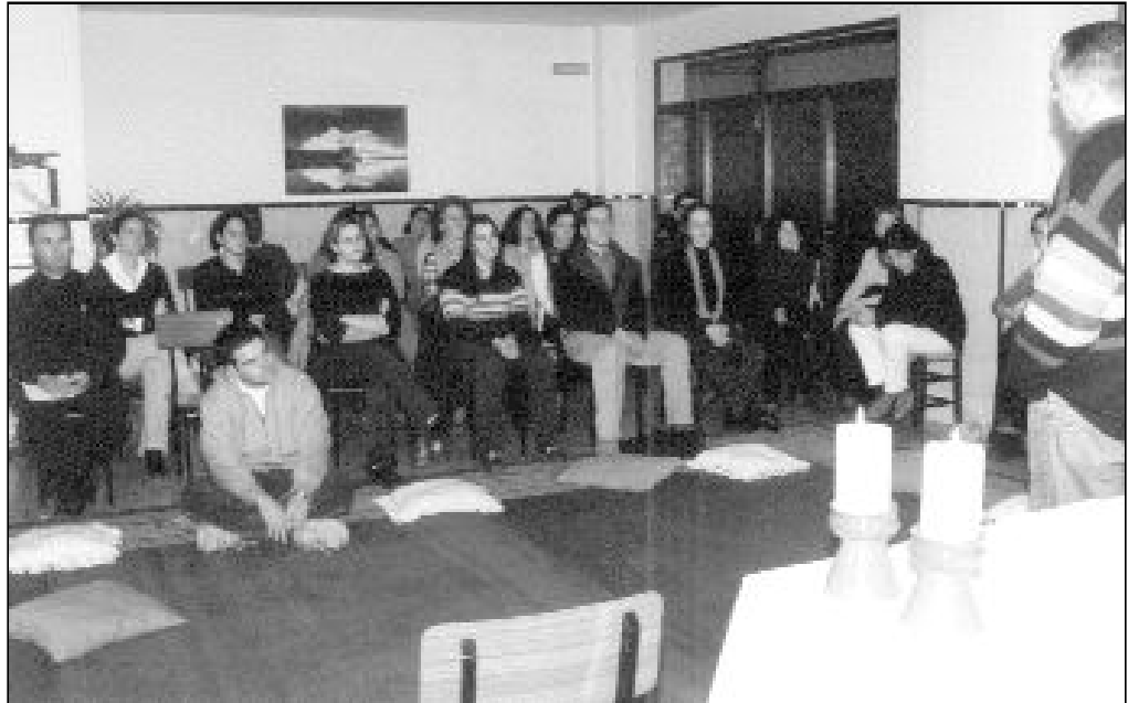
Uno de los encuentros del Taller de Oración organizado por el Secretariado de Juventud

El escenario más probable para su puesta en escena es el Paraninfo de la Universidad de Málaga, aunque aún está pendiente de confirmación, y dará comienzo a las 22:00 h.