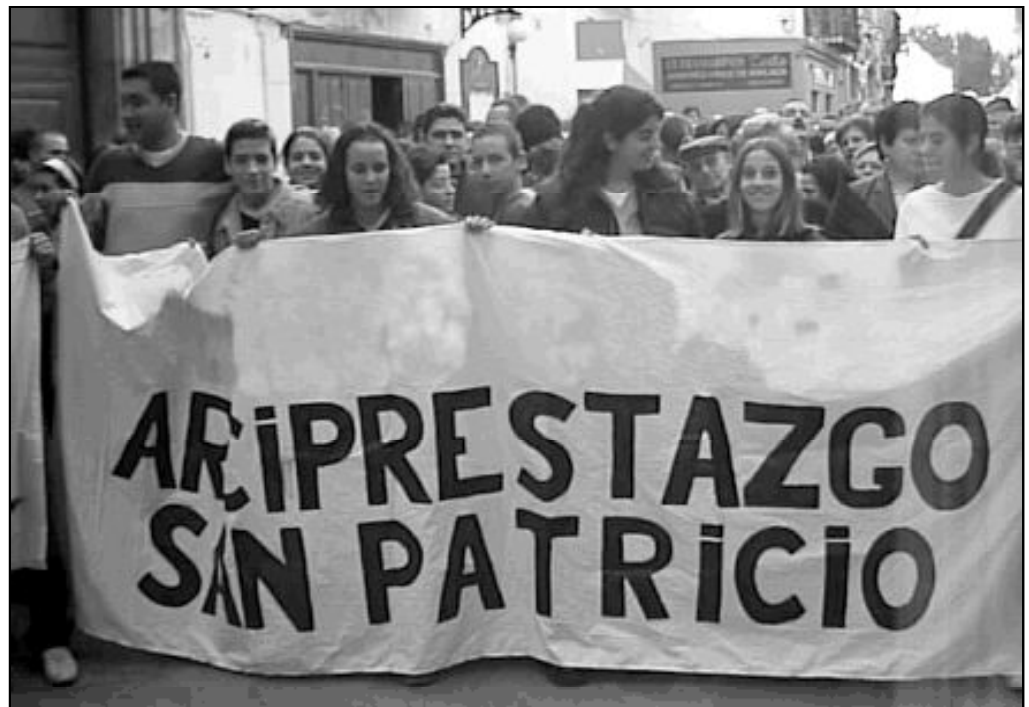
Jóvenes del arciprestazgo de San Patricio portan una pancarta durante la peregrinación