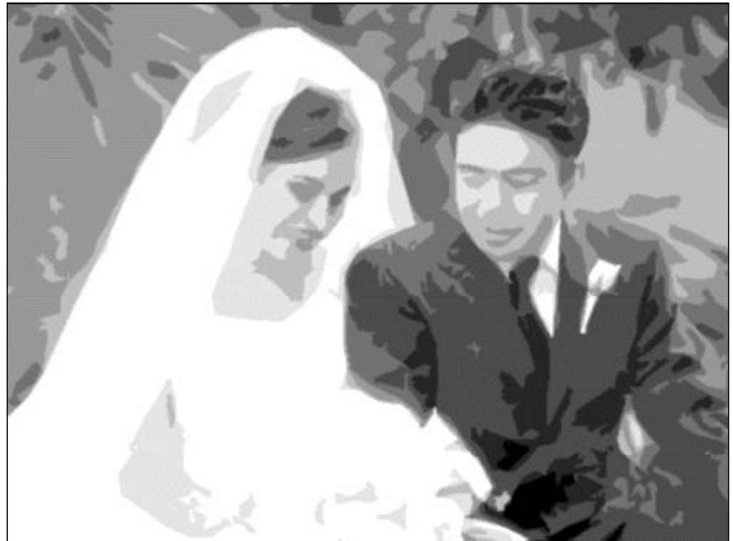
El matrimonio cristiano tiene un carácter sagrado que la sociedad ha olvidado

Debe superarse cualquier darse de división o dicotomía que tienda a separar los aspectos profanos de los religiosos, como si se diesen dos matrimonios, uno profano y otro sacro. El sentido de la trascendencia forma parte ya desde los comienzos de