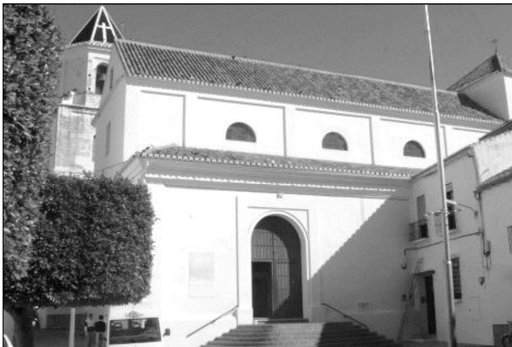
Parroquia de Ntra. Sra. de la Encarnación de Alhaurín el Grande

La historia de la Parroquia de Nuestra S a de la Encarnación de Alhaurín el Grande se remonta al año 1490, poco después de la llegada de los cristianos en 1485. Sobre un antiguo castillo comenzó a construirse el templo. En 1505 fue erigida como parroquia y confirmada en 1510 por el papa Julio II. El templo es de finales del siglo XVI o comienzos del XVII pero, después de una restauración en 1863, perdió su carácter primitivo. En la parroquia se rinde culto a Nuestra Señora de Gracia, patrona de Alhaurín. Sin embargo, esta indefinición artística no es, ni ha sido obstáculo para que nuestra parroquia intente ser algo vivo, el lugar de encuentro de los cristianos de una población que en la actualidad ronda los 20.000 habitantes.