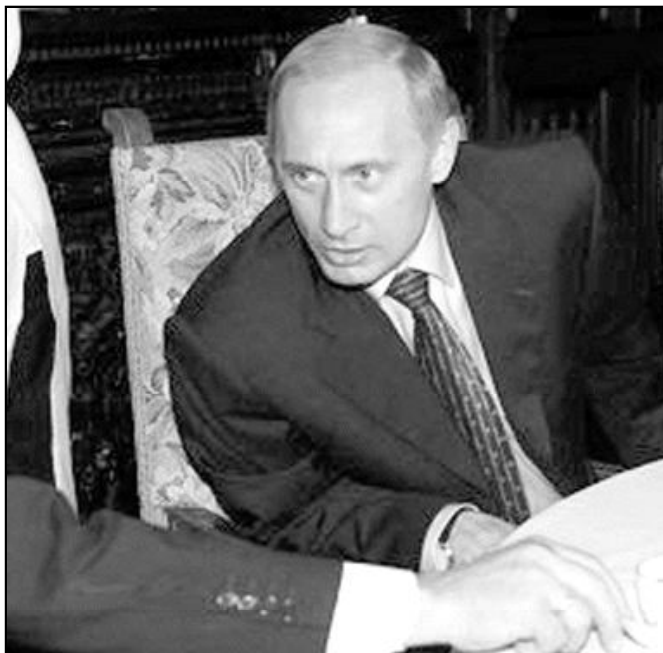
Vladimir Putin considera necesaria una visita del Papa a Rusia