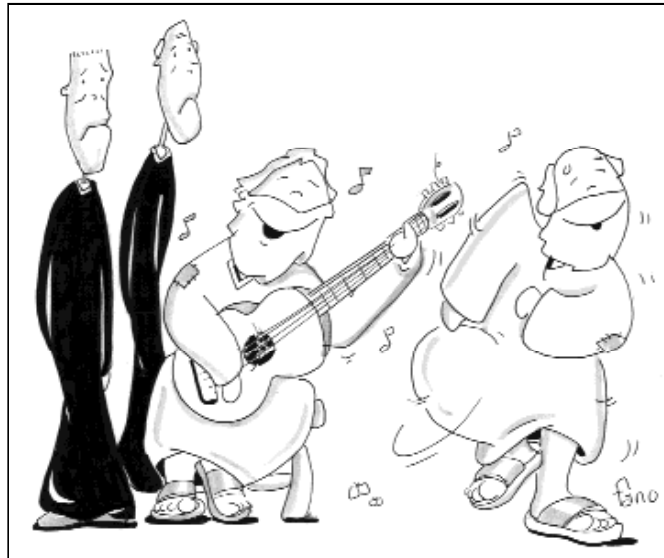
"El novio está con ellos"

"Renovarse o morir", se dice comúnmente. Esta semana, el