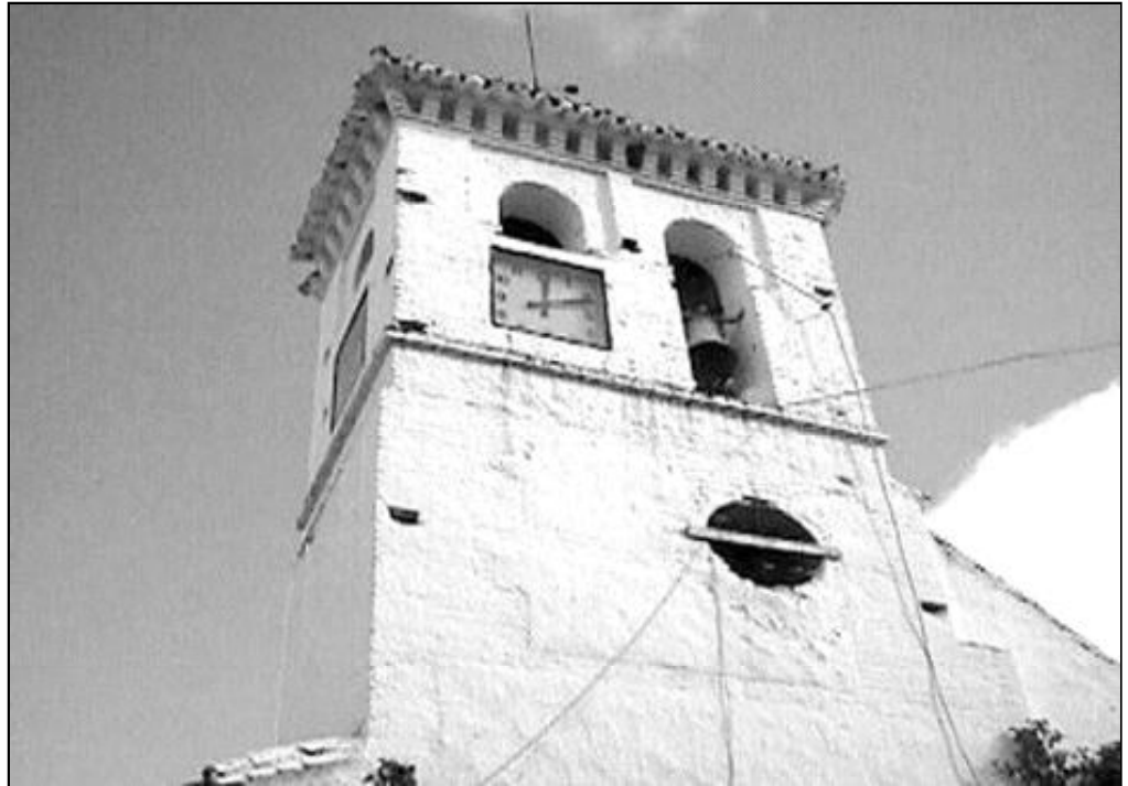
Torre de la Iglesia de Almáchar