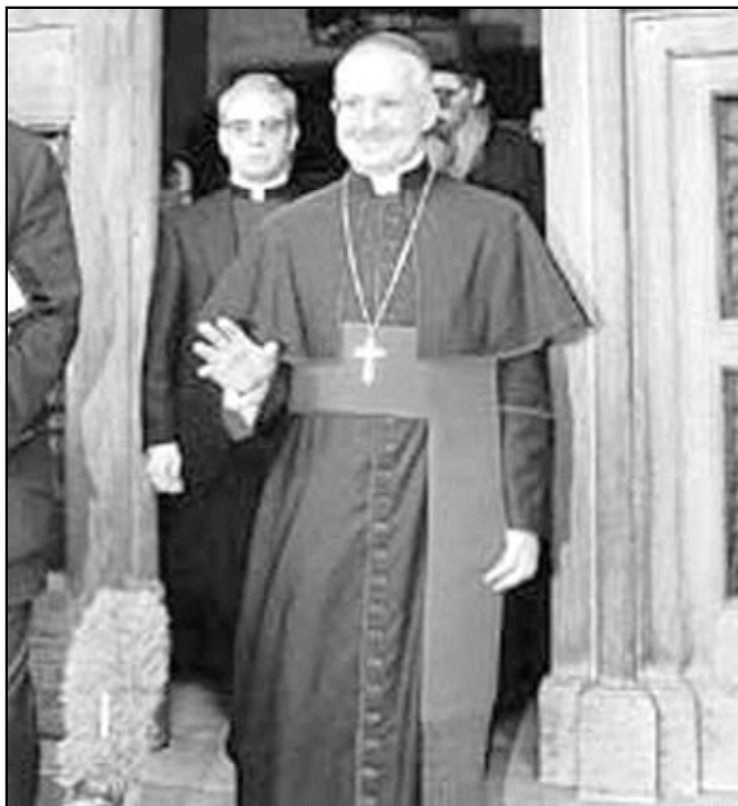
Mons. Jean-Louis Tauran, responsable de la diplomacia vaticana

El prelado subrayó en su discurso que «una guerra de agresión sería un crimen contra la paz. El caso de legítima defensa presupone la existencia de una acción armada previa». El prelado recordó además que el párrafo 4 del artículo 2 de la carta de las Naciones Unidas impone a los estados renunciar a la guerra