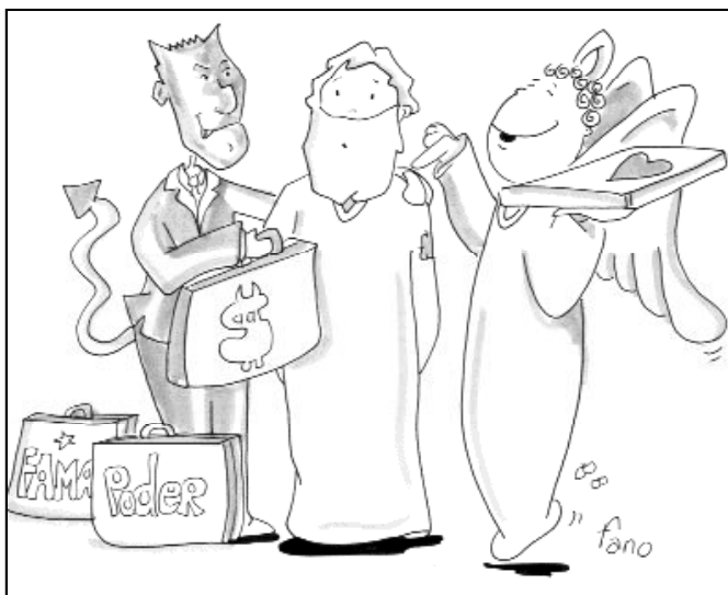
“Se dejaba tentar y los ángeles le servían”

El Reino se hace presente como una llamada al compromiso y a