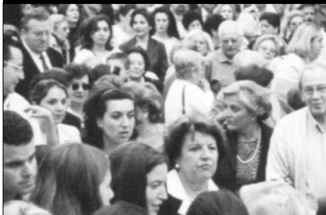
GENTE DE A PIE