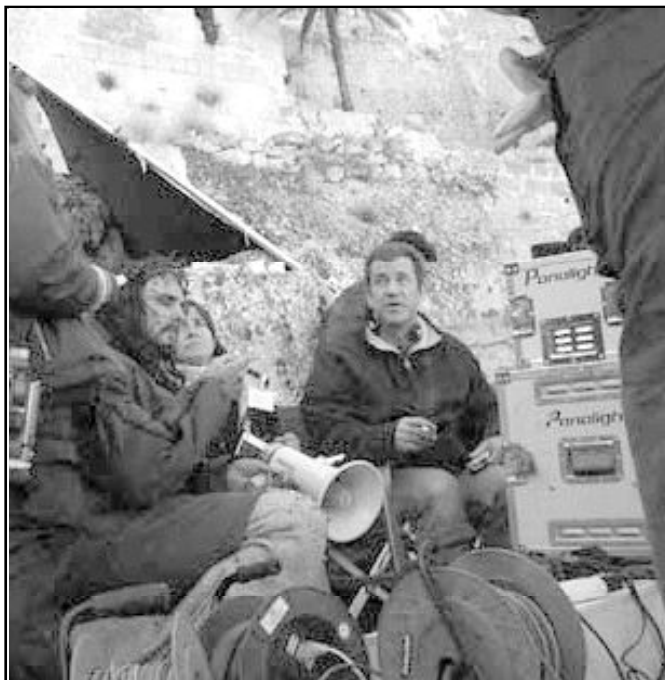
Me Gibson durante el rodaje de una secuencia de su nueva película

Órganos informativos llegaron a afirmar que los obispos habían excomulgado a la niña. Sin embargo, nunca se dio un decre-