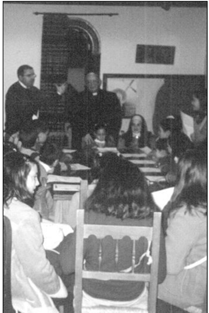
El Sr. Obispo, durante un encuentro con los niños de la parroquia de Alameda