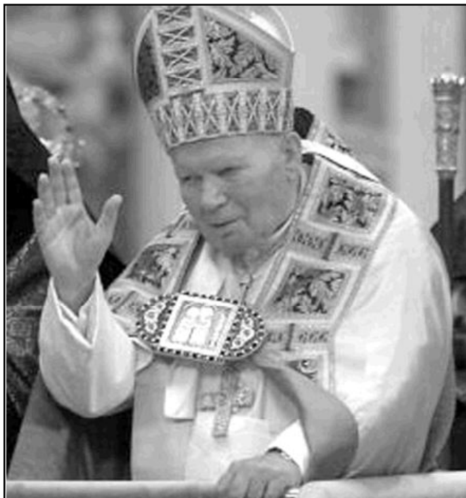
Juan Pablo II llegará a España el próximo 3 de mayo

quien no le estorbaron sus padecimientos desde la niñez (la llamaban la monja de las muletas). Fundadora de las Religiosas Angélicas. Sus restos y Casa Fundadora están en Zaragoza.