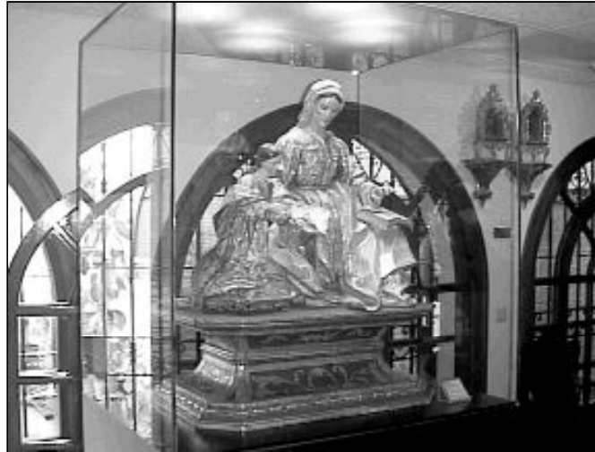
Imagen de Santa Ana, en el Museo del Císter

Esto implica que programación, que le presentaremos en las próximas semanas, sea sustancialmente diferente a la de las demás cadenas televisivas.