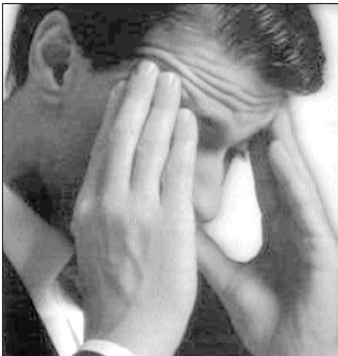
El hombre de hoy está tan ocupado que se olvida de sí mismo