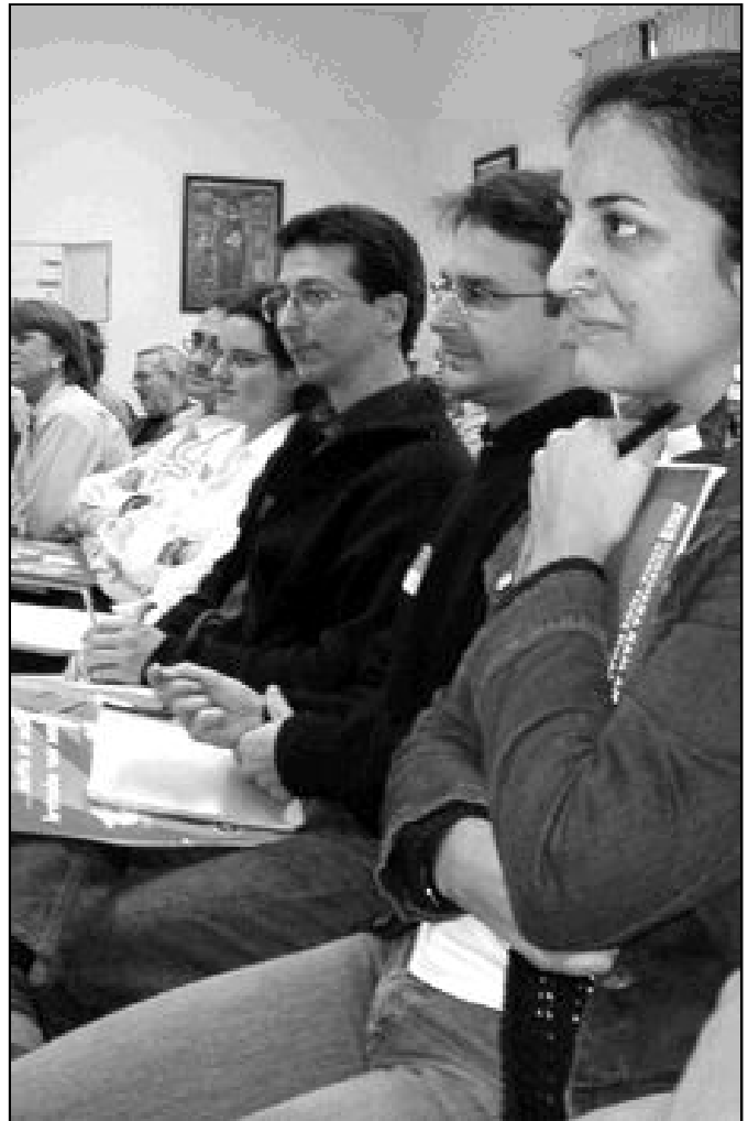
Asistentes al simposio de Pastoral de la Juventud