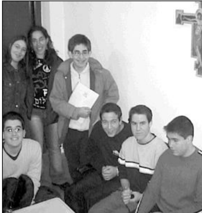
El Papa tiene un especial poder de convocatoria para los jóvenes cristianos

En el análisis que sobre este tema hace el Obispo Echarren