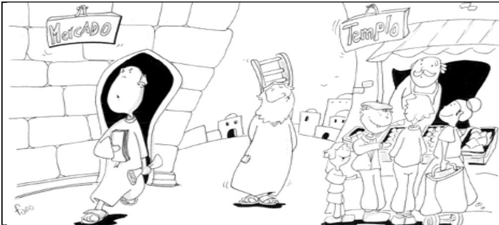
"No convirtáis en un mercado la casa de mi Padre" - Convertid el mercado en la casa de mi Padre