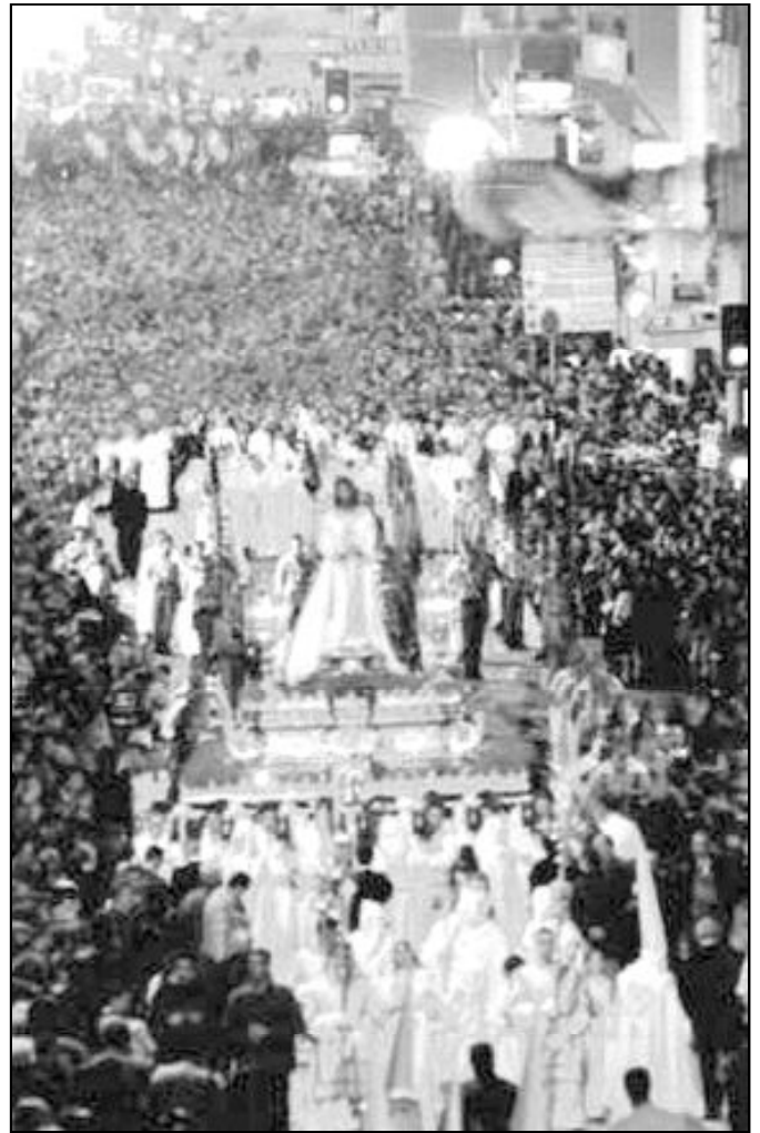
Promesa de Jesús Cautivo del Lunes Santo en su llegada a calle Mármoles