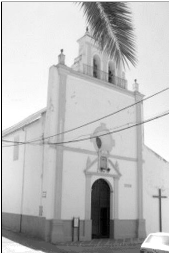
Parroquia de la Purísima Concepción de Almargen

En fechas próximas se incorporará a esta parroquia una comunidad de religiosas de la Fraternidad Reparadora, que también están presentes en Viñuela y Villanueva de la Concepción