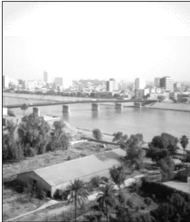
Vista de Bagdad, donde los templos católicos se abrirán para servir de refugio

Las iglesias de Irak quedarán abiertas para que las personas que lo necesiten puedan refugio-arse en caso de bombardeos, anuncia monseñor Jean Benjamin Sleiman, arzobispo de los católicos de rito latino de Bagdad. «Las iglesias quedarán abiertas, independientemente de lo que suceda, para garantizar en cualquier momento un refugio a todos»,