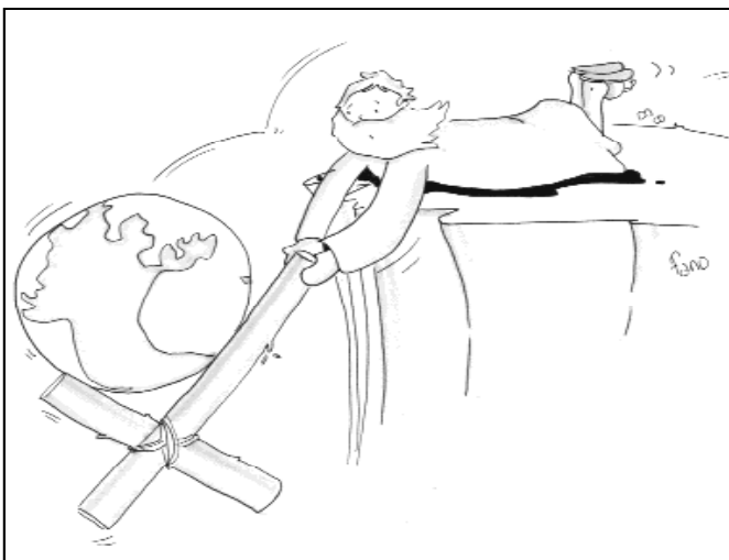
"Dios mandó a su hijo al mundo para que el mundo se salve por Él"

Jesús nos habla del Padre con palabras y gestos de amor. Su palabra más elocuente y su