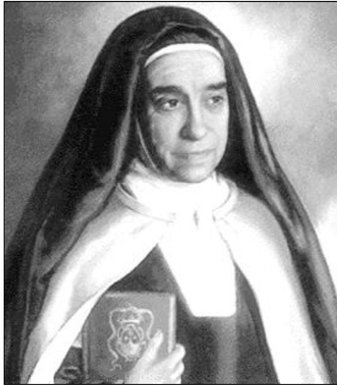
Madre Maravillas de Jesús

La Madre Maravillas, carmelita descalza de 1919 a 1974 fiel en sus obligaciones, cumplidora fiel del espíritu y las normas de su Instituto de Consagrada Carmelita, hasta el último momento de su vida en el que pudo manifestar con realidad lo que expresó rodea-