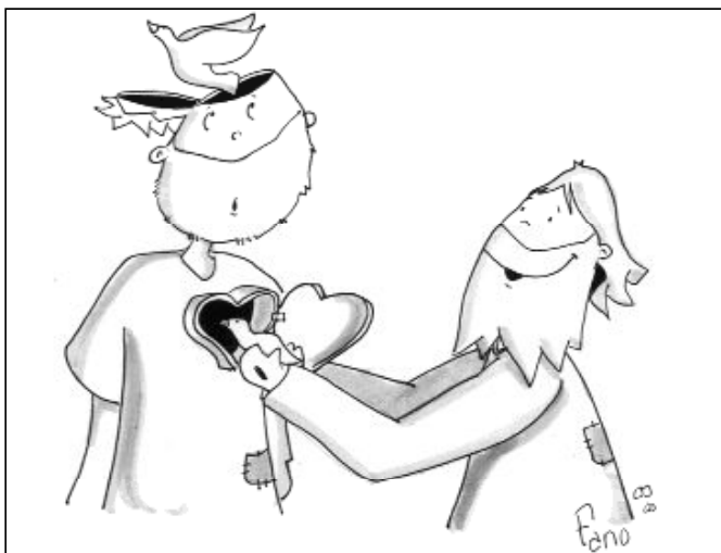
"Entonces les abrió el entendimiento"

Mas Jesús, una vez más, ilumina sus búsquedas, sus necesidades, con la Palabra. Era necesario que todo aconteciera así, incluida la Pasión, la Muerte, la Sepultura. Lo que ha sucedido es el cumplimiento de las Escrituras.