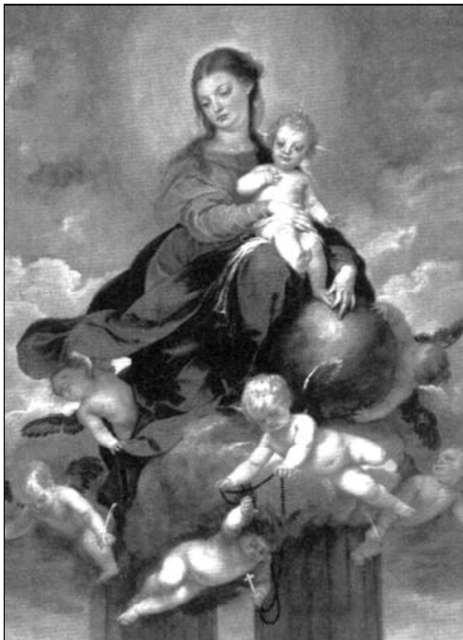
Detalle de “Ntra. Sra. del Rosario”, Alonso Cano. Catedral de Málaga