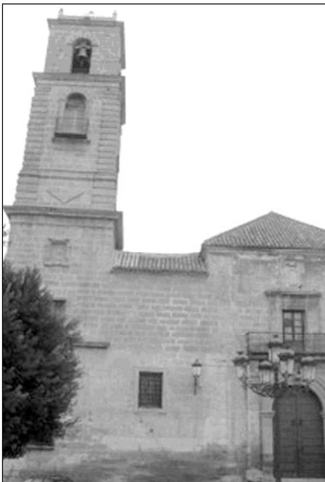
El nuevo templo parroquial de la Encarnación se concluyó en 1699

En el año 1600, se decide construir una iglesia más grande, la nueva PARROQUIA DE LA ENCARNACIÓN. Su construcción dura todo el siglo XVII, concluyendo en 1699. Sus dimensiones son considerables: la longitud es de algo más de 53 metros por 20 de anchura; y para sustentar el artesonado, encontramos robustas columnas de piedra de 1,43 metros de diámetro. Varios templos más encontramos en la demarcación de esta parroquia, que tanto en la población como en las barriadas concitan la devoción de los cristianos perotes. Podemos citar la iglesia de la Veracruz, restaurada hace dos años; la capilla de la residencia de ancianos de la Señorita Laura;