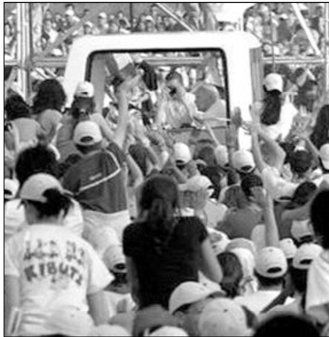
Juan Pablo II congregó a más de 700.000 jóvenes

Al tratar de este asunto hay que partir de la realidad evidente de que existen muchos más santos de los que se encuentran en los libros llamados santorales, incluso incluyendo a los que se han nombrado previamente bienaventurados, esperando un día ser canonizados. Es evidente que debe existir una ingente muche-