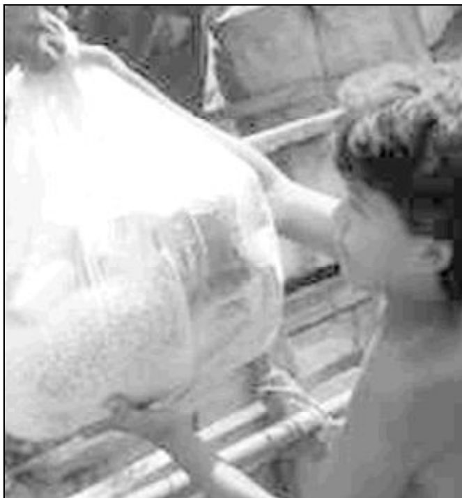
Cáritas organiza ayuda humanitaria en Irak

Cáritas Internacional, en coordinación con Cáritas Irak, está analizando en Bagdad, a través de diferentes encuentros con los obispos locales y los responsables de los 14 centros de distribución de ayuda que Cáritas posee en Irak, las prioridades de intervención humanitaria tras la guerra. «En estos encuentros se ha constatado la actividad incesante que los distintos centros de Cáritas han estado desarrollando a lo largo de toda la guerra para socorrer a la población local, con