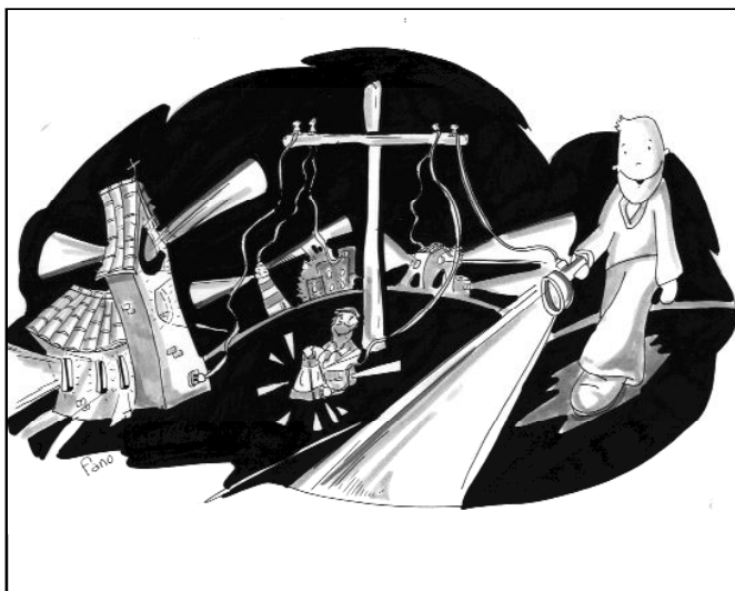
"Permaneced unidos a mí"

Aceptamos cuidar y es necesario- valores como la honradez, la fidelidad a la palabra, el servicio a los demás... pero olvidamos que la fe que es don de Dios tiene que ser acogida, interiorizada, respondida y contagiada. Que la fe, que es vida, debe crecer, es camino a recorrer, tiene su centro en Jesucristo. Es tan indispensable que el conocimiento mismo del Señor sólo es