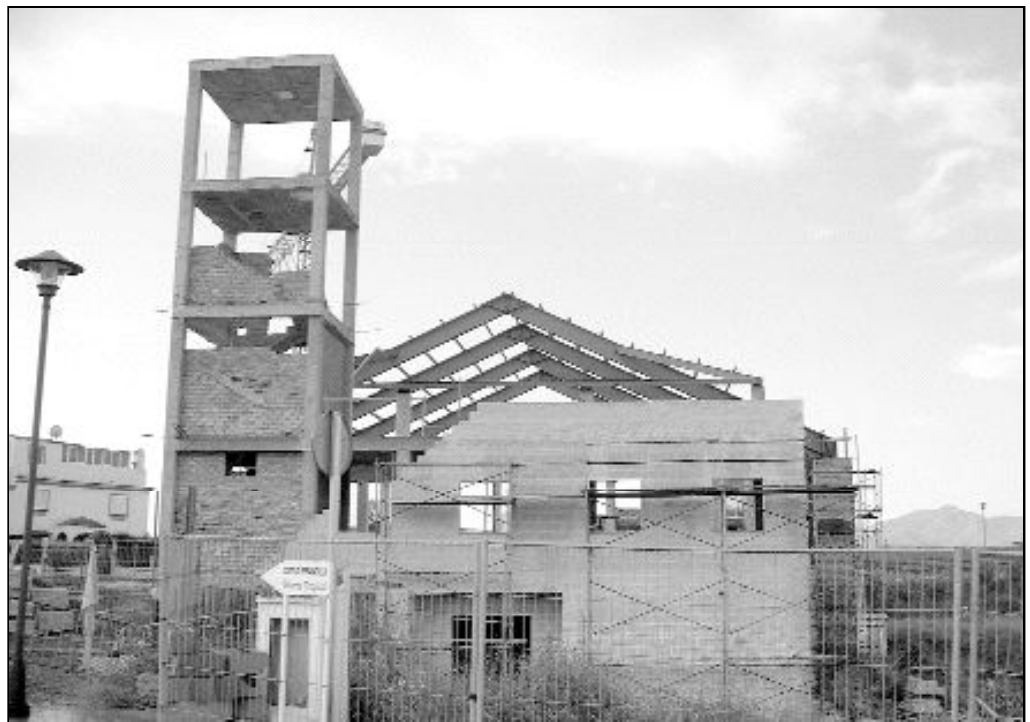
Obras de uno de los últimos templos construidos por la diócesis, el de la barriada de Campanillas