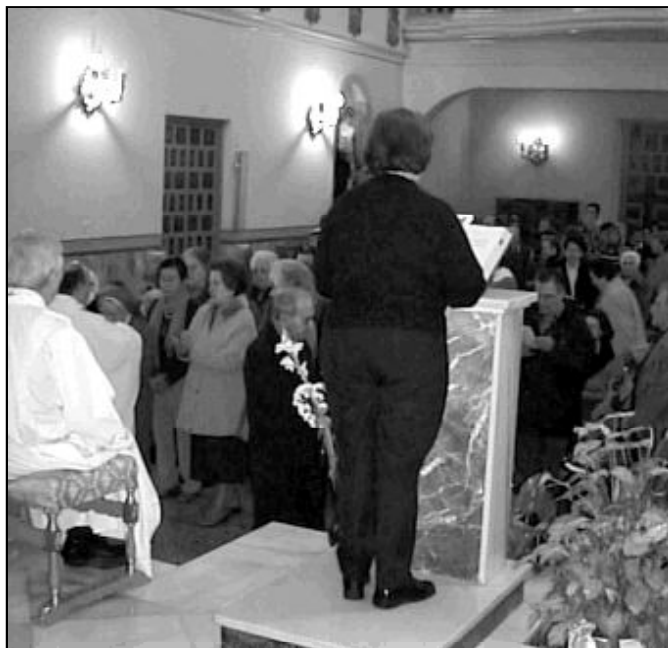
Los feligreses enfermos participan activamente de la Eucaristía