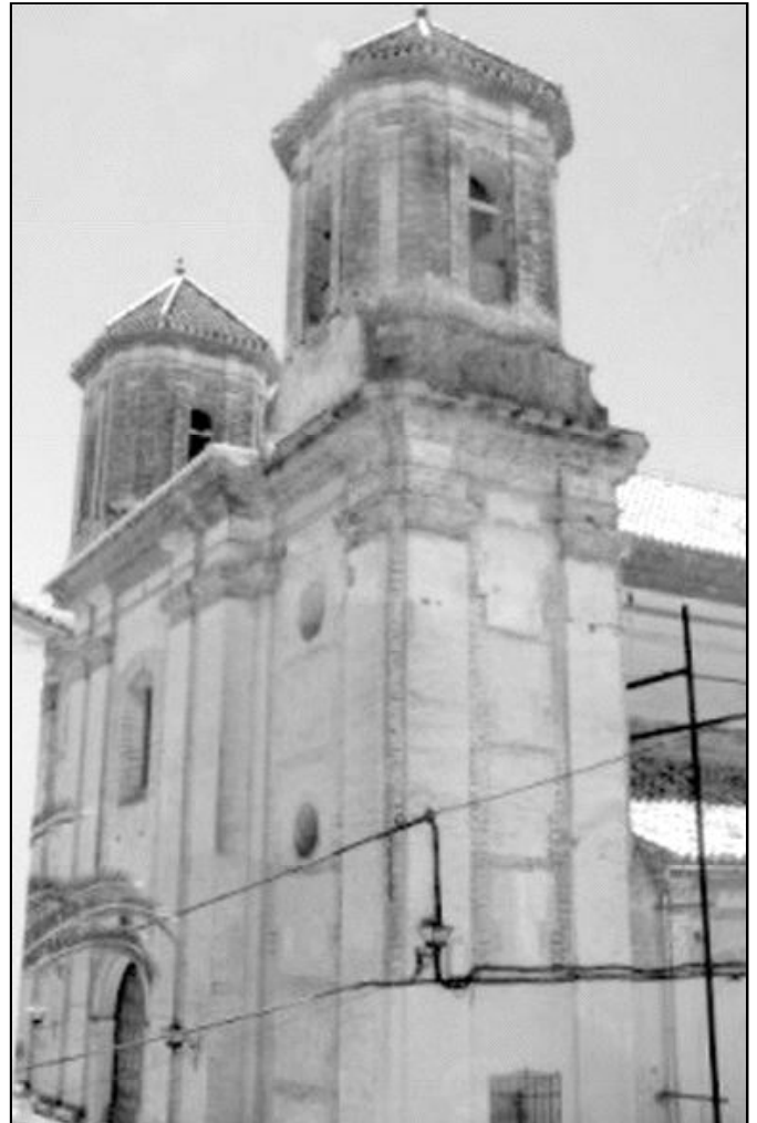
El templo parroquial de Alpandei destaca por sus dimensiones

Asimismo, se está intentando poner en marcha el equipo de economía de la parroquia.