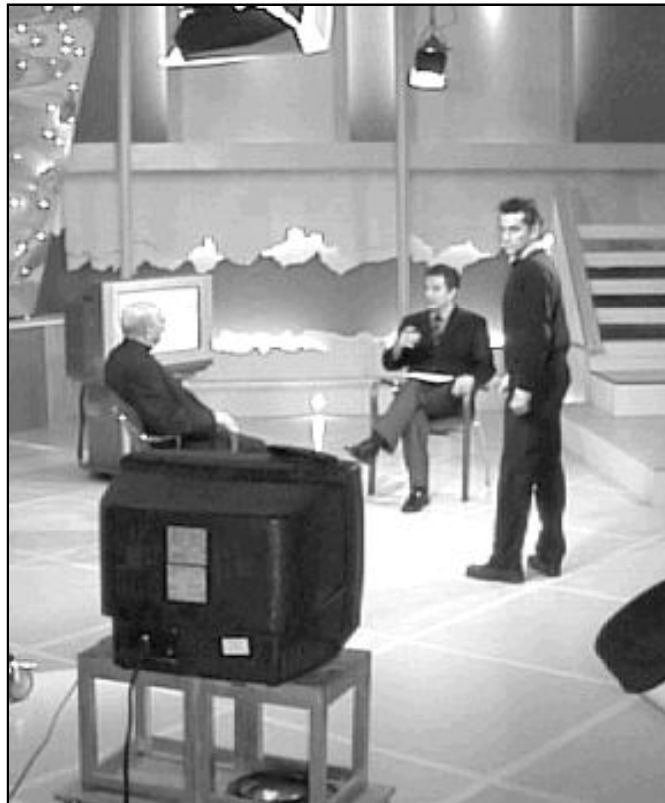
La puesta en marcha de Popular TV será tratada en el próximo pleno del CPD

Según nos informa Alfonso Crespo, el 70% de las citas de los