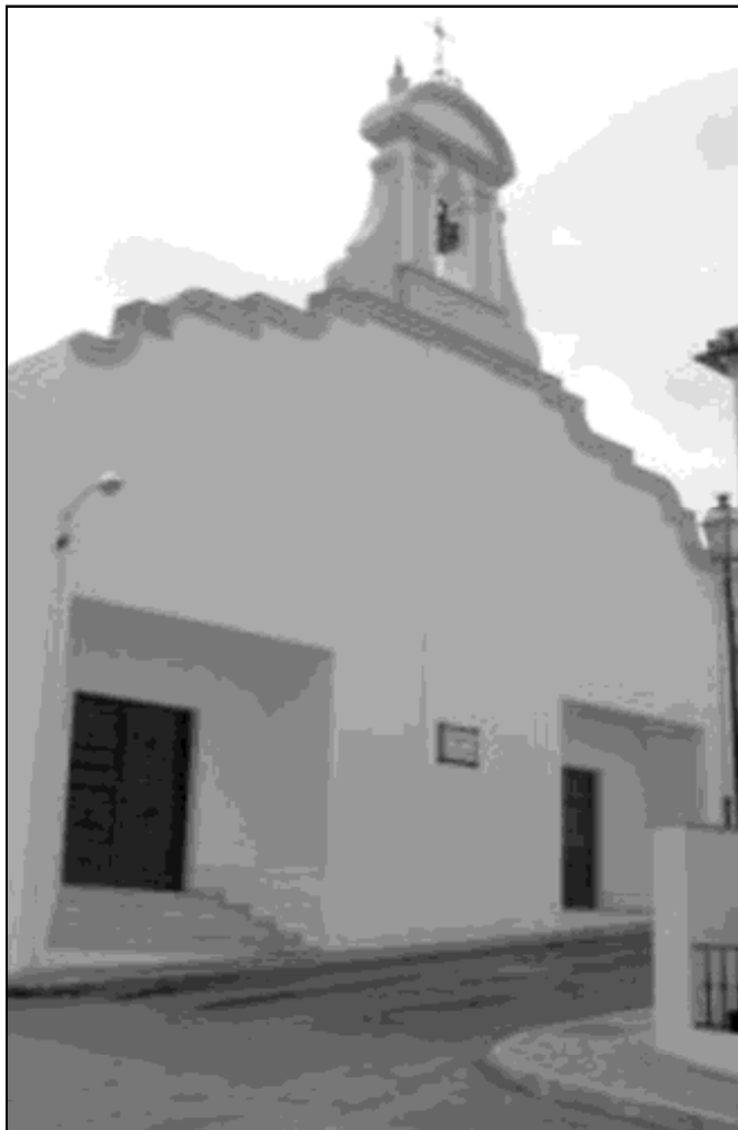
Fachada de la Iglesia de El Salvador en Antequera

Dentro de los actos festivos del barrio, hay que destacar la verbena, que se celebra el 6 de agosto en la explanada de la parroquia con motivo de la Transfiguración del Señor.