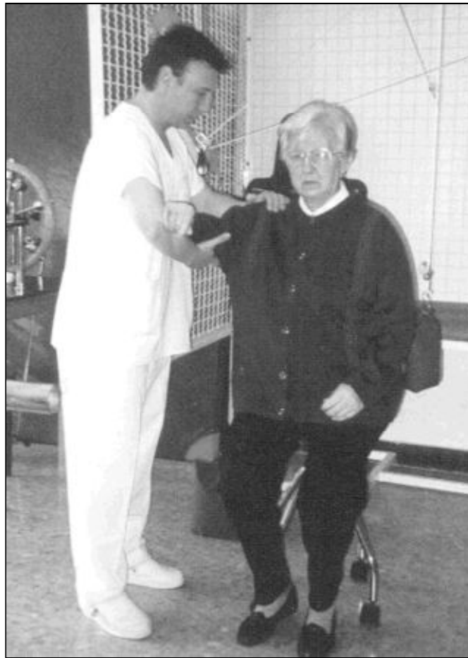
La Iglesia siempre ha procurado atender al enfermo

Las razones de este cambio son de orden teológico, pero responden también al incremento de la esperanza de vida en la sociedad actual, en la que ha disminuido sensiblemente el índice de mortalidad en relación al pasado. La Iglesia siempre ha procurado atender al enfermo mediante el acompañamiento espiritual y humano, con el espíritu de amor que suaviza el dolor y acompaña la soledad.