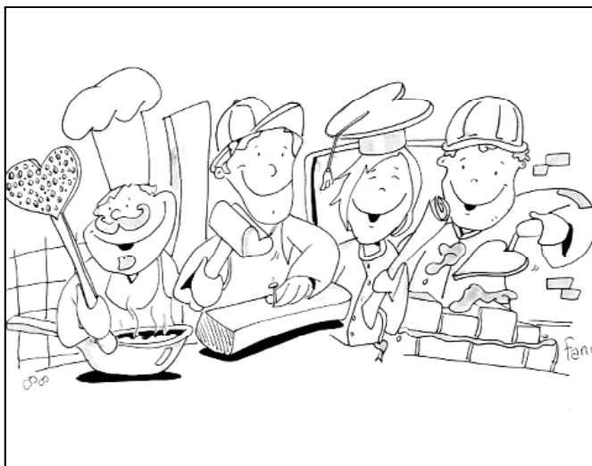
"El instrumento de mi vida, el amor"

evangelio que podemos llamar de las intimidades, de las voluntades de última hora, tiene matiz muy especial en relación al amor: "amáos como Yo os he amado". Cristianamente no debo amar como me amo a mí, ni siquiera como amo a Jesucristo, sino como Él me ama a mí. Por eso amar a los demás sin contemplación, en clave evangélica, es imposible. Podré amar pero no según el mandamiento nuevo. Es amar como Jesús, el siervo, es amar hasta dar la vida, es amar desde la Encarnación hasta la cruz, "despojados de todo rango divino", que cantaba la comunidad de Filipos.