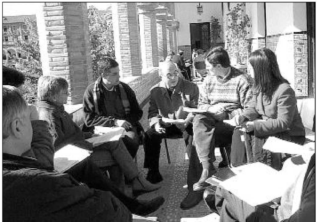
Reunión por grupos del Consejo Pastoral Diocesano en la Casa Diocesana de Espiritualidad